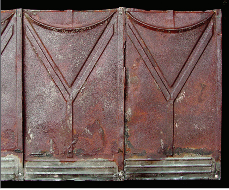
Desen basılmış shingle örneği.

Teneke levhalar yukarıda değinildiği gibi standart boyutlarda ve üzerlerine bir desen basılmış halde bulunuyordu (shingles). Bunların kaplama işlemi, konut cepheleri ahşap olduğundan doğrudan ahşabın üzerine çivilenerek yapılmıştır. Tenekeler birbiri üzerine bindirme ve geçmeli olarak kaplandığından, bu tür uygulamada çiviler görünmemektedir. Eğer kaplanan yan cephe aynı zamanda bir yangın duvarı ise, yani kagir ise, o zaman önceden yapılan ahşap ızgara üzerine teneke kaplama yapılmıştır.