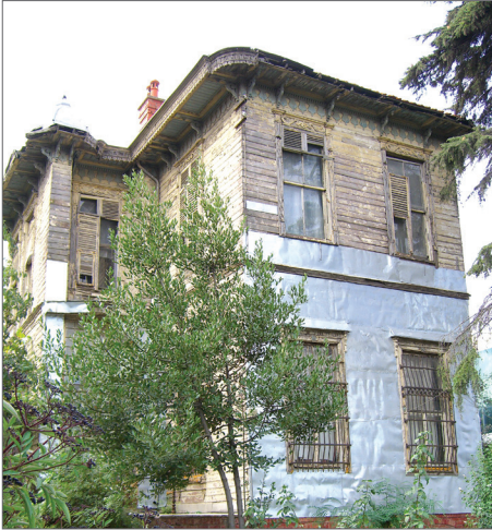
İstanbul - Altunizade teneke cephe kaplaması