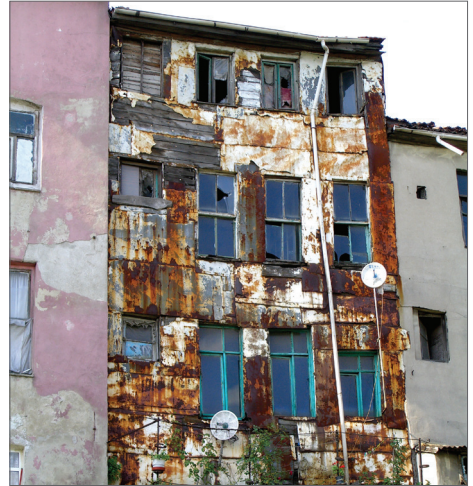
İstanbul - Balat'ta paslanmış teneke cephe kaplaması

yan cephesi ise, bu cephe basit bir şekilde kaplanmış, ön cephe kuzey cephesi ise genellikle daha gösterişli ve süslü olarak kaplanmıştır. Bu kaplama sanatsal ve bütüncül bir çalışma olduğundan genelde evin tüm cepheleri kaplanmış, ancak ön cepheye daima daha fazla özen gösterilmiştir.