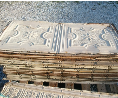
Desen basılmış shingle örneği.