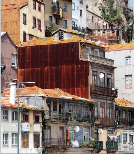
Portekiz - Porto şehrinde paslanmış ve akmış teneke cephe