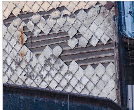
Ahşap ızgara üzerine teneke kaplama.