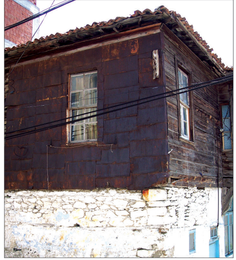
Balıkesir - Marmara Adası'nda paslanmış ve akmış teneke cephe