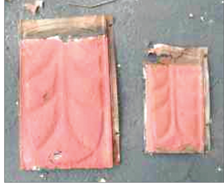
Desen basılmış shingle örneği.