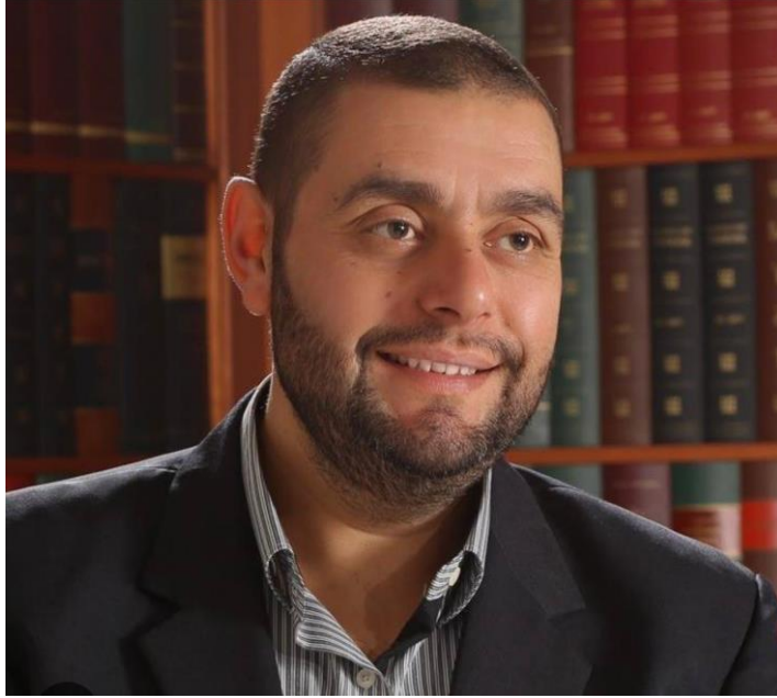
Görsel 2.1. Eymen el-'Atûm

kurguya döktüğü Yâ Sâhibeyissicn (Ey Cezaevi Arkadaşlarım) isimli romanı, 57 adeta “Hoşlanmadığınız şeylerde sizin için hayır olabilir” 58 mealindeki ayetin tecellisi olmuş ve yazarın edebi ününe katkı sağlamıştır.