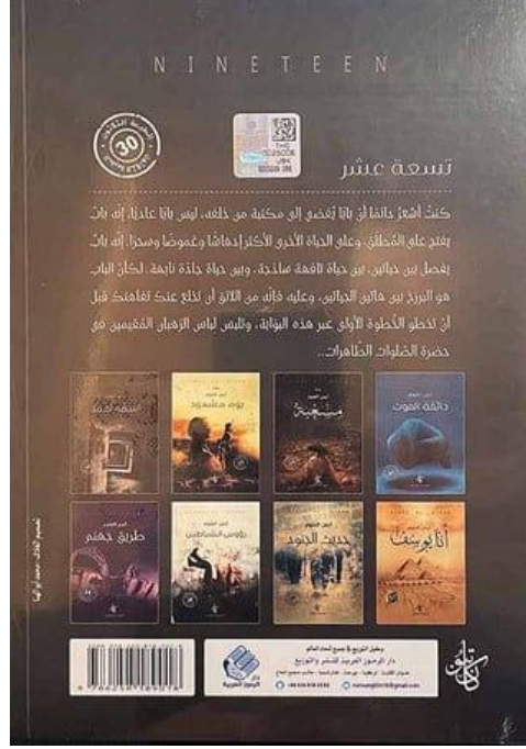
Görsel 3.2. “Tis’ate ‘Aşer” Arka Kapak

Kitapların arka kapakları genelde okuyucuya kitap hakkında kısa ve özet bir bilgi vermeyi hedefler. 129 Bazense kitabın içinden bir paragraf seçilerek bu yazı arka kapağa konulur. Tis’ate ‘Aşer adlı romanın arka kapağı incelendiğinde roman içerisinden bir paragrafın alıntılandığı anlaşılmaktadır. Metnin Arapçası ve tercümesi şu şekildedir: