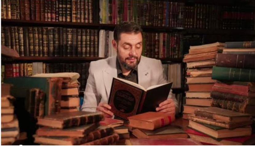
Görsel 2.2. “Eymen el-‘Atûm

Eymen el-‘Atûm’un birçok romanı, şiir divanı ve tiyatro çalışmalarının yanı sıra yayımlanmamış birçok eseri bulunmaktadır. Yazarımız, kendisini şair olarak nitelemiş olsa da okurlarından ve sosyal platformdan romancılığının daha planda olduğu kanısına vardık.