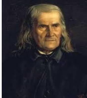
Görsel 3 Friedrich Rückert

Johann Michael Friedrich Rückert şair, filolog ve Almanya'daki akademik Doğu araştırmasının merkezi figürüdür. Friedrich Rückert'in alışılmadık dil hakimiyeti ve tarihsel koşulların özel konstelasyonu, onun sayısız başarısı için eşit derecede belirleyicidir. Friedrich Rückert'i 19. yüzyıl yazar ve dilbilimcisi olarak neyin bu kadar özel kıldığını ve neden bugüne kadar güncelliğini kaybetmediği ele alınacaktır.