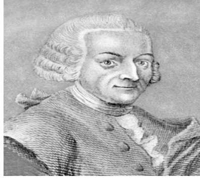
Görsel 1 Johann Jacob Reiske

Hayatını İslam medeniyeti ve Arap dili çalışmalarına hasreden ilk Alman müsteşriklerden olan Johann Jacob Reiske önceleri cahiliye devri Arap şiiri, özellikle Tarafe b. Abd'in Muallağa'sı üzerinde çalışmış ve bu eseri Latinceye çevirmiştir. (Leiden 1742). Daha sonra yaptığı çalışmalarla İslam medeniyeti ve Arap dili konusunda uzmanlaşmıştır. 48