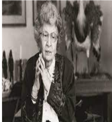
Görsel 5 Annemarie Schimmel