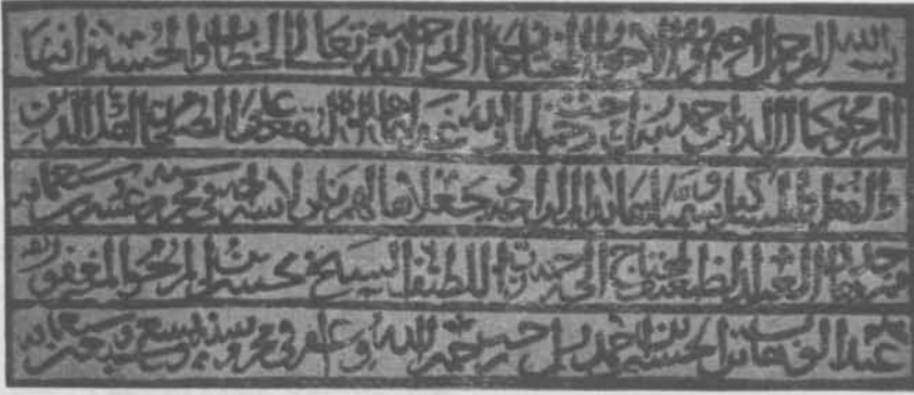
Dârurrâha teccid kitâbesi (Muh. 779 H./1377 M.)

cereyanların fikirlerini yaydıkları, tarikat mensuplarının toplandığı yerleri kurmak, bir diğeri de boş topraklar üzerinde yerleşme ve bu toprakları canlandırarak gelirinden yararlanmak şeklinde özetlenebilir. 7 Dârurrâha ne sırf dinî bir mekân ve ne de gelip geçenlerin barınacakları, yiyip içecekleri bir konak görünümündedir.