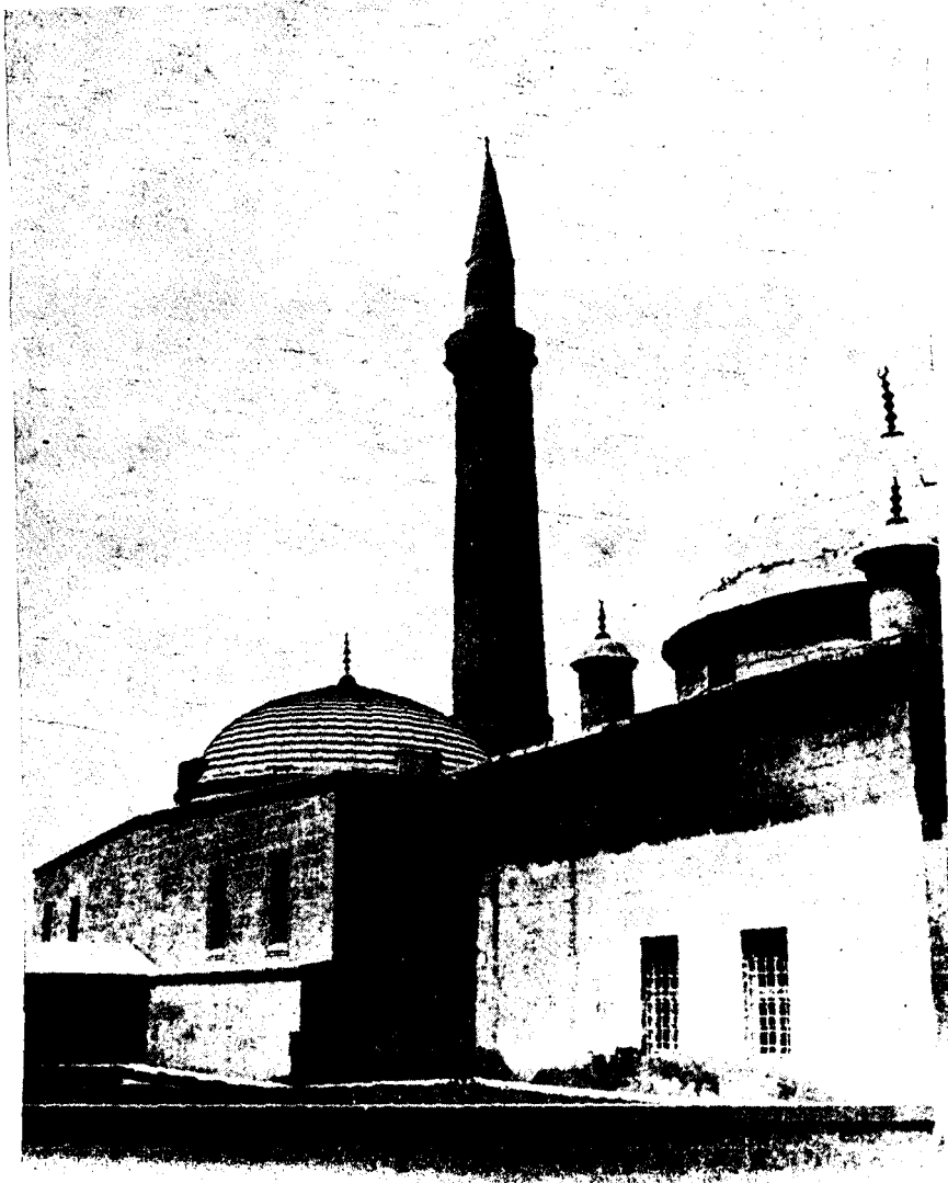
Res. 3 — Raşit Efendi Kütüphanesi, doğu cephesi ve Ulu Cami