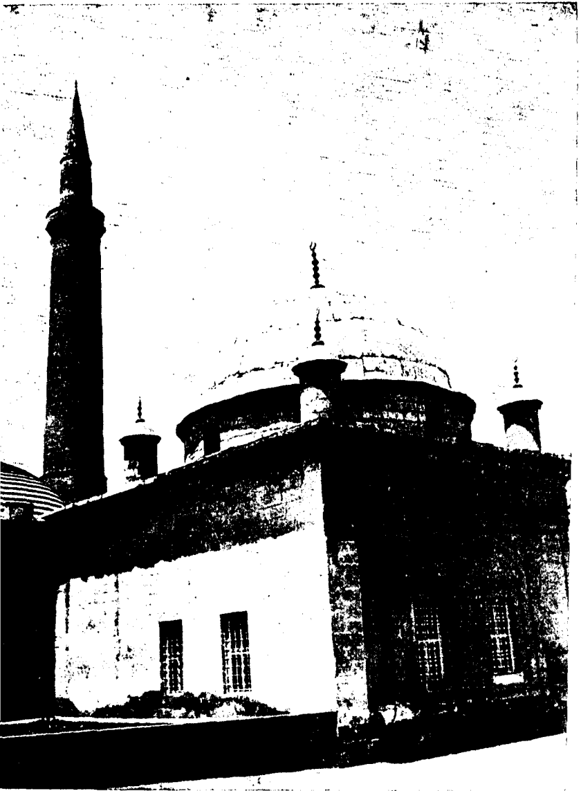
Res. 2 -- Raşit Efendi Kütüphanesi Kuzey - doğu görünüşü