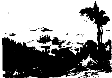
Besiktaş Sırtlarından Boğaz

15 kadırga, 3 mavna 24 , 979 (1571)'de 25 kadırga 25 yer almaktaydı. İnşa edilen gemi çeşit ve miktarlarından Sinop Tersânesinin Galata ve Gelibolu'dan sonra üçüncü büyük tersâne olduğu anlaşılmaktadır.