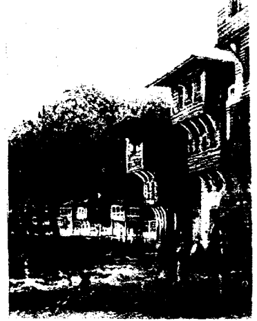
Günlük Hayatta Kayıklar