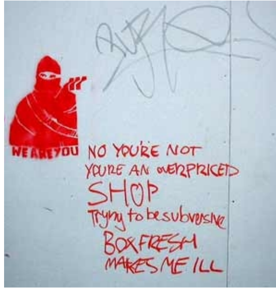
Şekil 2 ( http://www.e-skop.com/skopbulten/goruluyorum-oyleyse-varim/459#.UVjMuk_pbul.email )

“Birkaç sene önce Londra sokaklarının duvarlarında Zapatist lider Subcomandante Marcos'un imajı ile ‘Biz Seniz’ sözlerinin yer aldığı stensiller peyda olmuştu. Graffiti ilk bakışta ajit-prop sokak sanatı izlenimi uyandırıyor ama, daha dikkatli bakıldığında Marcos'un imajının kenarında üç adet kıvrımlı şeritten oluşan bir işaret görülüyordu. Bu işaret, Londra'daki ‘Box Fresh’ adlı giyim mağazasının logosuydu. Markanın Zapatist imajlarını temellük etmesi reklam stratejisiyle de sınırlı kalmıyordu; 30 sterlin karşılığında Box Fresh mağazalarından bir ‘Zapatist seti’ alabiliyordunuz: Bir adet tişört, bir stensil ve spreyci boya. Böylece 30 sterlin karşılığında herkes Zapatist ve isyancı olurken, Marcos'un zulme ve adaletsizliğe direnen herkesle bir olduklarını ifade eden sözleri de, ismiyle müsemma markanın sloganına dönüşüyordu – zira ‘Box Fresh’, kelime anlamıyla ‘yeni, cool ve yaratıcı’ demektir.”(10)