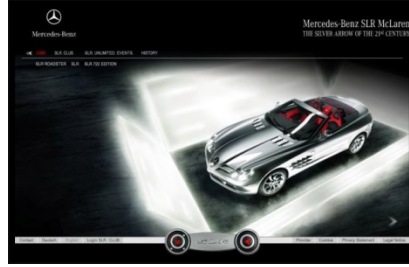
Şekil 3 Dünyanın en prestijli tasarım ödülleri arasında bulunan Red Dot ve iF Design yarışmalarından örnekler.

Bir yerlerde, birileri o salt sanatı üretmeye devam ediyor. Eğer sanatçı tekrar gerçek insana dokunmak istiyorsa, oturtulduğu o yüce tahttan inerek tasarımcının gösterdiği cesareti göstermeli ve sokağa karışmalıdır. Ama bunu ödün vermeden, popüler olmaya çalışmadan yapacaktır. Ben bunun karşılığının bir şekilde olduğuna ve zamanın da şimdi olduğuna inananlardanım. Yeni nesil genç sanatçılarda bu cesaret olsa da, sokak sanatının da aslında karşı çıktığı galerilerle aynı ifade biçimine düşme tehlikesinde olduğunu söyleyebiliriz.