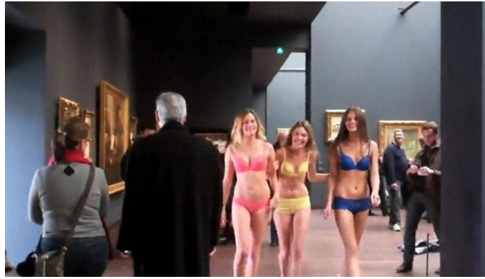
Şekil 1 ( http://www.dailymail.co.uk/femail/article-2085528/Lingerie-models-museum-Musee-dOrsay-blasts-Etam-filming-semi-naked-video-gallery.html )

9 Ocak 2012’de Paris’teki Orsay Müzesi’nde gerçekleştirilen bir ‘korsan performans’, sanatın bazı araçları kullanırken ne kadar dikkatli olması gerektiğine iyi bir örnek. Müzeye ziyaretçi olarak giren üç kadın, içeri girdikten sonra ziyaretçilerin şaşkın bakışları altında soyunmuş ve dünyanın en ünlü empresyonist tablolarına ev sahipliği eden müzenin salonunda iç çamaşırlarıyla dolaşmaya başlamıştı. İlk başta sanatsal bir gerilla hareketi olarak algılanan bu ‘eylem’ izleyiciler tarafından ilgiyle karşılandı ve kayıt altına alındı. Sonuçta kadınlar güvenlik güçleri tarafından dışarı çıkartıldılar.