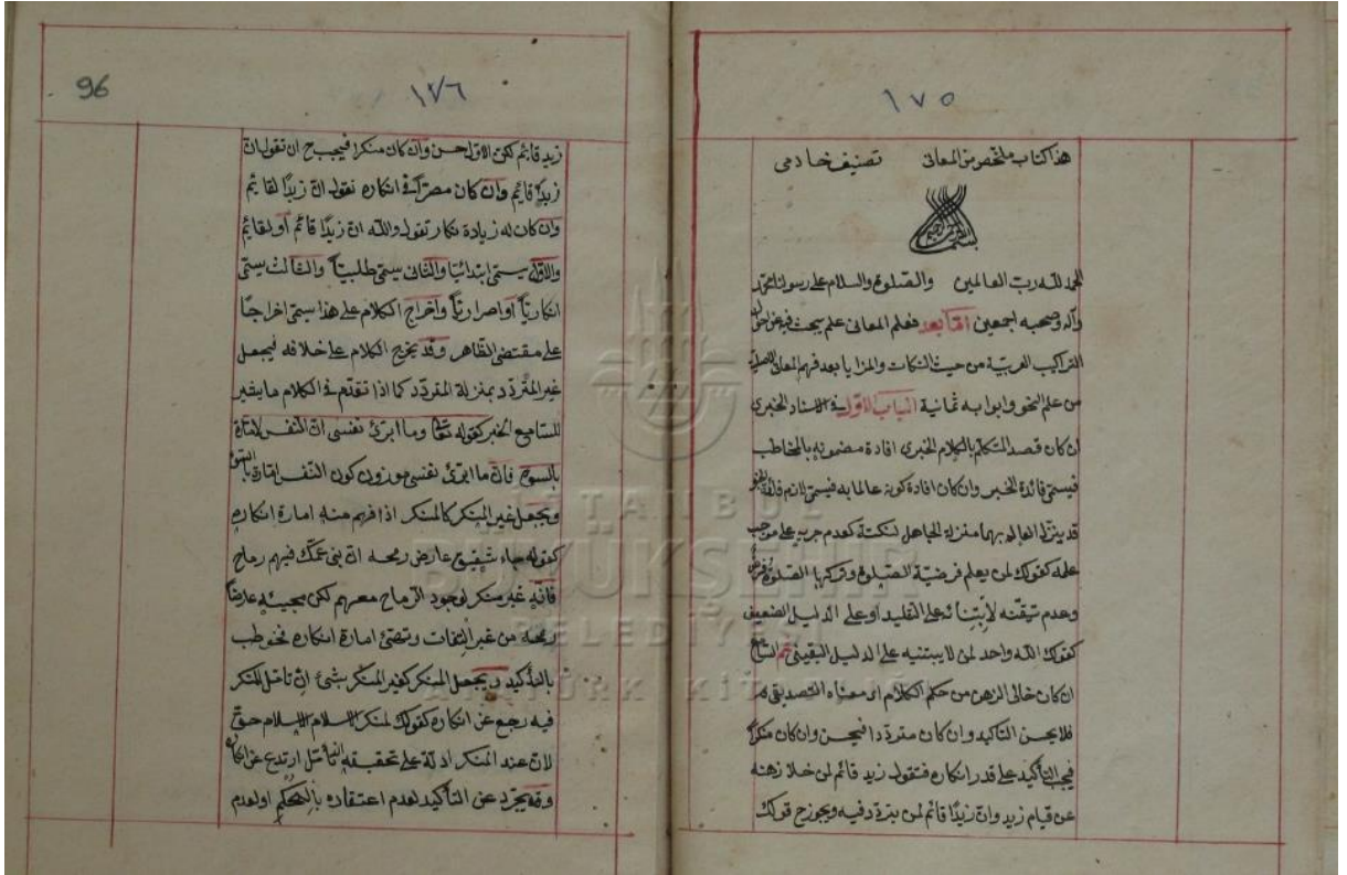
I.B.B. Bâ Nüshasının İlk Sayfası