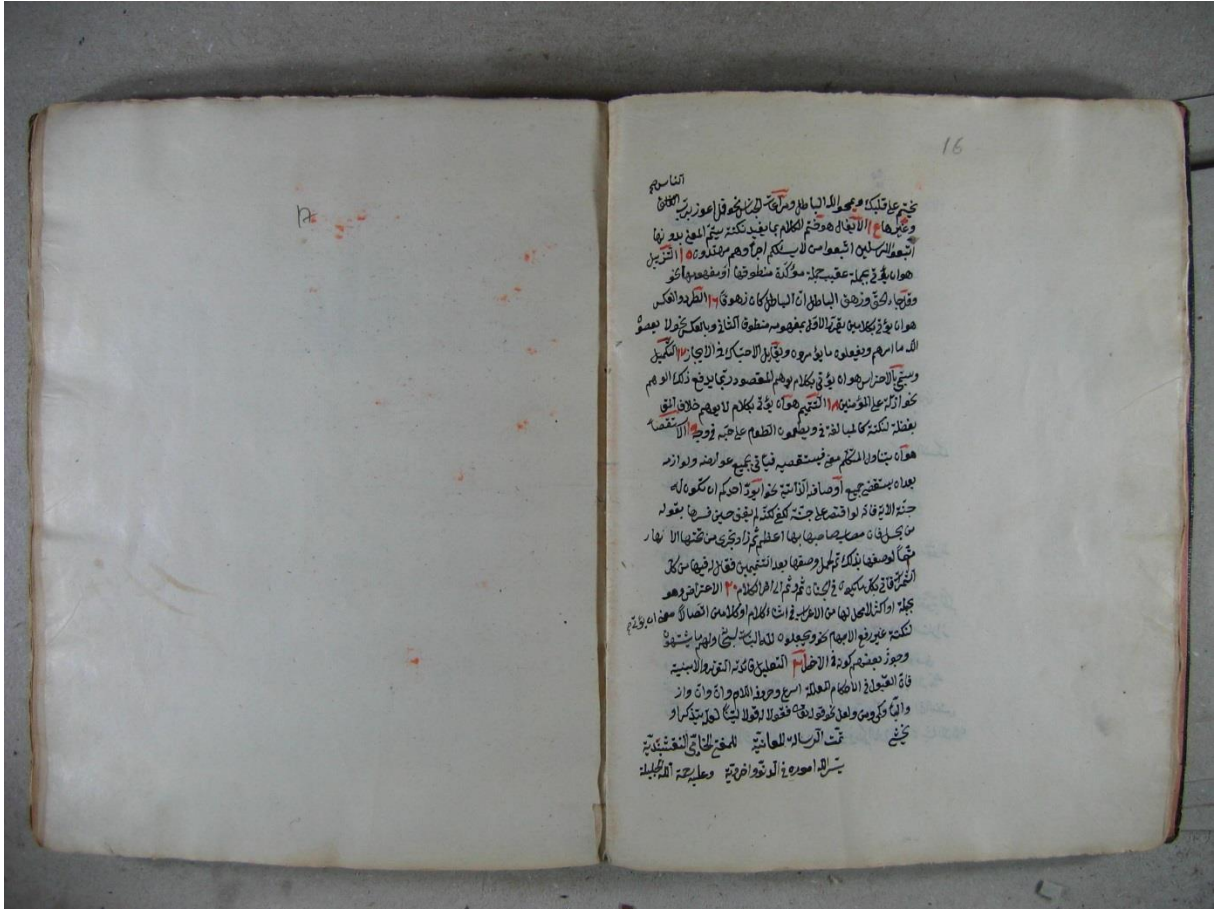
Konya Kütüphanesi Burdur İl Halk Koleksiyonu Cim Nüshasının Son Sayfası