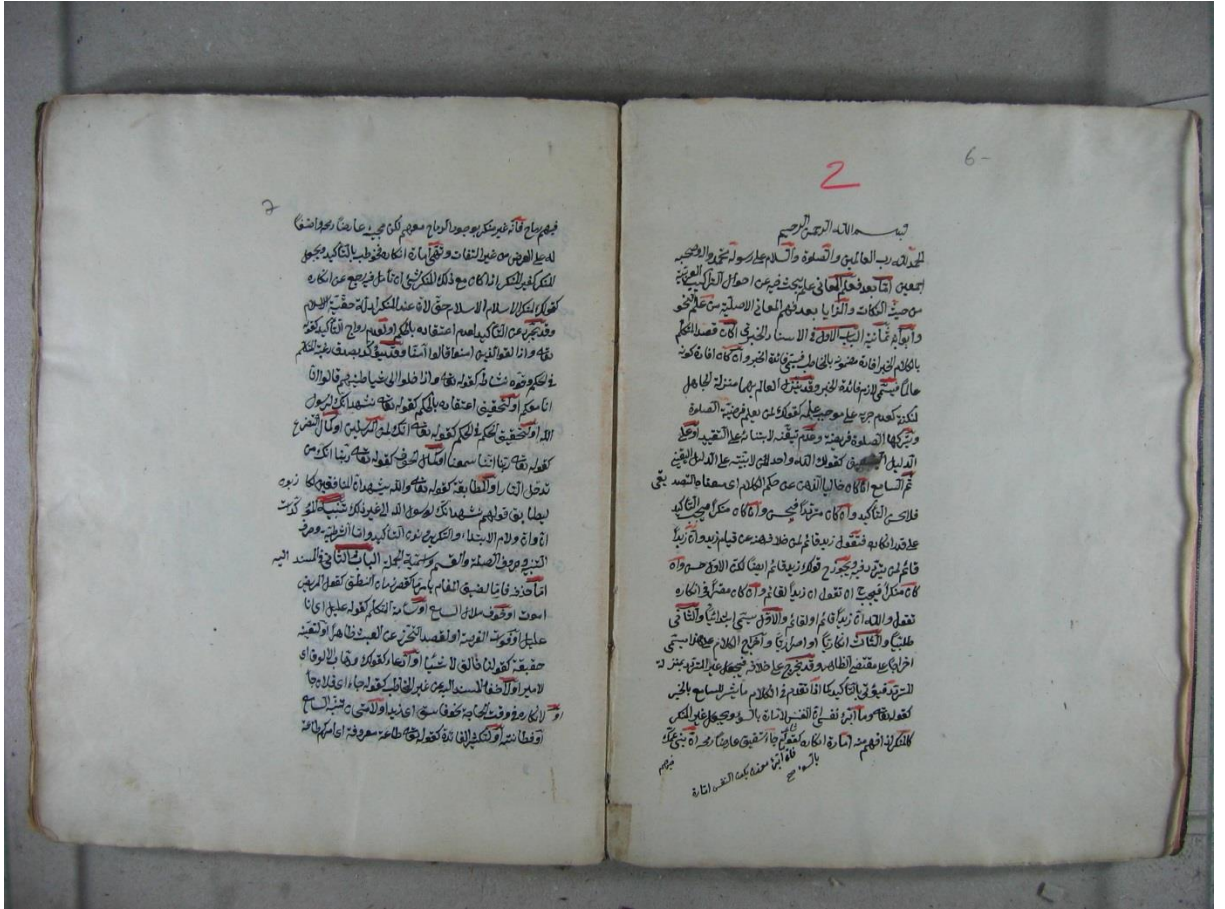
Konya Kütüphanesi Burdur İl Halk Koleksiyonu Cim Nüshasının İlk sayfası