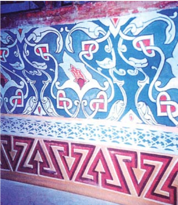
Resim, 10- Gezinti mahalli üstünde kalemişi, restorasyon sonrası

Mermer minber, mahfil ile mermer sütun ve korkulukları mevcut haliyle korundu. Yeşil zemin üzerine altın varaklı nebati tezeyinat bulunan ahşap minber külâhı bakıma alınarak, değişmesi gereken 4 dilimi yenilenmiş, mevcut renkteki altın varaklı tezeyinatı da tamamlanmıştır.