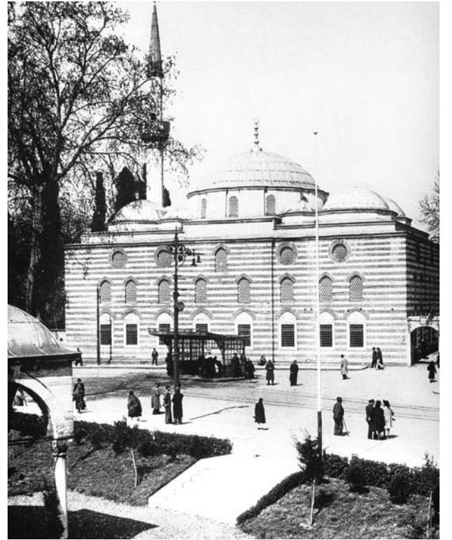
Resim, 1- 1970'lerdeki haliyle Sinan Paşa Camii

Eski Onarımlar: 18.yüzyılın ortalarında, önde bulunan sundurmanın eklenmesiyle yapı biraz değişikliğe uğramıştır. 19.Yüzyıl içinde cami ana mekânı, kalemişleri ile süslenmiştir. Bu da, yapının önemli bir onarımdan geçirildiğini ortaya koymaktadır. Yapı orijinalde de kalemişi bezemeye sahiptir ki, raspalardan da bu netice ortaya çıkmıştır. 1936-37 yıllarında