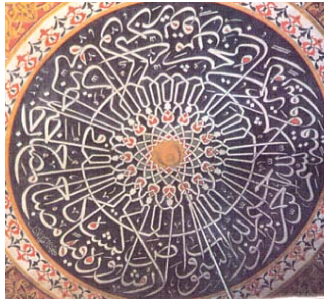
Resim, 5- Restorasyon sonrası ana kubbe

Kasnak altı ve pandantif bölümlerinde yapılan raspa çalışmaları sonucunda II. dönem nebati ve hendesi bordürler bulundu. Bunlar ana kubbenin gölgeli klasik kalem işlerinin devamı olan pandantiflerdeki kalem işleriyle olan üslup ve renk uyumu da göz önüne alınarak birlikte uygulandı.