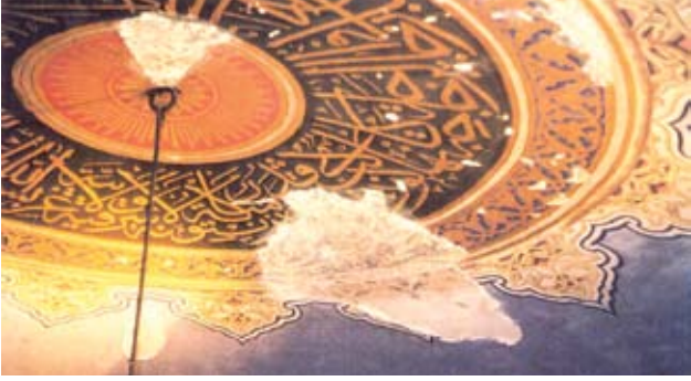
Resim, 3- Sinan Paşa Camii-Restorasyon öncesi Ana kubbe

Beşiktaş Sinan Paşa Camii onarımı içerisinde tezyini imalatlara 2002 yılı sonu itibarı ile başlanmıştır. Vakıflar İstanbul I.Bölge Müdürlüğü olarak yürüttüğümüz çalışmada önce ana kubbe mahalline iskele kurularak kubbeye badana ve sıva raspası yapıldı. Bu çalışmalarda badana altından 2 ayı sıva ve bu sıvalar üzerine yapılmış 2 ayı dönem kısmi kalem işi örnekleri bulundu.