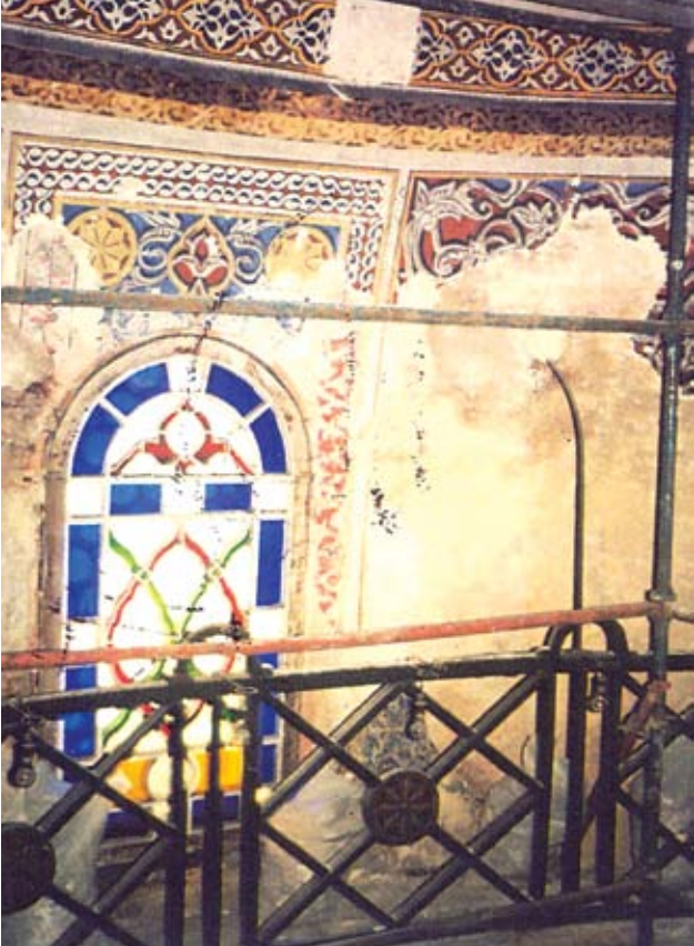
Resim, 7- Gezinti mahalli üstünde kalemişi raspası