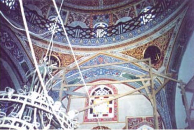
Resim, 9- Bingilerdeki kalemişi

Mihrap cephesi sağ ön ve yan pencere aynaları mevcut haliyle bırakıldı. Aynı şekilde, sağ fil ayağın silme profil ve kalem işli başlık kısmı örnek olarak bırakıldı. Alt bölümünün sıvası ile diğer fil ayağın sıva ve kalem işleri tamamlandı.