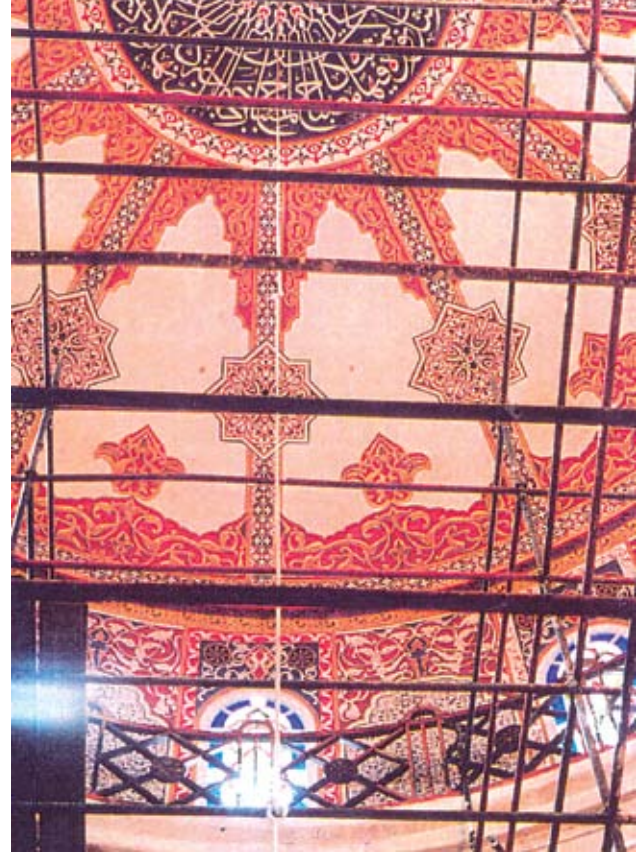
Resim, 8- Gezinti mahallinin üst kısmı restorasyon sonrası