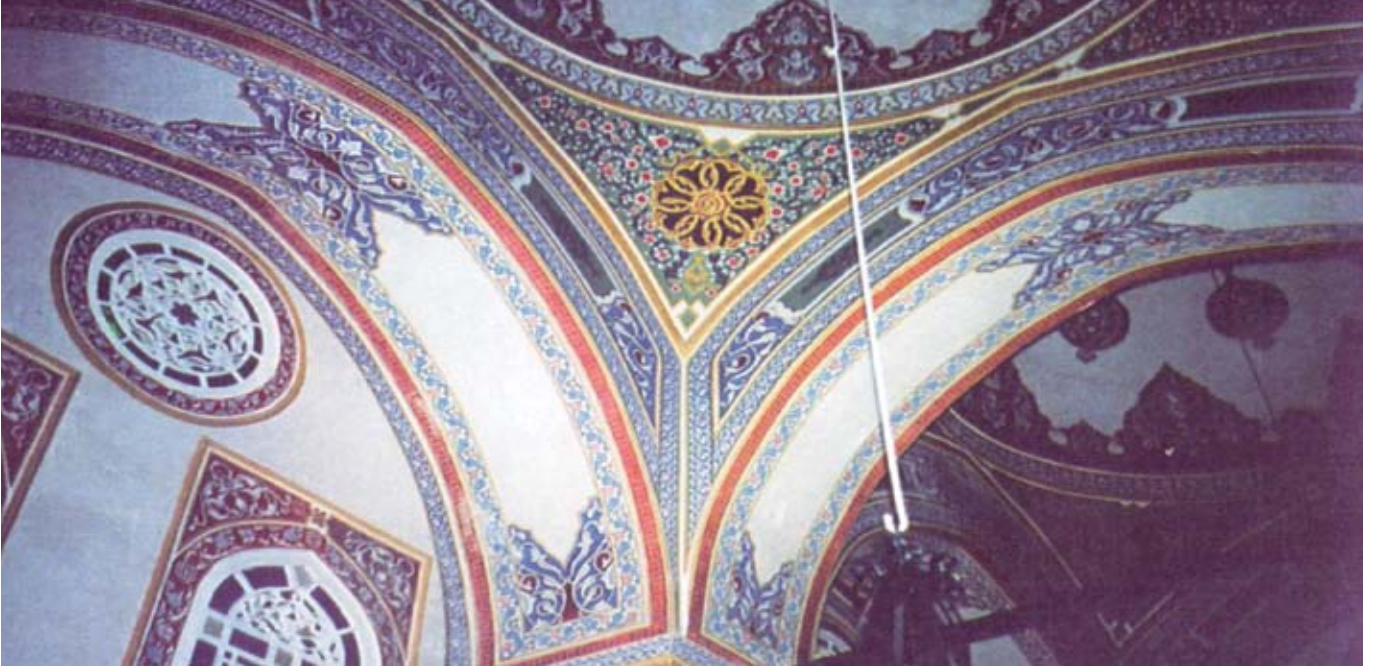
Resim, 14- Pandantifler üzerindeki kalemîşi bezeme

Süpürgelik üst kısmında bulunan özgün somakiler, aynı üslupta tamamlandı.