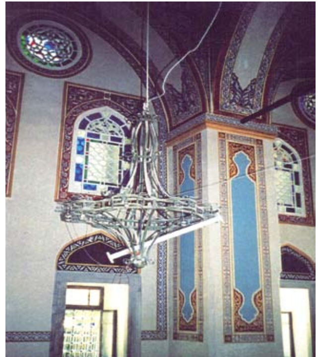
Resim, 13- Alt kat pencereleri restorasyon sonrası

Kubbeleri bağlayan Kemer alınlarında ve kemer altlarında yapılan raspa çalışmalarında kayda değer sıva ve kalem işlerine rastlanılmadığından mevcut son dönem esas alınarak, renklendirme yapılmıştır.