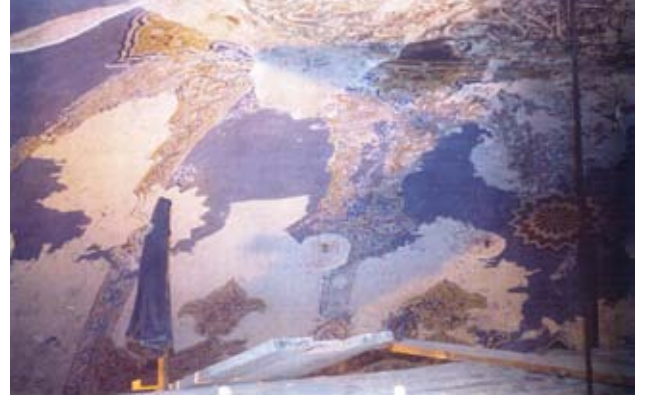
Resim, 4- Sinan Paşa Camii-Ana kubbeye yapılan raspa çalışması

Her iki dönem örneklerinin 1/1 kopyaları alınarak, fotoğrafları çekildi ve 1/10 renkli proje çalışmaları yapıldı.