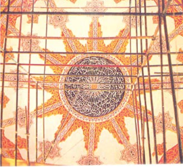
Resim, 6- Restorasyon sonrası ana kubbe

Bu mahaldeki tüm pencere çevresinde yer alan alçı kornişler taksimatlarına göre yerlerine applike edilerek, yapının mimarisinin belirginleşmesi sağlandı.