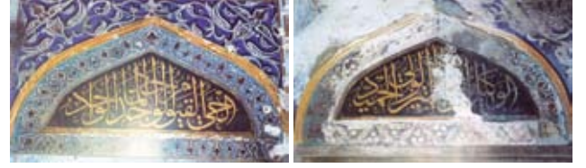
Resim, 11-12- Alt kat pencere restorasyon öncesi

Son cemaat mahallinde sıva raspa yapılırken tespit edilen iki adet mihrabiye ile bir adet niş, dolgu halde bulunan moloz taşlardan temizlenerek meydana çıkarılmış, niş ile mihrabiyelelerinden biri onarılmıştır.