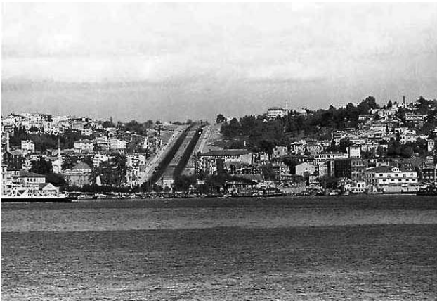
Resim, 1-Eski bir fotoğrafta Beşiktaş ve solda Sinan Paşa Camii

Mimar Sinan'ın yeni denemelere gittiği yapılar arasında Sinan Paşa Camii'nin de kendine özgü bir yeri vardır. Yapı, Edirne'deki Üç Şerefeli Camii'nin planını neredeyse aynen tekrar