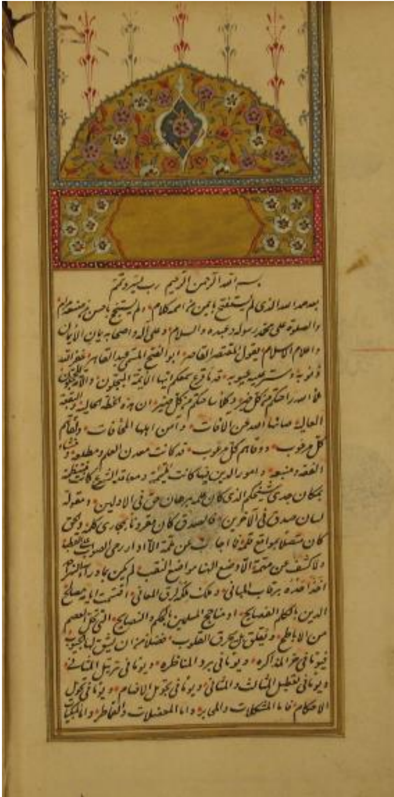
الورقة الأولى من النسخة (ع)