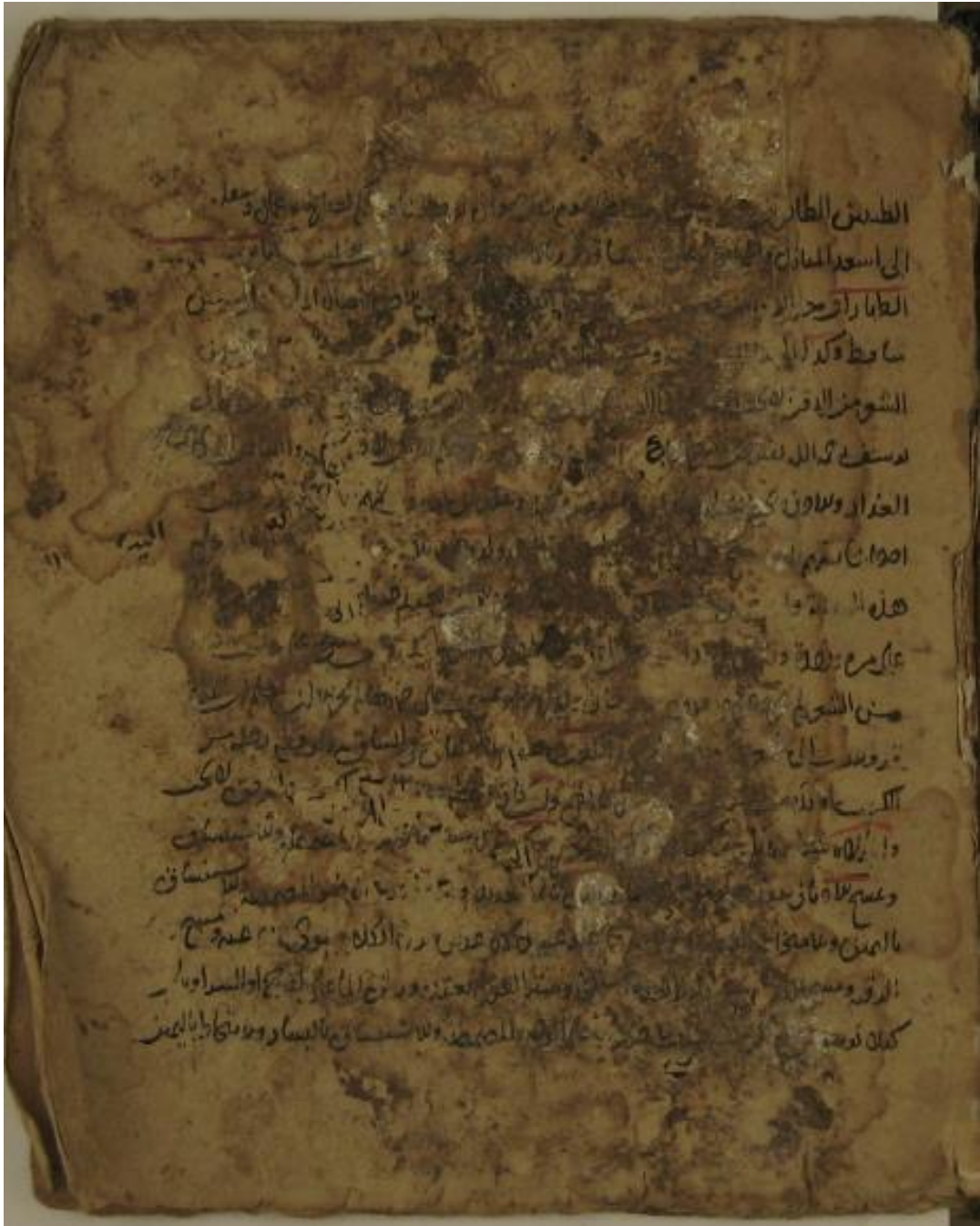
الصفحة الأولى النسخة (أ)