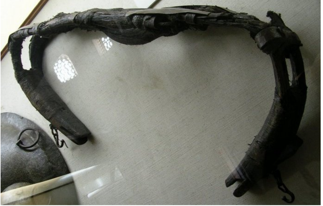
Ek-1: Gazi Deli Hüseyin Paşa'nın kurduğu Acem yayının Topkapı Sarayı'nda sergilenirken çekilen fotoğrafı. 323