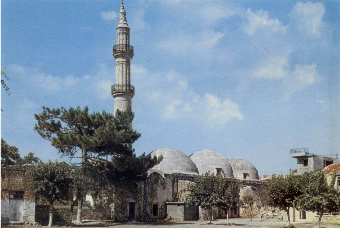
Ek-2: Gazi Deli Hüseyin Paşa'nın Resmo'daki 1657 yılında ibadete açılan aynı adla anılan camii. Narenciye Camii olarak da bilinir. Mevcut minaresi 1890 yılında yapılmıştır. 324