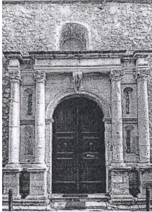
Ek-5: Deli Hüseyin Paşa'nın Resmo'daki camiinin giriş kapsı. 326