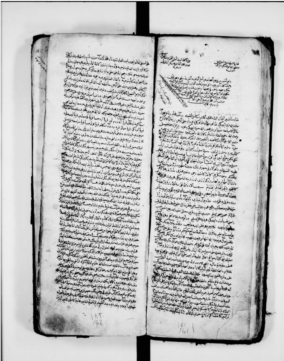
Deli Hüseyin Paşa'nın Girit'te Bulunan Vakfiyesi