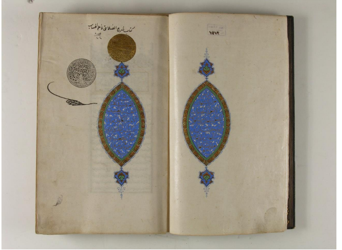
Şekil 3. Eserin giriş kısmında padişah tuğraları yer almaktadır.

bakarak şerhin birkaç farklı padişahın kütüphanesinde bulunmuş olduğu görülmektedir.