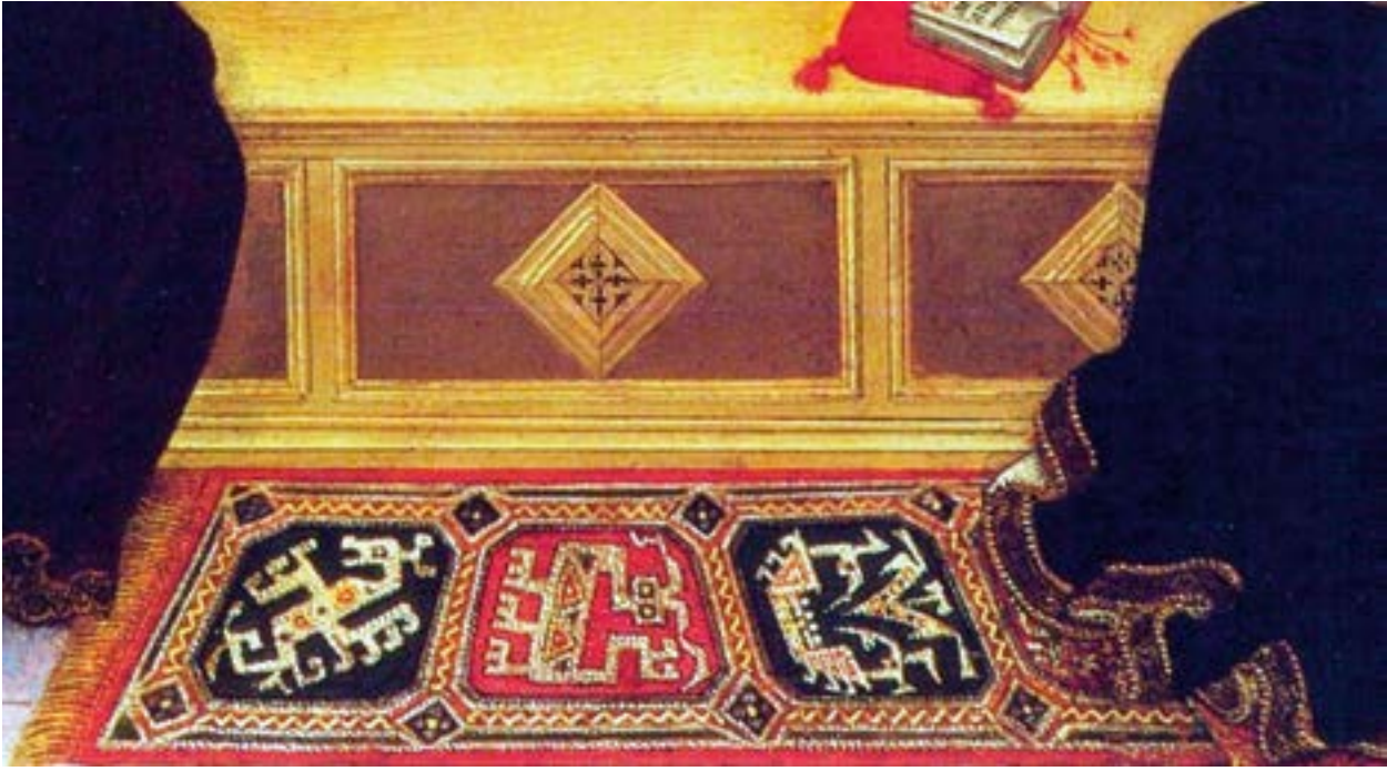
Fotoğraf 18. Gentile da Fabriano resim tablosunda Figürlü Selçuklu halı tasviri. 1390 yılı. (www.azerbaijanrugs.com)