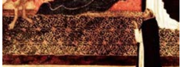
Fotoğraf 7. Ugolino di Nerio'nun resim tablosu. 1330 yılı. Yere serili Geometrik kompozisyonlu Selçuklu halı tasviri.(www.flickr.com)