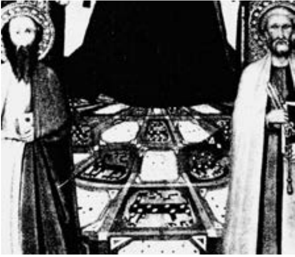
Fotoğraf 12. Ambrogio Lorenzetti ressamının tablosu. 1330 yılı. Yerde serili figürlü Selçuklu halı tasviri.