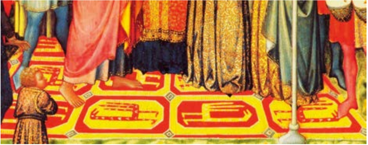
Fotoğraf 14. Nicolo di Buonaccorso tablosunda Figürlü Selçuklu halı tasviri. 1360 yılı. (www.flickr.com)