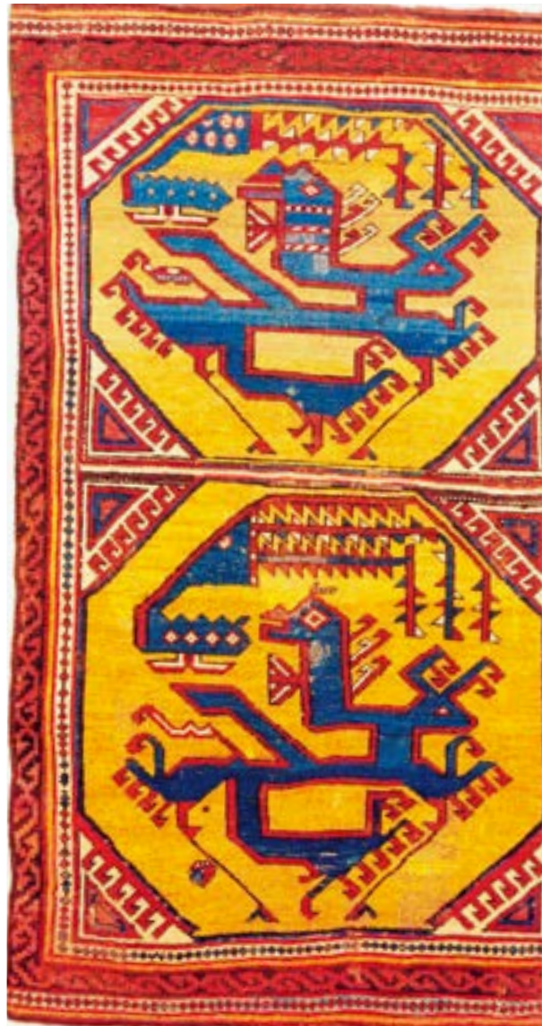
Fotoğraf 20. Figürlü Anadolu halısı. 14.yüzyıl. (Berlin Devlet Müzesi)