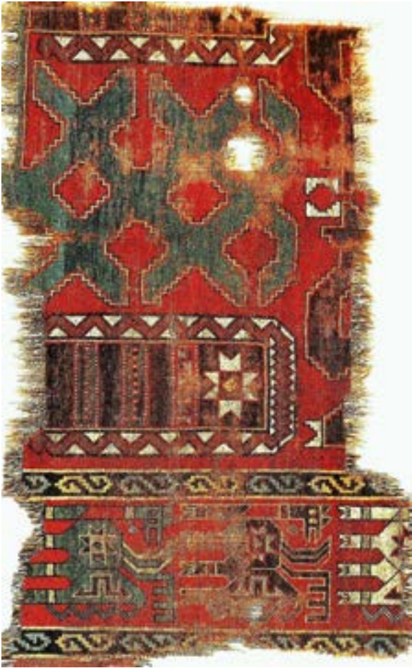
Fotoğraf 13. Tibet Grubu Anadolu Selçuklu halısı. 12-14.yüzyıl. (Marie Hacksher Koleksiyonu)

ya dönük mitolojik kuş figürleri işlenmiştir. Bu iki tabloda tasvir edilen halılara benzer bir orijinal halı da Tibet grubu halıları arasında yer almaktadır. Tibet bölgesinde bir manastırda ele geçen ve Marie Hacksher koleksiyonunda yer alan halı, 12-14.yüzyıla tarihlendirilmektedir. Bu Anadolu Selçuklu halısının geniş bordüründe üst üste sıralanmış başı arkaya dönük efsanevi figürler işlenmiştir.(Fotoğraf-13)