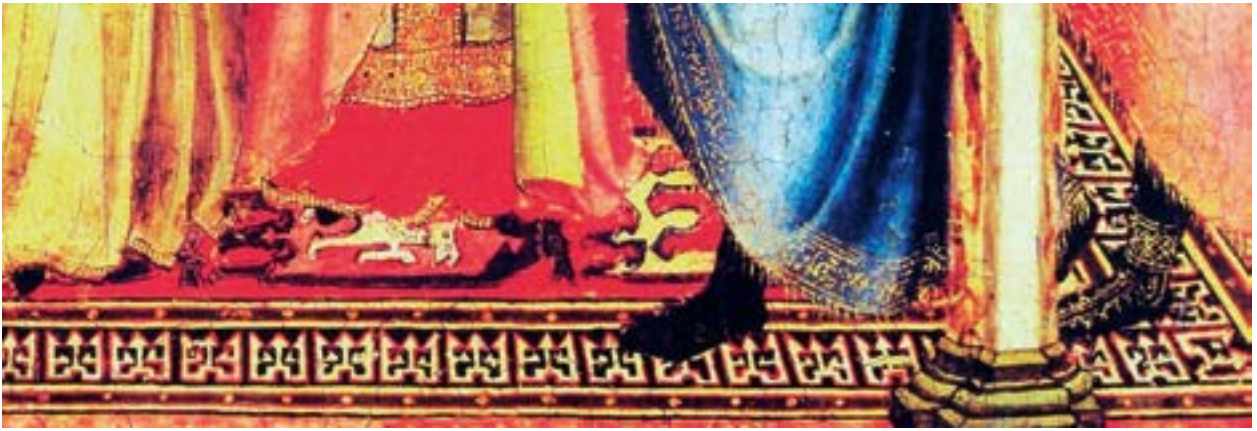
Fotoğraf 16. Sano di Pietro resim tablosunda Figürlü ve kufi bordürlü Selçuklu halı tasviri. 1370 yılı. (www.flickr.com)

tedir. Kırmızı zeminli halıda figürler, belki de ressamın acemiliği veya kurgusundan dolayı serbestçe zemine işlenmişlerdir. Bu tasvire benzer orijinal bir örnek halı, Tibet grubunda yer almaktadır.(Fotoğraf-17) 12-14.yüzyıllar arasına tarihlendirilen bu Anadolu Selçuklu halısının renkleri, inceliği ve dokuma tekniği bakımından tam bir sanat şaheseri olduğu söylenebilir. Halıda zemin, dar bordürle iki uzun dikdörtgene ayrılmış, bu iki bölümün her birinde dört ayaklı büyük ikişer mitolojik hayvan birbirine bakar şekilde yer almıştır. Büyük figürlerin içlerine küçük hayvan figürleri yerleştirilmiştir. Küçük figürler, büyük figürlerden farklı olarak üç ayaklıdır. Bordürler, Selçuklu kufi bordür geleneğindedir. Yünün cinsi, tekniği ve renk bakımından diğer Anadolu Selçuklu halılarıyla aynı özellikleri gösterir. (Aslanapa 2005:101-103)