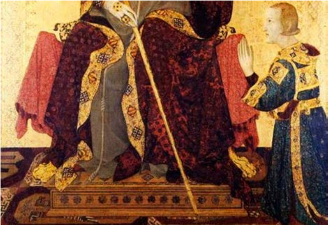
Fotoğraf 11. Simone Martini resim tablosu. 1317 yılı. Taht altında yerde serili Selçuklu figürlü halı tasviri.(www.azerbaijanrugs.com)

yüzyıl başından itibaren başlayan halı tasvirleri sayesinde orijinal halıların tarihlendirilmesi ve kronolojik gelişim sürecinin belirlenmesi kolaylaşmıştır. Bu iki yüzyıllık süre içinde figürlü halılar, gerek orijinal örneklerde, gerekse resim tablolarında tasvir edilenlerle beraber zengin bir halı grubunun varlığını ortaya koyacak niteliktedir. Ressamların tasvir ettikleri halılar, orijinalerin benzerleri olmakla beraber, çoğu zaman resmedilmeleri kolay olan kompozisyonlar tercih edilmiştir. Bazı ressamlar da gerçek model olarak seçilen halıya hayal gücünü de katarak düşledikleri figürleri tercih etmişlerdir.( Aslanapa 2005:65; Yetkin 1991:19-33 )