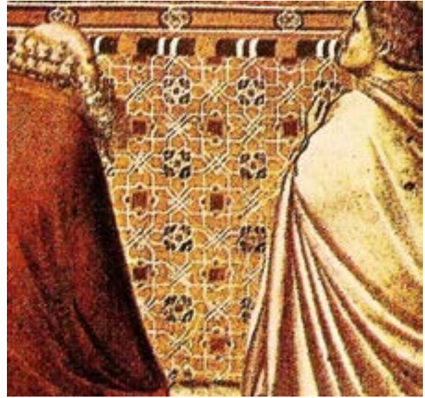
Fotoğraf 3. Giotto di Bondone tablosu. 1304 yılı. Altar'da kullanılan geometrik üsluptaki Selçuklu halı tasviri.(Oktay Aslanapa'dan)

sıkça tasvir edilmeleriyle ve gerekse çeşitli ülkelerde bulunan orijinal örnekleriyle, kayıtların doğruluğu da kanıtlanmaktadır.(Aslanapa 2005:58-59,60,96; Deniz 2000:24,27; Görgünay 2001:132-133; İnalçık 2008:30,37-38,44; Kardeşlik 2010:114; Kardeşlik 2012:58; Nasır-ı Hüsrev 1994:167; Yetkin 1991:33,59,60)