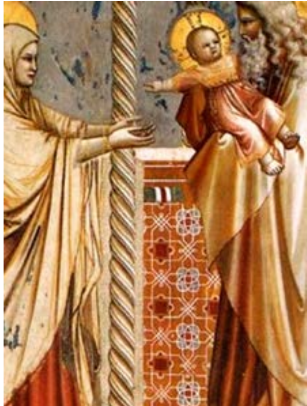
Fotoğraf 1. Giotto di Bondone'nin tablosu. 1290-1300. Altar'da arka fon olarak kullanılan halı, geometrik üsluptaki Selçuklu halılarındanadır.

Anadolu'da dokunan halıların Avrupa'nın ilgisini çekmesi ve rağbet görmesi, 12.yüzyılın son çeyreğiyle başlamaktadır. Ancak Anadolu Selçuklu halılarının sürekli ve düzenli olarak ihraç ürünleri arasında yer alması, 1206 tarihinde Anadolu Selçukluları ile Venedikliler arasında yapılan ticaret antlaşmasıyla sağlanmıştır. Bu tarihten sonra İtalyan tacirler tarafından Selçukluların Konya, Sivas, Kayseri, Aksaray kentlerinde dokunan kaliteli ve güzel halıların Antalya ve Alanya limanları üzerinden Avrupa'ya çok yoğun sevkıyatı yapılır. Batılı saray ve kiliselerinin eşya envanterlerinde, arşiv kayıtları ile İtalyan tablo ve fresklerinde