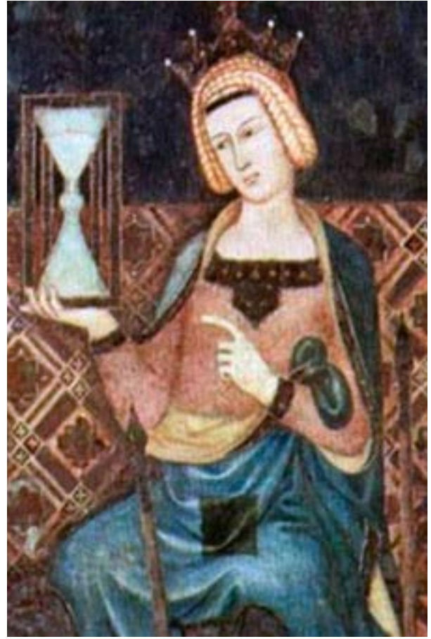
Fotoğraf 6. Ambrogio Lorenzetti ressamının tablosu. 1338 yılı. Taht üstünde serili Geometrik kompozisyonlu Selçuklu halı tasviri.

Resim tablolarında geometrik üsluplu halıların tasvir edildiği örneklerden bir kısmı Giotto di Bondone tarafından resmedilmiştir.(Fotoğraf-1,3,4) Bu resimlerde tasvir edilen halıların genel itibarıyla geometrik kompozisyonları, Selçukluların karakteristik mimari, çini, ahşap, tekstil vb. diğer sanat alanlarındaki kompozisyon, motif ve renk tonları ile aynı karakterdedir. Fotoğraf-3'te Giotto di Bondone'nin 1304 tarihinde Padua Arena Şapelinde yaptığı bir freskte, altar dekorasyonu olarak Selçuklu halılarının tam benzeri bir halı resmedilmiştir. Model olarak seçilen bu halının orijinali, büyük ihtimalle 13.yüzyılda Venedikliler aracılığıyla Anadolu'dan ithal edilen halılardandı. Benzer kompozisyonlu halılar, bir başka ressam Ambrogio Lorenzetti tarafından tasvir edilmiştir.(Fotoğraf-5,6) Anadolu Selçuklu halılarının tasvir edildiği güzel örneklerden biri de Ugolino di Nerio tablosudur. (Fotoğraf-7) Bu örnekte yere serili vaziyetteki halıda tamamiyle Selçuklu klasiği diyebileceğimiz ahşap sanatı gibi içleri altıgenlerle dolgulanmış, bölümlenmiş ve birbiri üzerine kurulmuş kareli bir zemin tasarlanmıştır. Bu geometrik kompozisyona benzeyen ori-