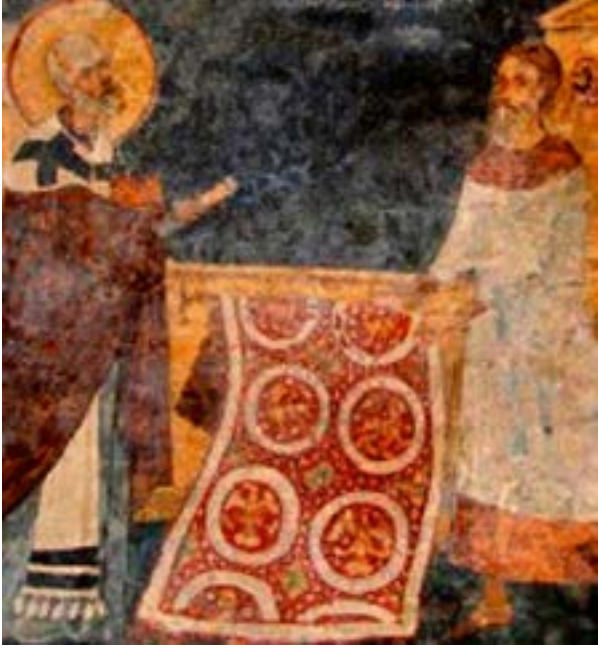
Fotoğraf 9. Bulgaristan'da St. Nicholas kilisesi freskinde Selçuklu figürlü halı tasviri. 1258 yılı. Tasvirdeki halıda daireler içerisinde Selçuklu çift başlı kartal ve aslan figürleri işlenmiştir. (www.azerbaijanrugs.com)

jinal bir halı da Vakıflar Halı Müzesi'nde yer almaktadır. (Fotoğraf-8) (halı hakkında detaylı bilgi için bkz. Kardeşlik 2010:118)