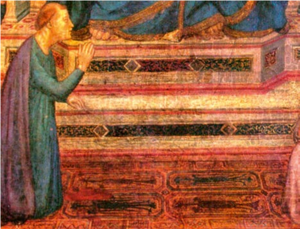
Fotoğraf 10. Giotto di Bondone'nin tablosu. 1298 yılı. Yerde serili olan halıda dikdörtgen panolar içerisinde Selçuklu kartal figürleri işlenmiştir.

Figürlü halılar, ilk olarak Avrupalı ressamın eserlerindeki halı tasvirlerinde tanınmıştır. Daha sonra bu tip halı orijinallerinin bulunması, halı tasvirlerinin değerlendirilmesini sağlamıştır. Avrupalı ressamın tablolarında 14.