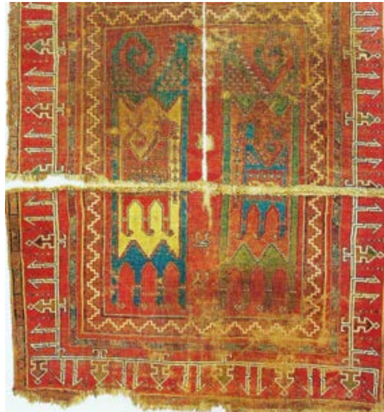
Fotoğraf 17. Tibet Grubu Anadolu Selçuklu halısından detay. 12-14.yüzyıl. (Heinrich Kircheim Koleksiyonu)

Gentile da Fabriano'nun 1390 tarihli ve Domenico di Bartolo'nun 1430 tarihli resim tablolarında yine mitolojik figürlerin yer aldığı halılar resmedilmiştir. Panolara bölünmüş alanlarda özellikle Anadolu Selçuklu sanatında sıkça karşımıza çıkan ejder figürleri tasvir edilmektedir.(Fotoğraf-18,19) Bu iki halıya benzer orijinal bir halı, iki panoya bölünerek içlerine ejder ve anka (simurg) kuşunun mücadelesini gösteren kompozisyonları işlenmiştir. 'Ming halısı' olarak isimlendirilmiş olan halı, köken bakımından