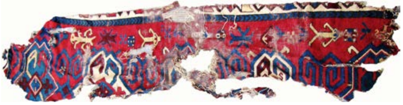
Fotoğraf 21. Artuklu veya Anadolu Selçuklu halısı. 12-14.yüzyıl arası. Gaziantep Vakıf Eserleri Müzesi.

ki bordürü ve zemindeki stilize edilmiş çift başlı Artuklu-Selçuklu kartal figürleriyle dikkati çeker. Figürlerin baş kısmı, Fotoğraf-11'de Simone Martini'nin tablosundaki figürlerin baş kısmıyla aynı özelliktedir. Henüz üzerinde araştırmaların pek yapılmadığı ve eldeki verilerin yetersizliğinden kesin bir tarihlendirme yapamadığımız halıyı, 12 ve 15.yüzyıllar arasındaki geniş bir zaman dilimi arasında değerlendirmek gerekir. Bu halının Diyarbakır yöresinde veya yakın çevresinde dokunduğu tahmin edilmektedir. Zira dönemin yazılı kaynaklarında bu bölgede dokumacılığın geliştiği anlaşıl-