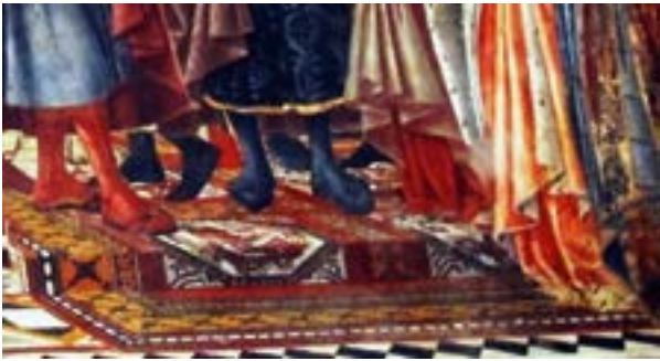
Fotoğraf 19. Domenico di Bartolo tablosunda Figürlü Anadolu halısı tasviri. 1430 yılı.

13.yüzyıl Anadolu Selçuklu halılarıyla bağlantılıdır. Büyük ihtimalle 13 veya 14.yüzyılda Anadolu'da dokunarak ihraç edilen halılardandır. (Fotoğraf-20)