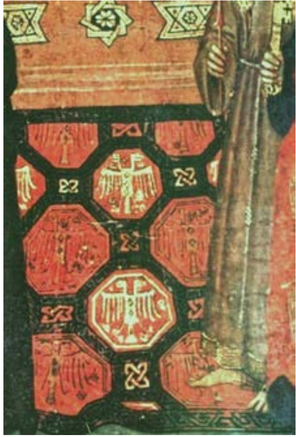
Fotoğraf 15. Lippo Memmi tablosunda Figürlü Selçuklu halı tasviri. 1340 yılı. (www.azerbaijanrugs.com)

ya dönük mitolojik kuş figürleri işlenmiştir. Bu iki tabloda tasvir edilen halılara benzer bir orijinal halı da Tibet grubu halıları arasında yer almaktadır. Tibet bölgesinde bir manastırda ele geçen ve Marie Hacksher koleksiyonunda yer alan halı, 12-14.yüzyıla tarihlendirilmektedir. Bu Anadolu Selçuklu halısının geniş bordüründe üst üste sıralanmış başı arkaya dönük efsanevi figürler işlenmiştir.(Fotoğraf-13)