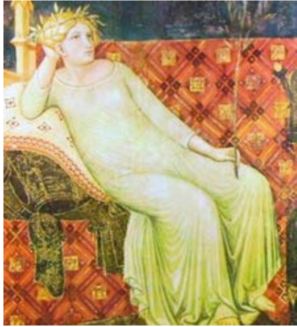
Fotoğraf 5. Ambrogio Lorenzetti ressamının tablosu. 1330 yılı. Taht üstünde serili Geometrik kompozisyonlu Selçuklu halı tasviri.

Antik kayıtlarda yazılanlar ile Avrupa resim tabloları ve minyatürlerde tasvir edilenler dışında günümüze kalmış orijinal örneklerden ilkin Konya Grubu (Konya Alaaddin camisinde bulunan 8 adet halı) ile keşfedilen Anadolu Selçuklu halıları, akabinde Beyşehir (Beyşehir Eşrefoğlu camisinde tespit edilen 4 adet halı), Fustat (Mısır'ın Fustat kentinde arkeolojik kazılarla ele geçen 7 parça) ve Divriği (Divriği Ulu camisinden Vakıflar Halı müzesine getirilen 5 halı) grubu ile dünya bilim literatüründe yerini alır. Ayrıca Tibet Grubu (2 parça halı bir halının bütünü olmak üzere toplam 5 adet halı) olarak nitelenen figürlü halılar, Selçuklu halı sanatına yeni bir bakış açısı ve zenginlik kazandırmıştır. (Aslanapa 2005:25-64,96-106; Aslanapa-Durul 1973:57-58; Deniz 2000:24-25; Deniz 2008:380; Kuban 2008:369 Kardeşlik 2010:114; Kardeşlik 2012:53; Sözen 1998:168; Yetkin 1991:8-17)