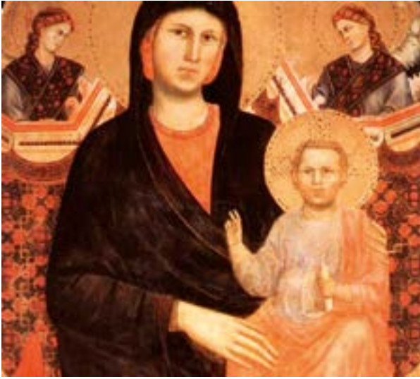
Fotoğraf 4. Giotto di Bondone tablosu. 1290-1300. Arka fon olarak kullanılan geometrik üslupdaki Selçuklu halısı.