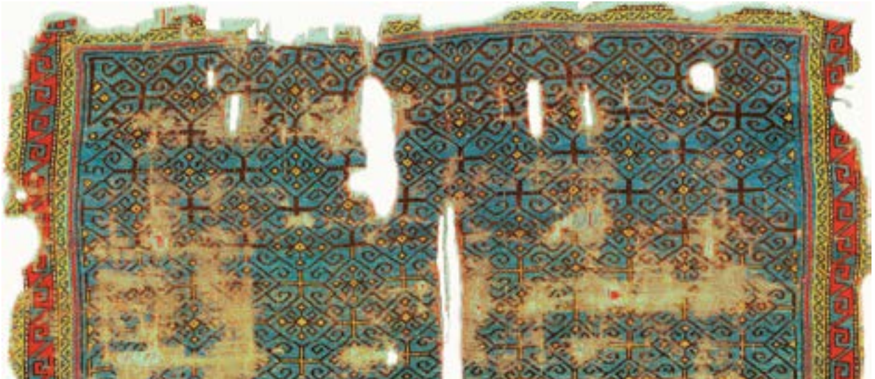
Fotoğraf 8. Geometrik kompozisyonlu Anadolu Selçuklu halısı.13-14.yy.(Vakıflar Halı Müzesi)