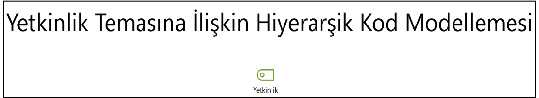
Şekil 3 Yetkinlik Temasına İlişkin Hiyerarşik Kod Modellemesi

Araştırmanın Yetkinlik temasına ilişkin bulgular kurum yöneticilerinin ve öğretmenlerinin dış alan kullanımı konusunda aldıkları eğitimler üzerine oluşturulmuştur. Bu temanın oluşmasında yöneticilerin ve öğretmenlerin görüşleri birlikte göz önüne alınmıştır. Bu temanın tümüne ilişkin görüşler 50 defa kodlanmıştır. Yetkinlik temasına ilişkin hiyerarşik kod modellemesi Şekil 3'de verilmiştir.