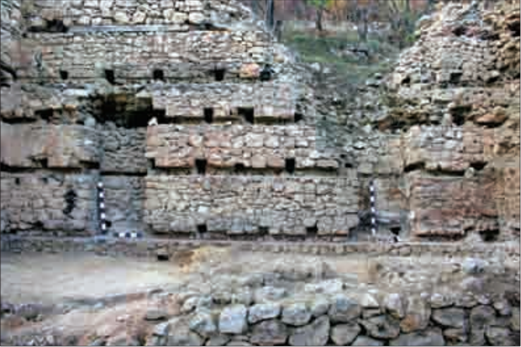
Resim 6: Cami kuzey duvarında yer alan nişler