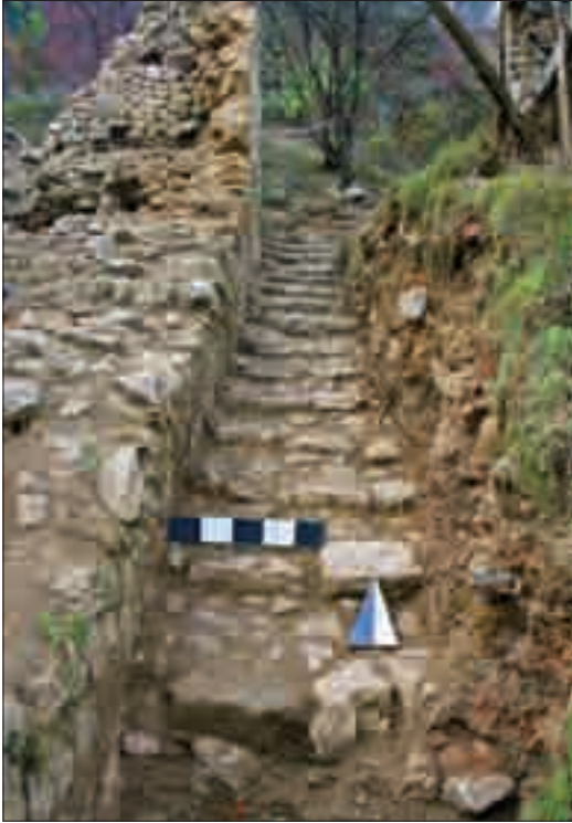
Resim 10: Caminin doğusunda yer alan merdiven basamakları