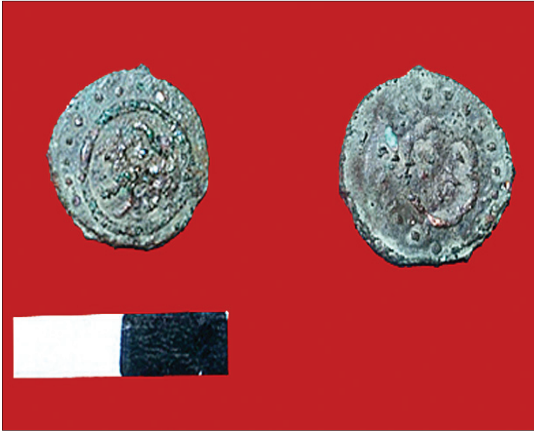
Resim 21: Osmanlı Anonim Sikkesi