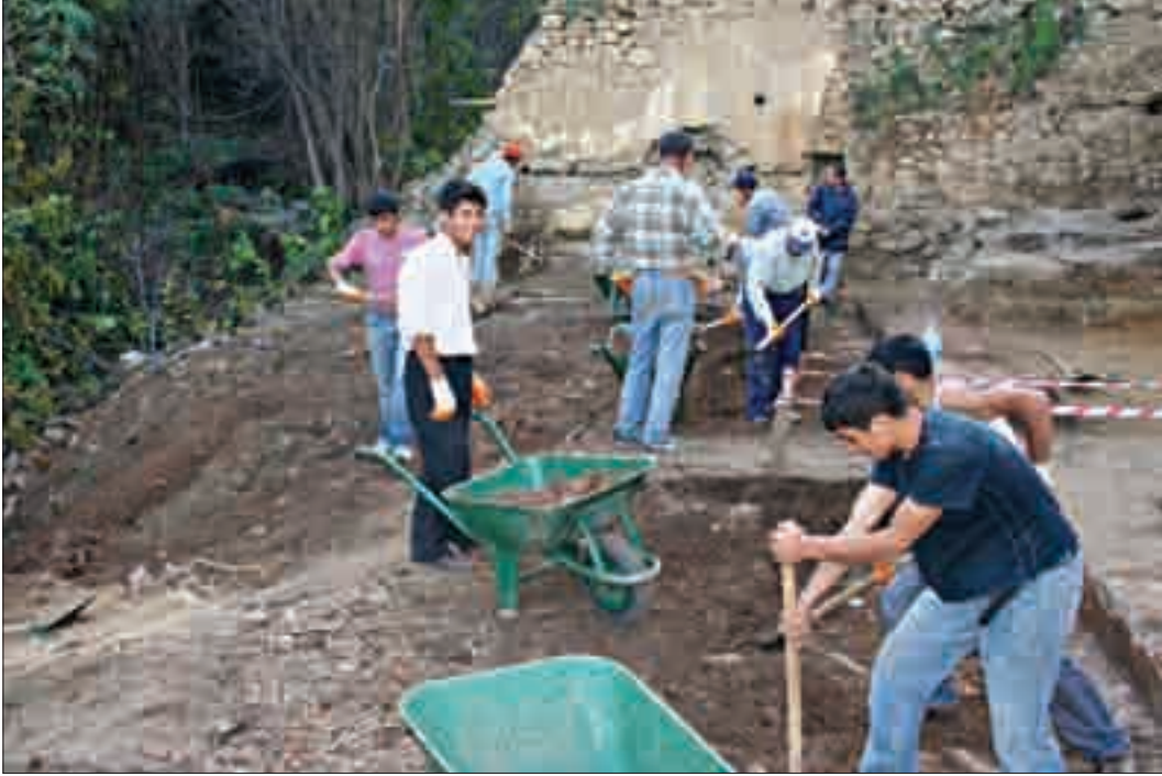
Resim 7: Avlu içinde temizlik ve kazı çalışması