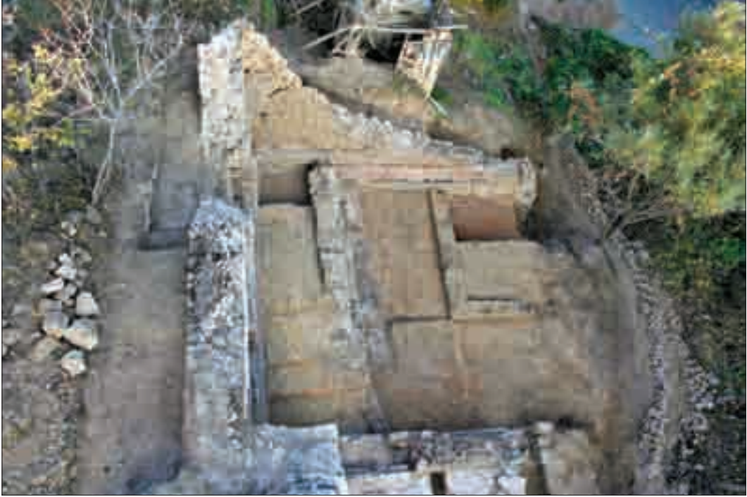
Resim 12: Caminin kazı sonrası üstten görünümü.