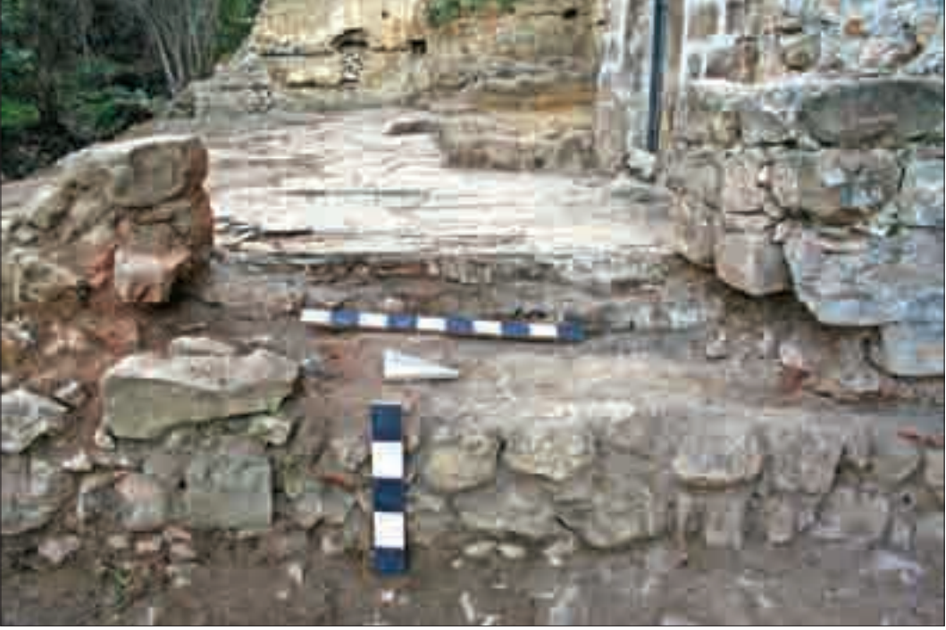
Resim 5: Cami giriş açıklığı