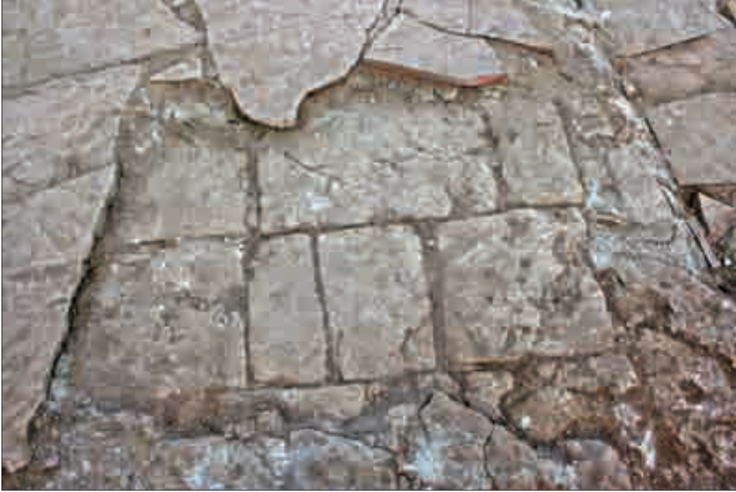
Resim 9: Avlu içerisinde yer alan döşeme taşları