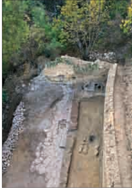
Resim 11: Avlunun kazı sonrası üstten görünümü merdiven basamakları