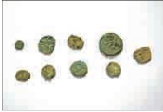
Resim 15: Osmanlı Dönemi korozyonlu sikkeler