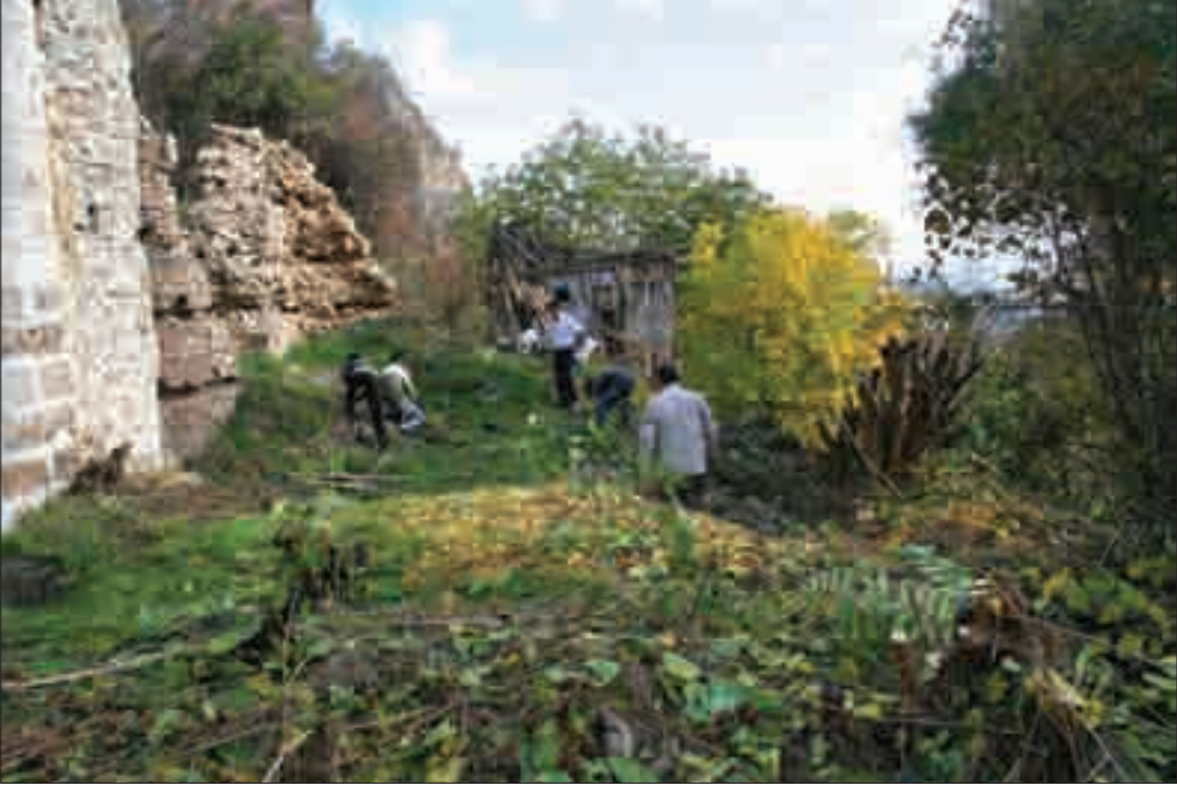
Resim 3: Cami ve avlu kısmında temizlik çalışması