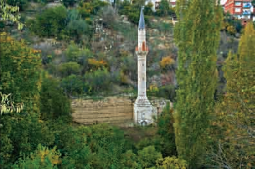
Resim 1: Osmangazi Camii'nin genel görüntüsü