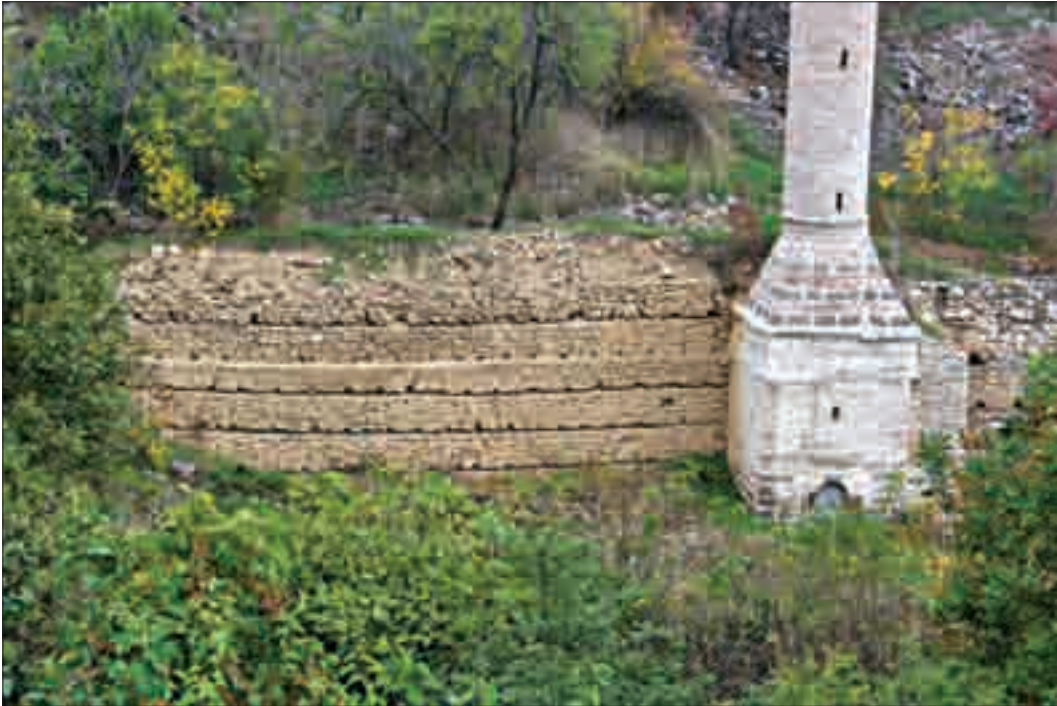
Resim 2: Avludan görüntü