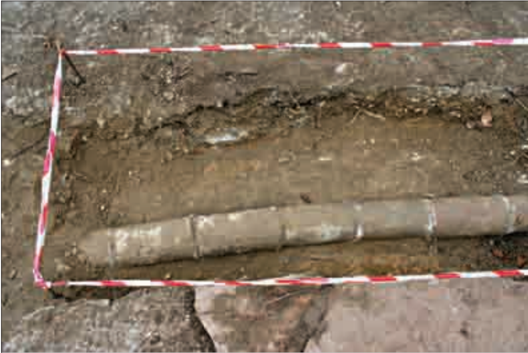
Resim 8: Avluda yer alan künk