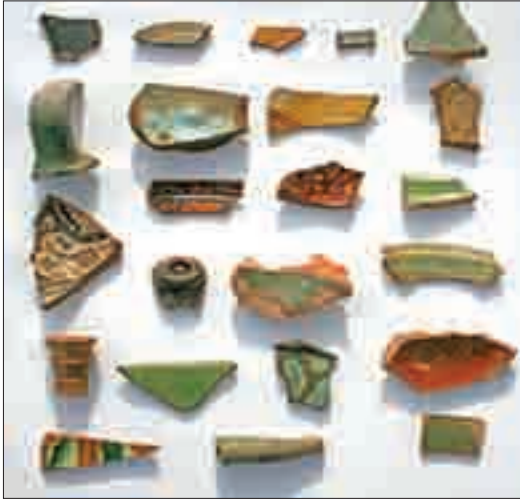
Resim 16: Seramik parçaları