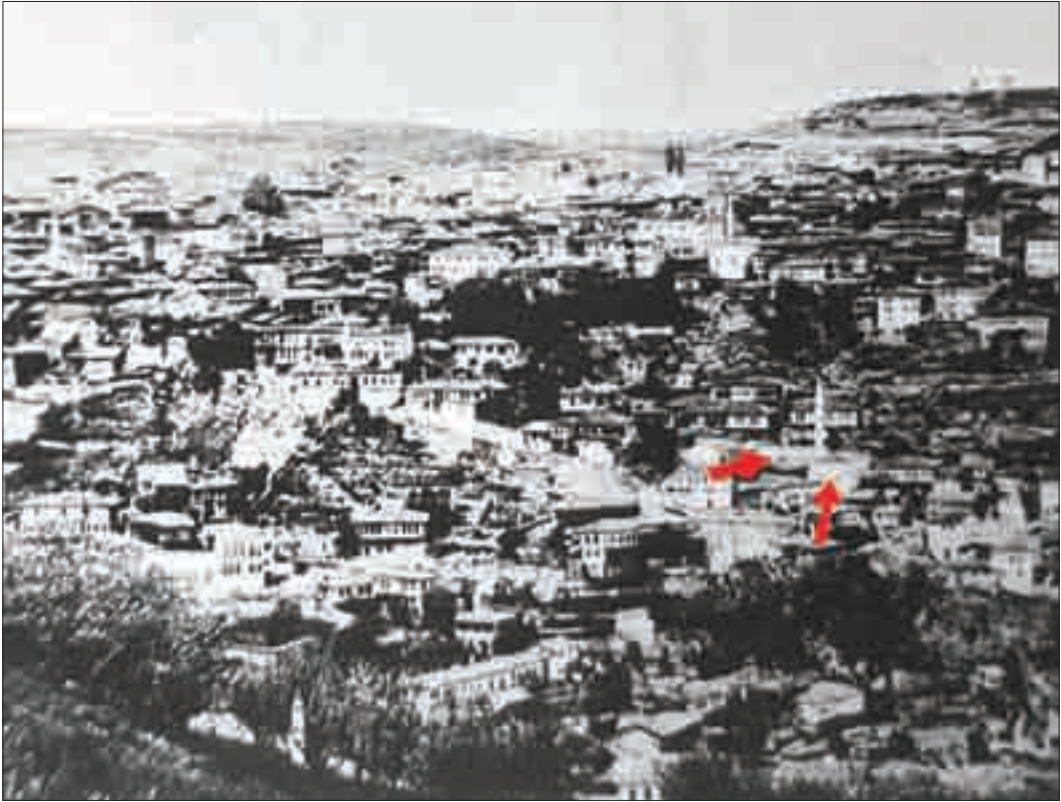
Resim 13: 19.yüzyıl Bilecik fotoğrafı ve Osmangazi Camii