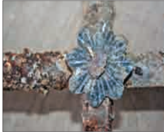
Resim 19: Pencere korkuluğundaki detay