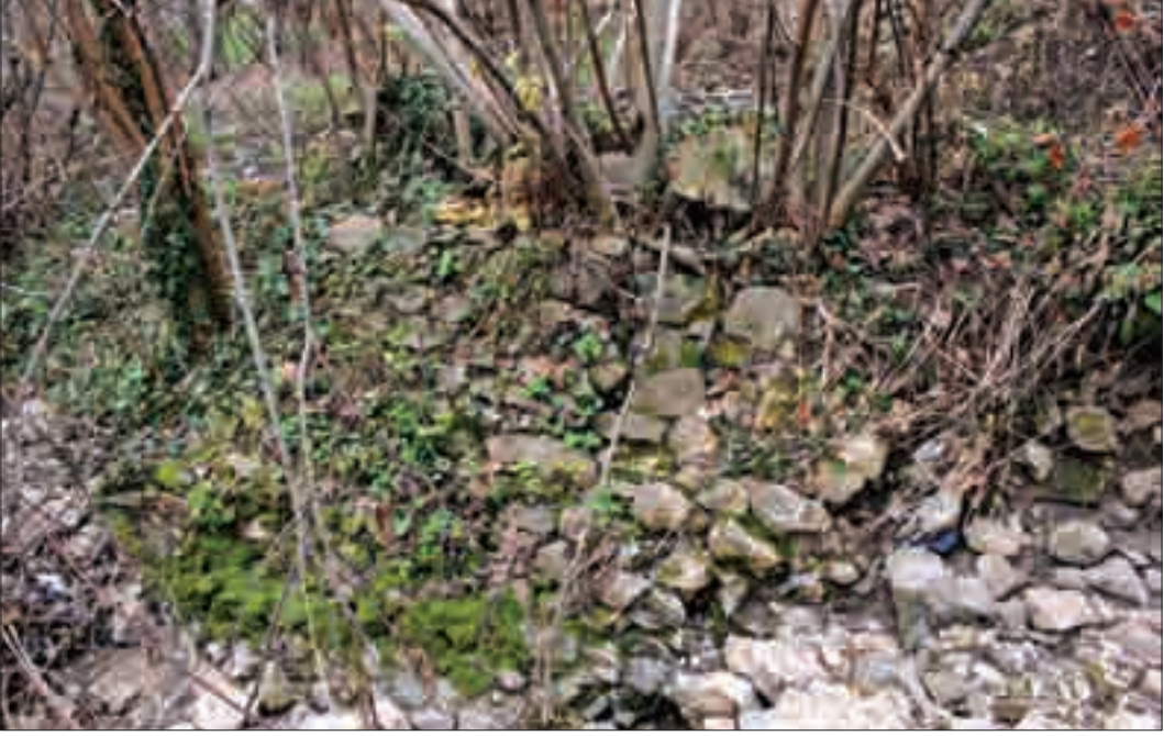
Resim 22: Sel sularından sonra ortaya çıkan yapının güney duvarı kalıntısı