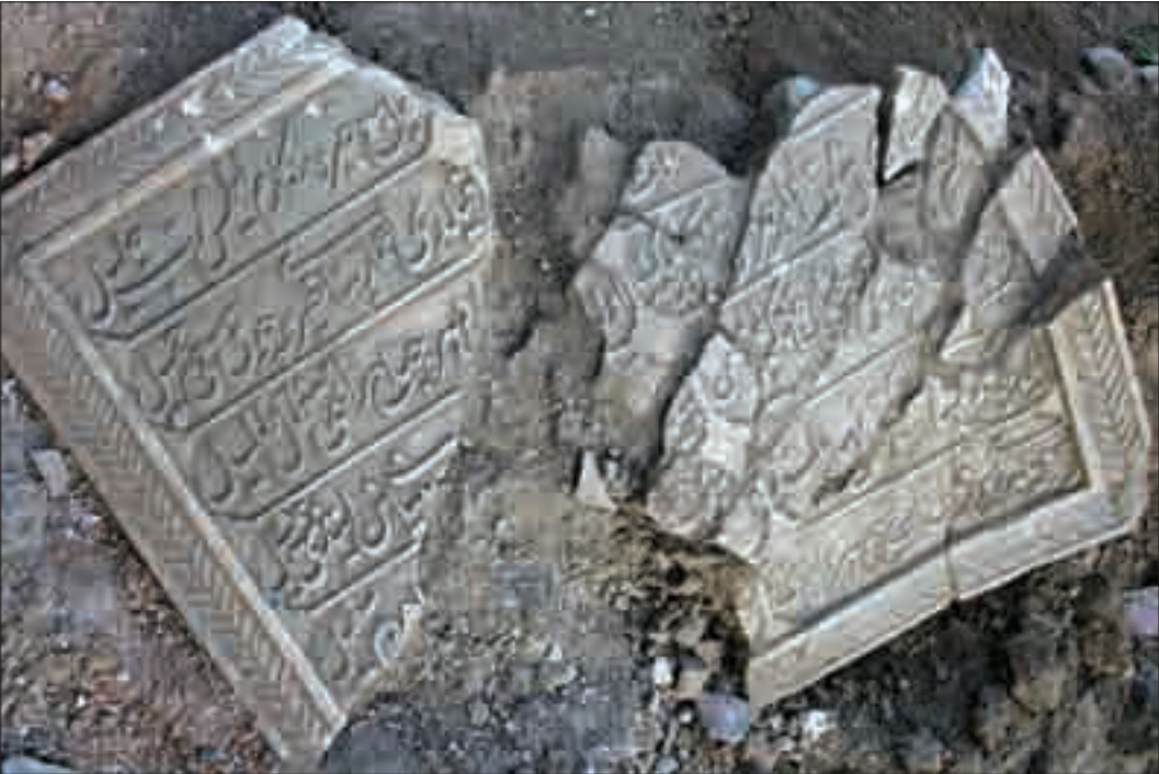
Resim 4: Kazı sırasında ortaya çıkartılan kitabe