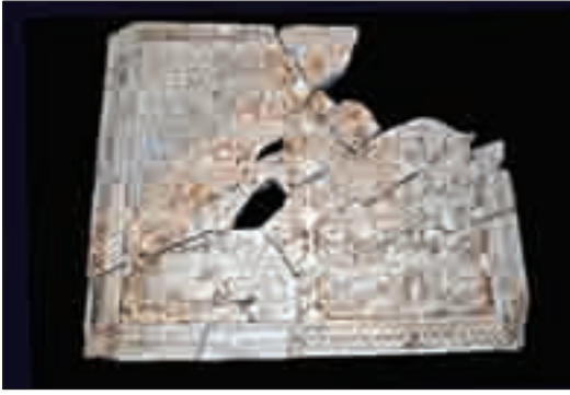
Resim 14: Kitabenin birleştirilmiş hali