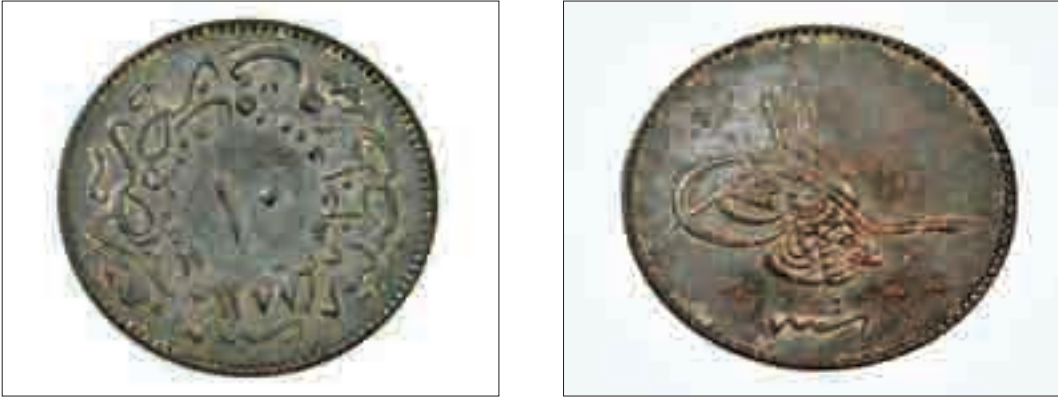
Resim 20: Abdulaziz Dönemi Sikkesi