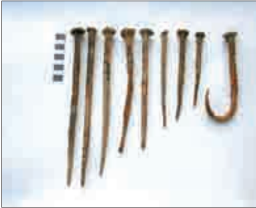
Resim 18: Kazı sonucunda bulunan çiviler