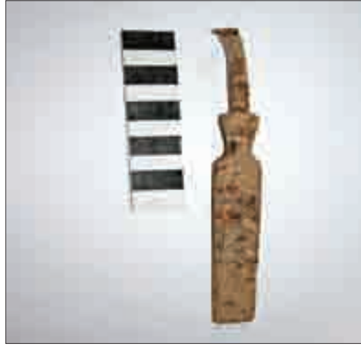
Resim 17: Ahşap oymacılığında kullanılan İskarpela