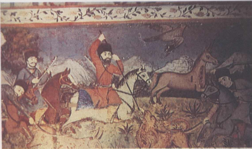
11. Bordür minyatürleri (Av sahneleri).