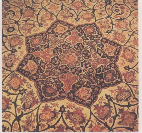
3. İç mekan-tavan süslemeleri.