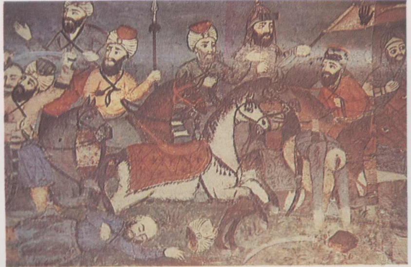
10. Bordür minyatürleri (Savaş sahnesi).