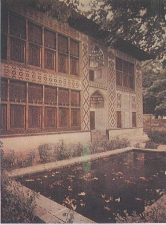
2. Şeki Han Sarayı.