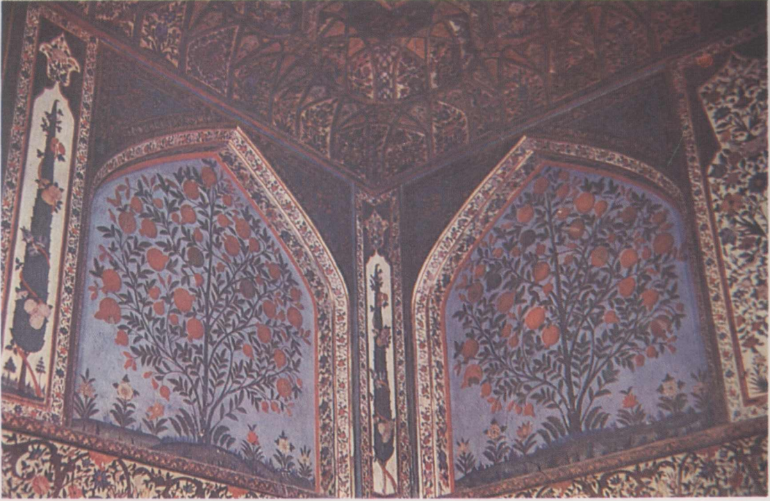
5. İç Mekan Duvar süslemeleri (kesit).