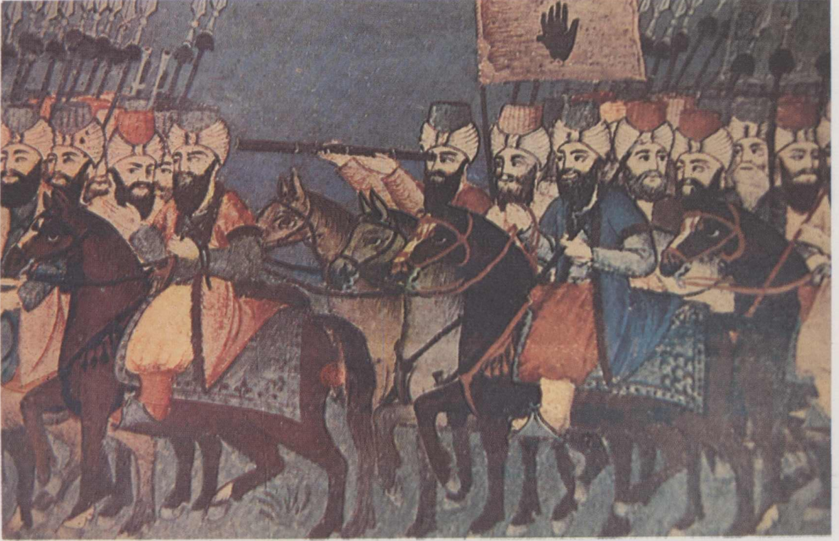
9. Bordür minyatürleri (Cepheden Dönüş).