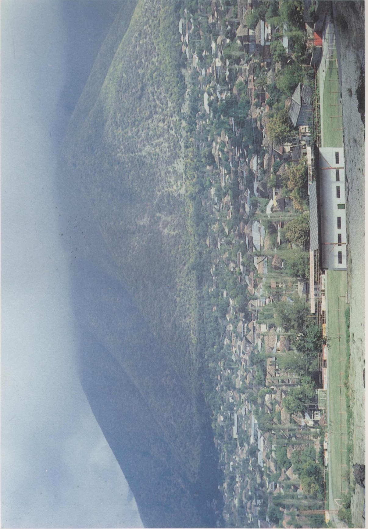
1. Şeki- Genel görünüm.