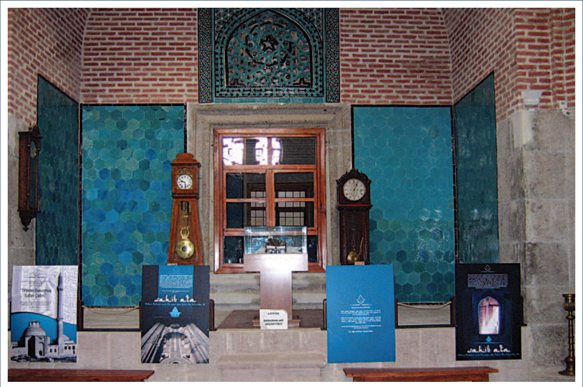
Sahip Ata Vakıf Müzesi İç Görünüm