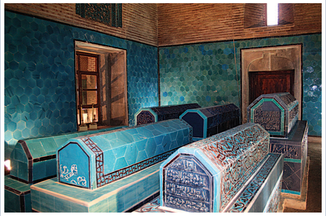
Sahip Ata Türbesi