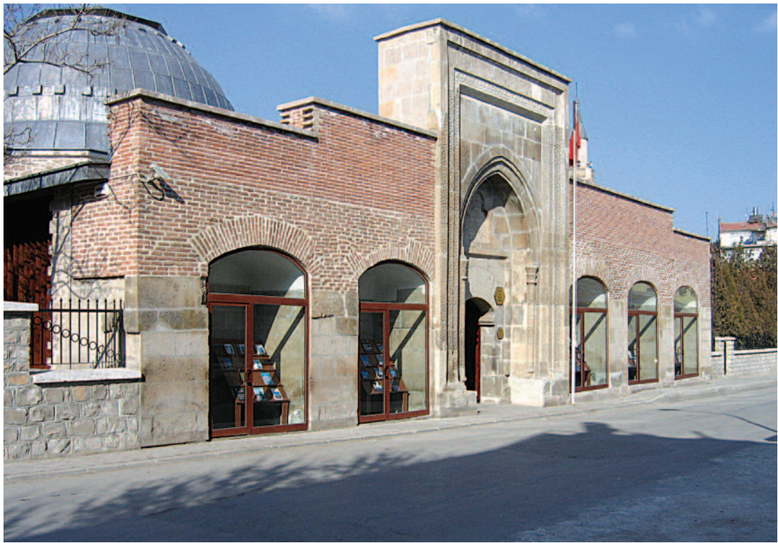
Sahip Ata Vakıf Müzesi Dış Görünümü

Anadolu Selçuklu dönemine has firuze, patlıcan moru, kobalt mavisi çinilerle kaplı, başlı başına bir anıt müze konumunda olan Sahip Ata Vakıf Müzesi'nde; Konya, Karaman ve Aksaray'da bulunan, Vakıflar Genel Müdürlüğü'ne bağlı cami ve mescitlerden getirilen tarihi eser niteliği kazanmış teberukat eşyalarından örnekler sergilenmektedir. İkiyüz kadar objenin sergilendiği eser grupları içerisinde Konya Alâeddin Camii'nden getirilen halı ve kilim örnekleri vardır. Bunlar Konya ve çevresine ait dokumalar olup XVII., XVIII., ve XIX. yüzyılların dönem özelliklerini yansıtmaktadırlar. Bu eserler Türk kültürünü ve yöresel özellikleri taşıyan desenlerle işlenmiş ve dokunmuştur. Bölgeye göre tasarlanmış şekillerin işlendiği eserlerde; eli belinde, koçboynuzu, kurtağzı, su yolu, tarak, testere dişi, el, ok başı, bukağı, sandık gibi motiflerinin yanı sıra akrep ve kuş figürlerine de yer verilmiştir. Aynı grup içerisinde bulunan Lâdik Seccadeleri görülmeye değer niteliktedir.