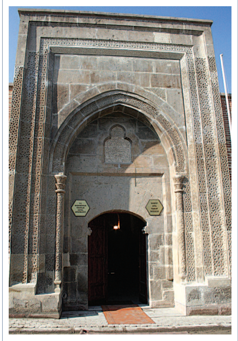
Sahip Ata Hanikahı

Osmanlı Devleti döneminde hac yolu üzerinde olması ve Mevleviliğin merkezi konumunda bulunmasıyla önemini koruyan Konya, kurtuluş Savaşında cephe gerisinde bir depo ve karargâh görevi üstlenmiştir (Önder 1962: 24).