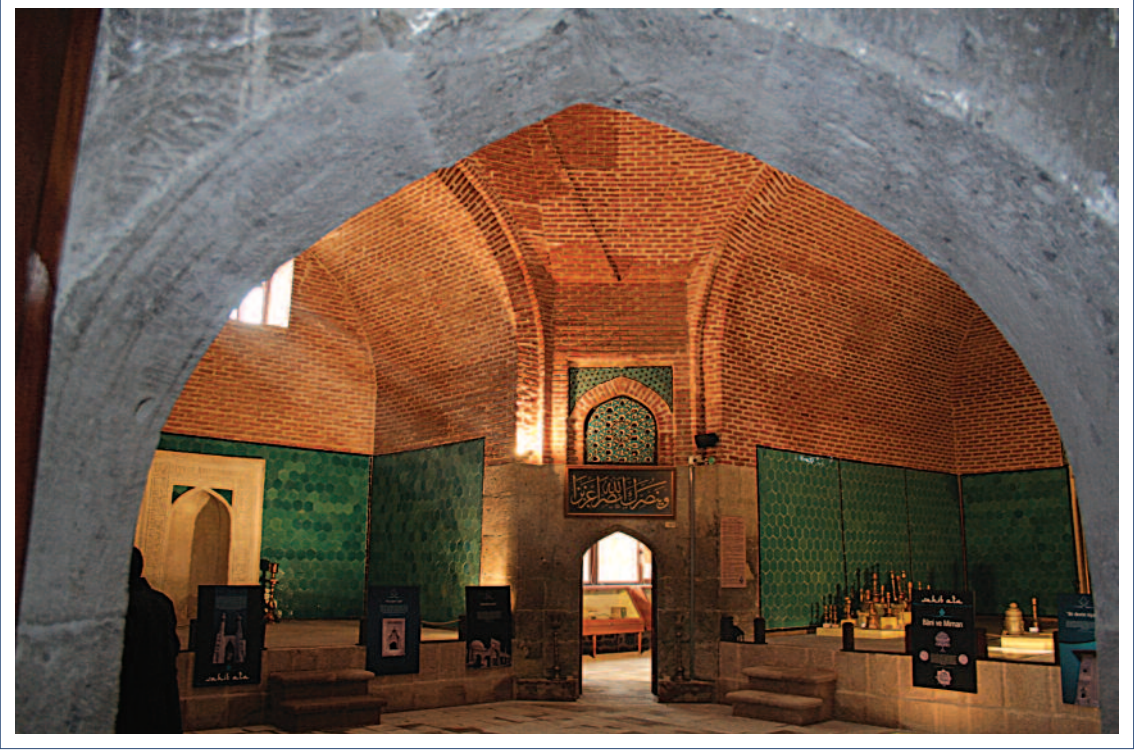
Sahip Ata Vakıf Müzesi İç Görünüm