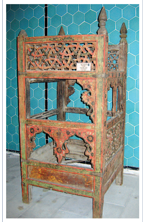
Sahip Ata Vakıf Müzesi Vaaz Kürsüsü

Müzedeki sergilenen bir diğer grup ise, arşiv vesikaları ve hat levha eserlerdir. Osmanlı son dönem hat örneklerinin yer aldığı hat eserler, ayet, hadis, Hz. Peygamber'in ve Hz. Mevlana'nın isimleri ile yazılmış örnekler yer almaktadır. Hat örneklerin kimi ahşap üzerine boyama ve kakma; bez üzerine astar veya iplikle işleme şeklinde tasarlanmıştır. Arşiv vesikaları içerisinde ise Sultan III. Selim ve Sultan Abdülaziz'in tuğralarının yer aldığı vakfiye, ferman ve beratlar yer almaktadır. Ayrıca Hz. Mevlana'nın anesi için yazılmış bir de methiye yer almaktadır. Bu eserlerin dışında müzede; oldukça ilgi çeken yer ve duvar saati örneklerinin yanı sıra Tekke Sancağı, Kapılık (Sera Perde) ve keçe seccade ve Sakalı Şerif, Kâbe örtüsü gibi kutsal emanetlerde bulunmaktadır.