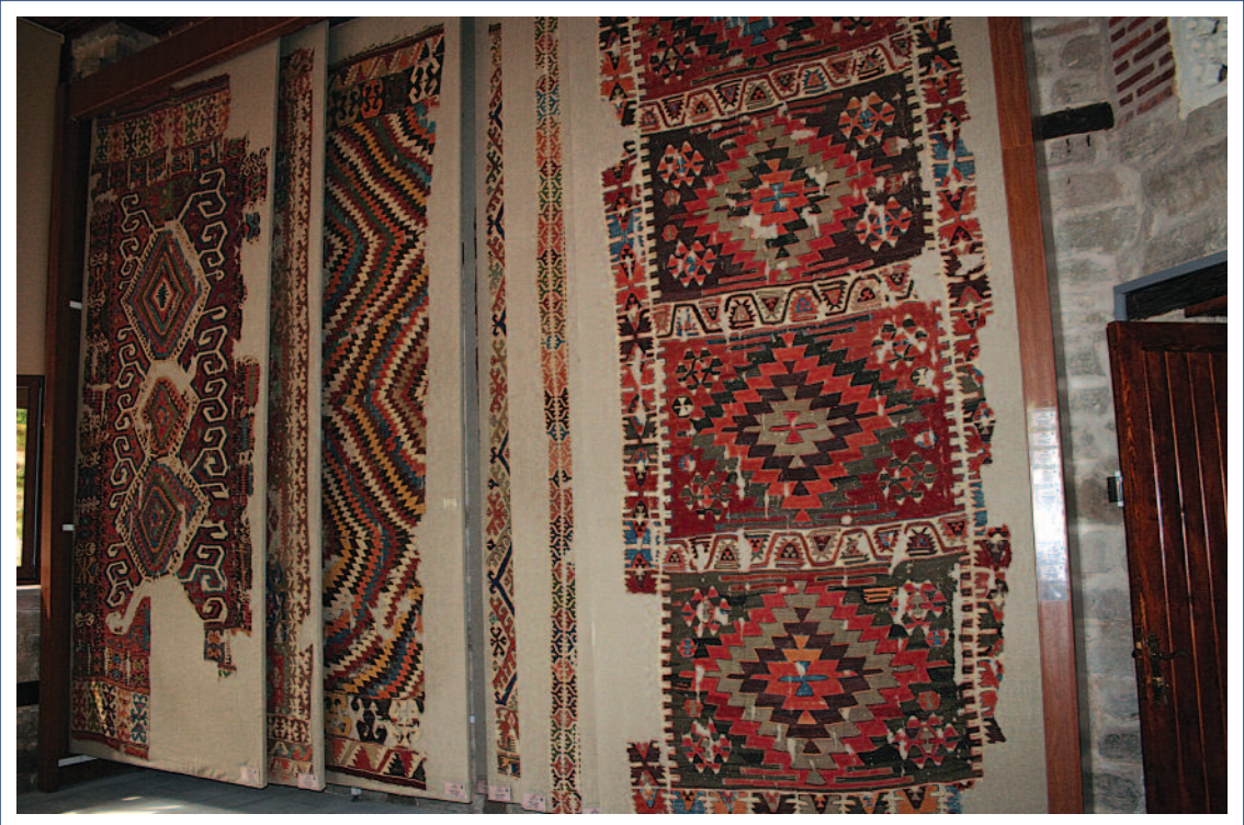
Sahip Ata Vakıf Müzesi İç Görünüm (Halı ve Kilimler)