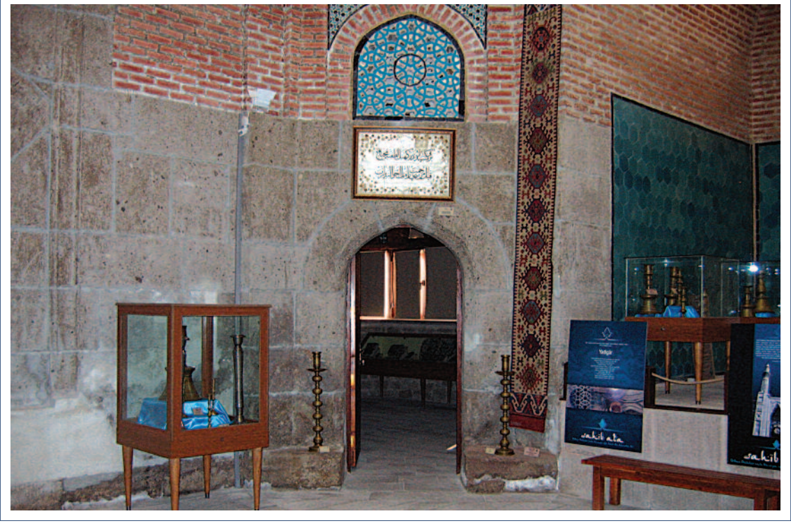
Sahip Ata Vakıf Müzesi İç Görünüm