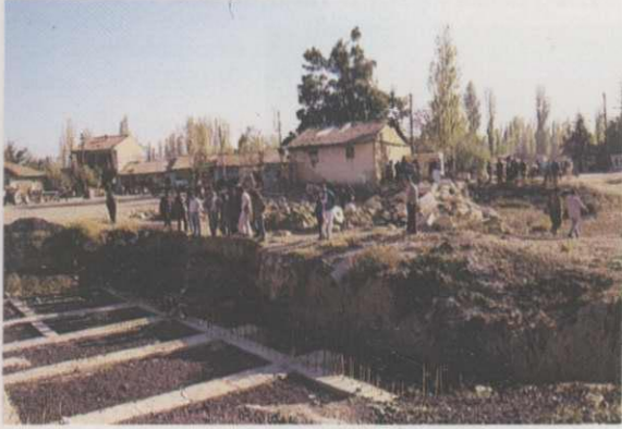
Res. 9: Argıt Hanın yerine yapılan binanın temeli (A.T. Yavuz, saydam arşivi, 1993)