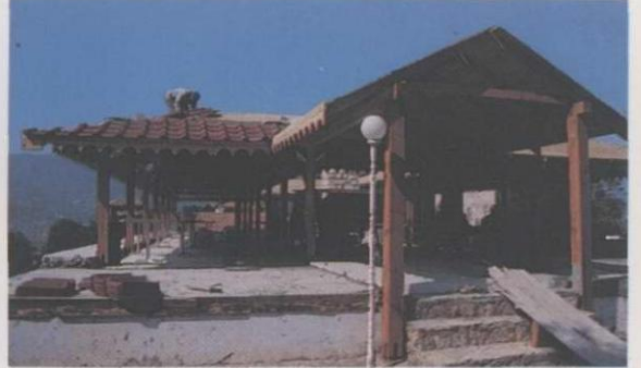
Res. 16: Alanya Kalesindeki Han, onarımında ahırın üstüne eklenen yapı (A.T. Yavuz, saydam arşivi, 1990)