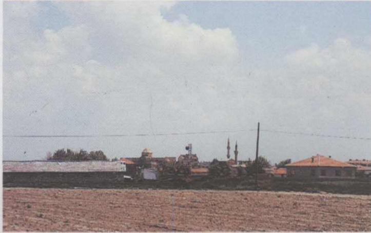
Res. 6: Aksaray Sultan Hanın yoldan görünüşü ( A.T. Yavuz, saydam arşivi, 1993 )