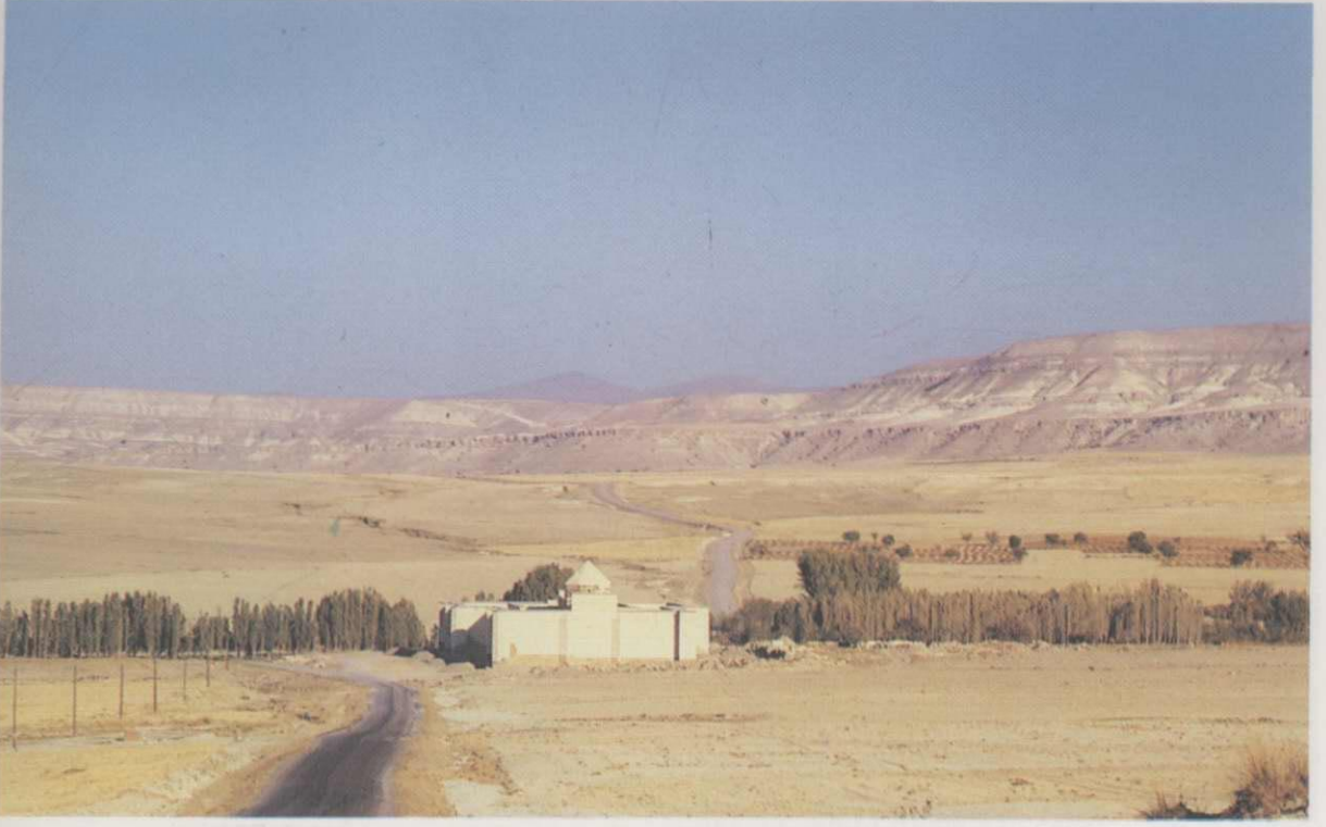
Res. 1: Avanos Saru Han ve çevresi