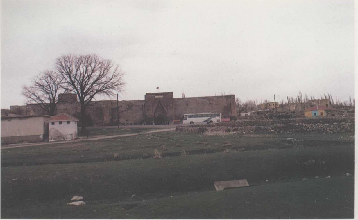
Res. 5: Ağzıkara Han ve etrafındaki köy ( A.T. Yavuz, saydam arşivi, 1993 )