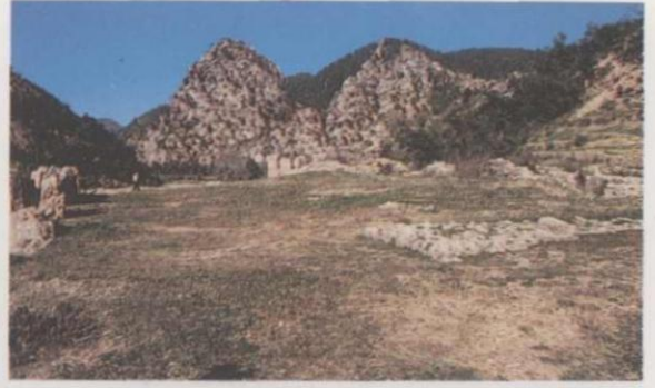
Res. 13: Alara Hanın çatısından Alara kalesinin görünüşü (A.T. Yavuz, saydam arşivi, 1991)