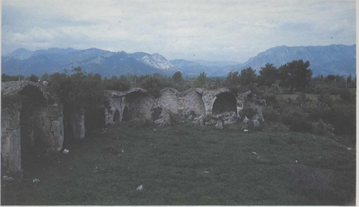
Res. 10. Emdir Han, avludaki yıkıntılar (A.T. Yavuz, saydam arşivi, 1989)