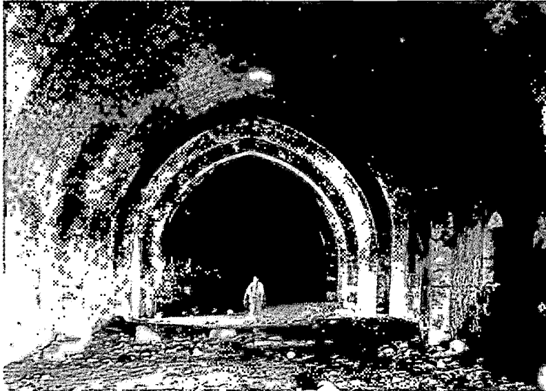
Res. 17: Şarapsa Han, Özgün sekinin izleri ( R.Riefstahl'dan )

Konunun uzmanlarıyla hiç ilişkiye girilmeden yapıldı bu; çünkü dönem belirlemesi yapılmadı. Yalnız değerlendirme, teknik elemanların gözüyle yapıldı, Sanat tarihçileri önemsenmedi. Sanat tarihi ve mimar işbirliğiyle bu restorasyonlar yapıldığı takdirde, son derece olumlu, ileriye dönük ve tenkidi az olan uygulamalar getirecektir.