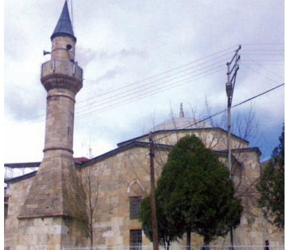
Resim 4. Batı cephe ve minare

Güney cephede mihrabın iki yanındaki birer pâyanda ile duvar güçlendirilmeye çalışılmıştır. Minare batıya doğru beden duvarlarından taşıntı yapmaktadır. Kare kaide üzerinde yukarı doğru daralan prizmatik üçgen pabuç bulunmaktadır. Minare gövdesi onikigen olup, altta ve üstte yuvarlatılmış profilli silmelerle oluşturulan bileziklere sahiptir. Şerefe altı düzgün küçük kesme taşların üst üste, dışarıya taşıntılı dizilmesiyle genişletilmiştir. Onun üstündeki şerefe korkuluğu ince taş plakaların yan yana yerleştirilmesiyle oluşturulmuştur. Minare gövdesi külaha kadar biraz daha incelererek