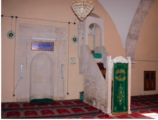
Resim 10. Güney duvar, mihrap ve minber

Kuzeyde yer alan kapı yarım daire kemerli açıklık şeklindedir. Kapının iki yanındaki söveler üstte Bek-