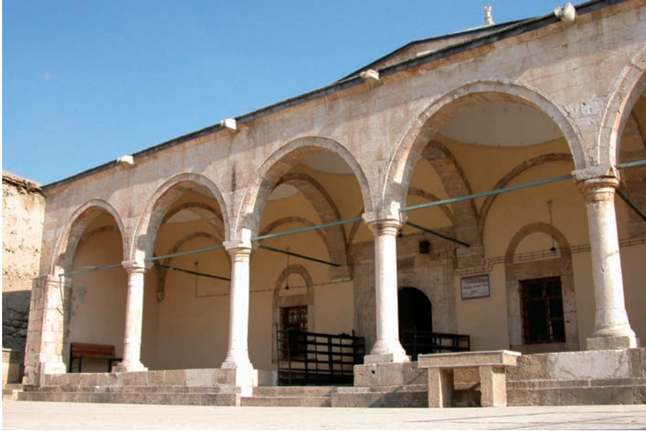
Resim 6. Son cemaat yeri

yükselmekte aşağısında ve yukarısında birer bilezik bulunmaktadır. Son cemaat yerinin doğu ve batısı ince, sağır duvarlıdır. Son cemaat yeri iki basamaklı merdivenle çıkılan yükselti üzerindedir (Resim 10). Kapı açıklığı seviyesindeki bu zeminden doğu ve batı yanlara birer basamakla çıkılan seki düzenlemesiyle yükselti daha da belirginleşmiştir. Cepheleler ön yüzü düz, alt yüzü pahlı bir silme ile sonuçlanmaktadır. Son cemaat yeri duvarının üst seviyelerinde dört çörtten dikkat çekmektedir.