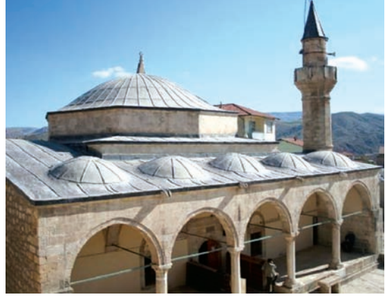
Resim 7.1 Kuzeydoğudan genel görüntü

Minare tamamen düzgün kesme taşla inşa edilmiştir. Cami kemer, pencere lento ve sövelerinde de düzgün kesme taş kullanılmıştır. Kubbelerle, tonozların kurşun levhalarla kaplandığı görülmektedir (Resim 7.1).