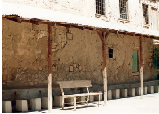
Resim 8. Restorasyon öncesi avlu kuzey duvarı

Kubbe, kuzey ve güney cephelerde duvar, doğu ve batı cephelerde ise sağır, enli kemerler üzerine oturan, oldukça kısa kasnak şeklinde düzenlenmiş, etek bölümünden gelişerek yükselmiştir. Kubbe geçişleri pandantiflerle sağlanmıştır. Örtü sistemi ile duvarlar sıvalı ve badanalıdır. Güney duvarda doğu ve batı köşelere yakın, boyuna dikdörtgen biçimli birer dolap nişi bulunmaktadır. Halen enli taltaların yan yana sıralanmasıyla oluşturulmuş basit birer kapakla kapalıdır.