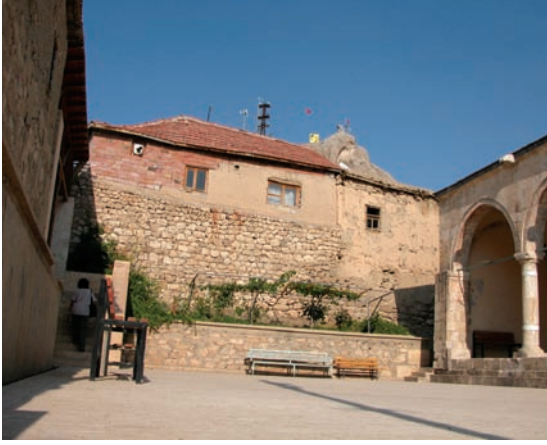
Resim 7. Cami avlusu

Yapının kuzeyindeki avlu ise yine doğu-batı doğrultuda dikdörtgen biçimdedir (Resim 7). Avlunun kuzeyinde abdest alma yeri bulunmaktadır. Daha önceleri avlunun kuzey istinat duvarı boyunca musluklar yan yana diziliyken onarımlar sırasında bu çeşmeler kaldırılmıştır (7) (Resim 8). Aynı duvarın üst kısmına merdivenlerle çıkılan yükselti şeklinde, kapalı abdest alma yeri yapılmıştır.