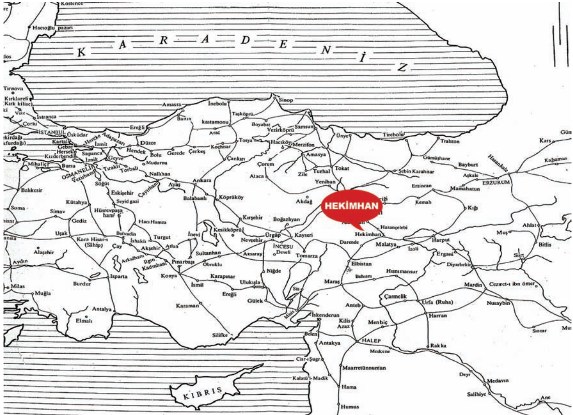
Harita 1. Osmanlı İmparatorluğu'nun Derbend Teşkilatı (Orhonlu, 1990)

Malatya uzun süre Osmanlı-Memluk sınırında, Memluk egemenliğinde kalmıştır. 1484'te Memluk askerlerinin Osmanlı askerlerini "Malatya derbendinde" pusuya düşürmesi dikkat çekicidir. Pax Oto-