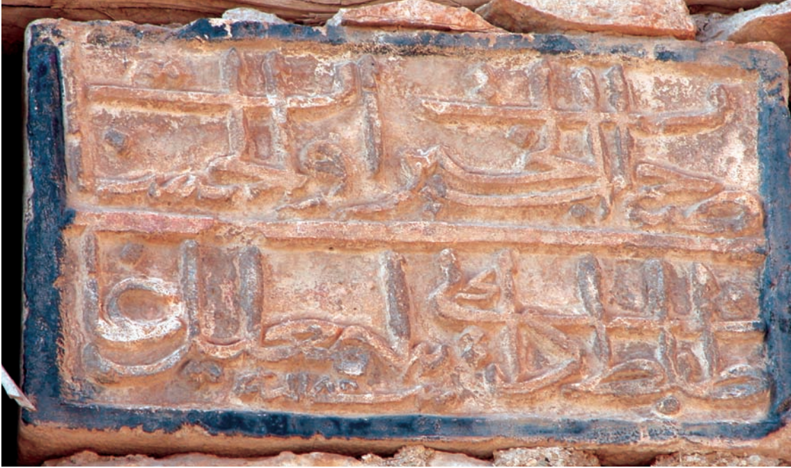
Resim 2 - Avlunun kuzey duvarındaki 1771 tarihli kitabe

Sâhibü'l-hayrât ve'l-hasenât Zâbit Hacı İsmail Ağa sene 1185