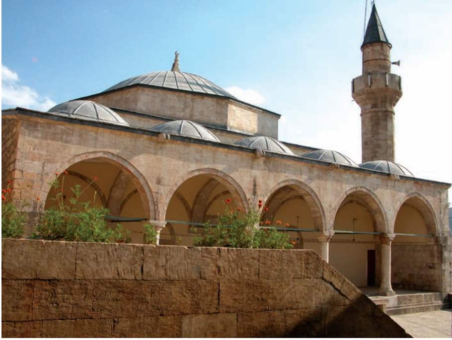
Resim 5. Kuzey doğudan son cemaat yerine bakış

silindirik biçiminde devam ederek, kurşun levhalarla kaplı, konik külahla sonlanmıştır (Resim 5).