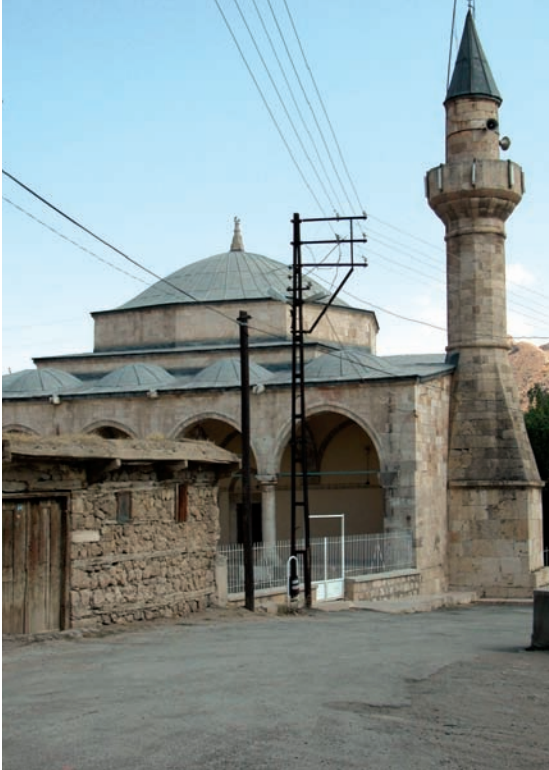
Resim 3. Kuzey batıdan bakış

üstlü dikdörtgen biçiminde ikişer pencere yerleştirilmiştir (Resim 4). Boyuna dikdörtgen, lentolu pencerelerin üsttekilerinin yukarısında sivri kemerli alınlık bulunmaktadır.