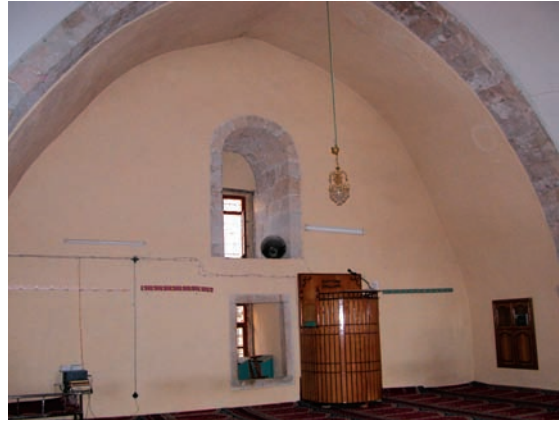
Resim 9. Batı duvar

Mihrap, güney duvar aksında, beş kenarlı niş şeklindedir (Resim 11). Mihrap kavsarası sade, sivri kemer biçimindedir ve dikdörtgen bir çerçeve oluşturan enli bir bordürle kuşatılmıştır. Kavsara kemeri yukarıdaki dikdörtgen levha yenidir. Bezemesiz çok sade mihrapta hafif bir profilden sonra bordüre geçildiğinden bordür daha taşınılıdır.