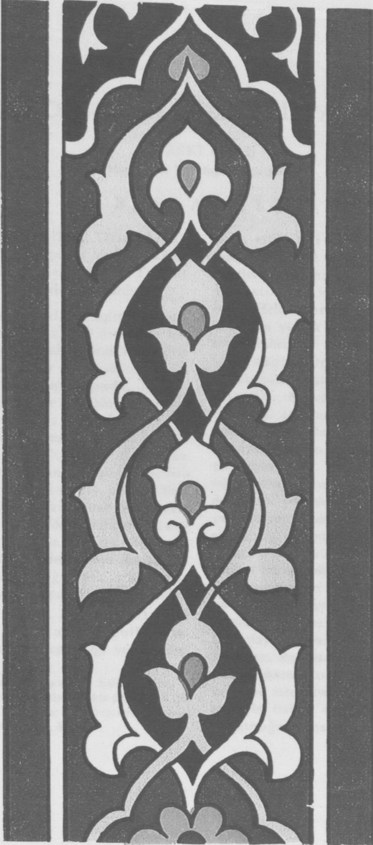
Edirne'de Şah Melek Paşa Camii'ni nakışları.