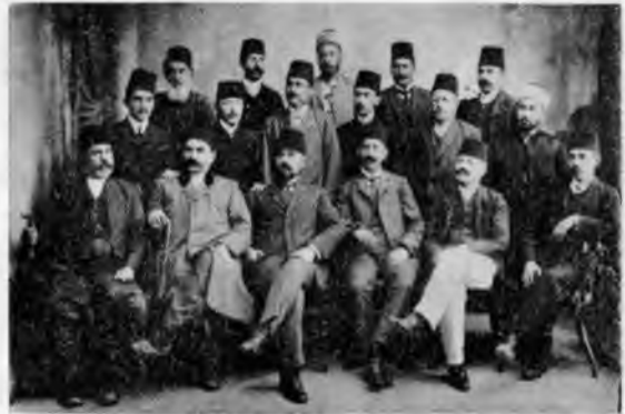
RESİM: 1/C 1905 Varna Encumen Azaları