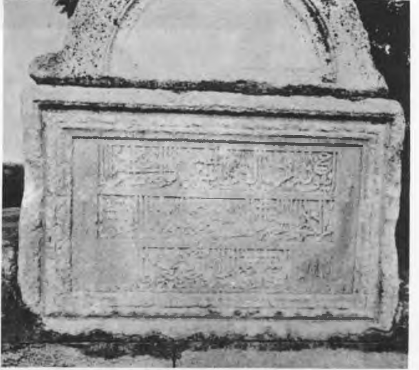
RESİM: 16/A Köstendil Köprüsü kitâbesi.