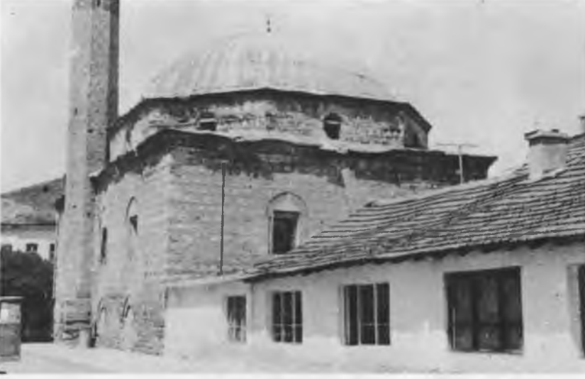
RESİM: 16 Köstendil Camii (Arkadaki dükkanlar vakıftır).