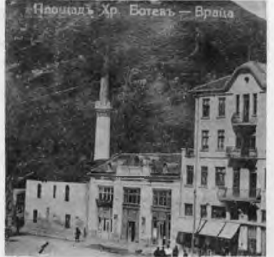
RESİM: 47/B Viraca Camii