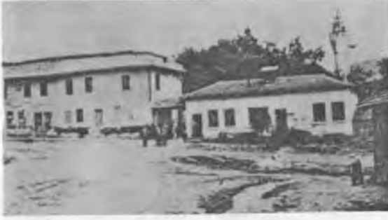
RESİM: 2 Halen mevcut olan camilerden birisi