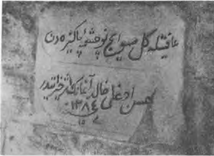
RESİM: 23 Kallagra'da bir çeşme kitabesi. "Afiyetle gel su iç bu çeşme-i pakizeden, Hasan oğlu Halid Ağa'nın eser-i hayratıdır. 1284"