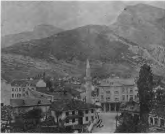
RESİM: 47/A Viraca Camii, Okul ve Müftülük