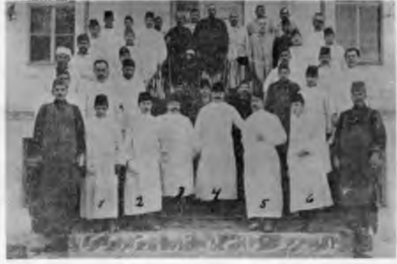
RESİM: 1/A İslâm Hastahanesi görevlileri.