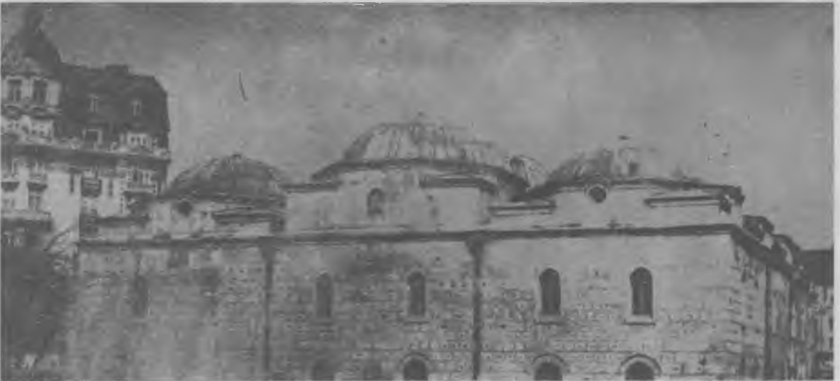
RESİM: 29 Fatih'in Veziri Mahmut Paşa Camii.