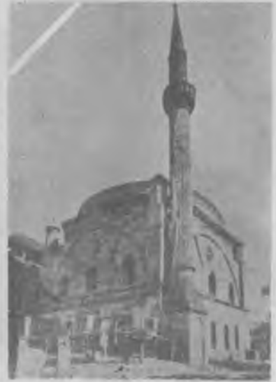
RESİM: 28 Bayraklı Camii Silistre