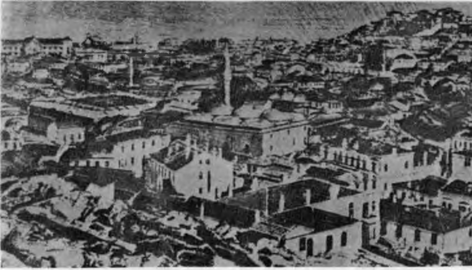
RESİM: 7 Filibe'nin genel görünüşünde Türk- İslam abideleri.