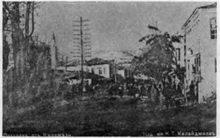
RESİM: 12 Kırcaali