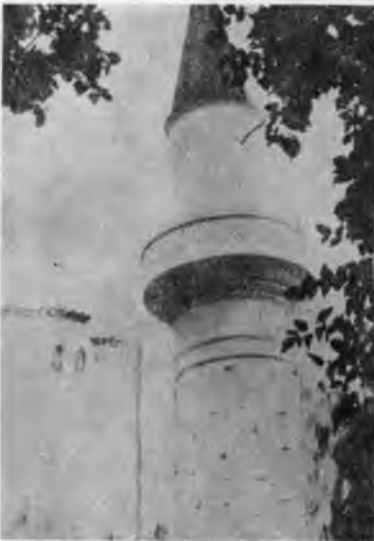
RESİM: 22 Kallagra Sultan Camii