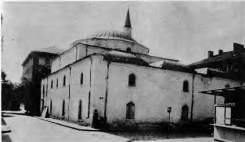
RESİM: 48 Yanbolu Ebubekir Camii