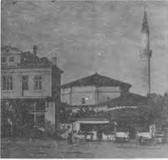
RESİM: 4 Çay Camii, Eski Cuma