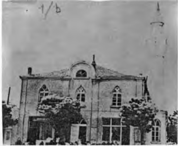
RESİM: 1/B Aydos Camii