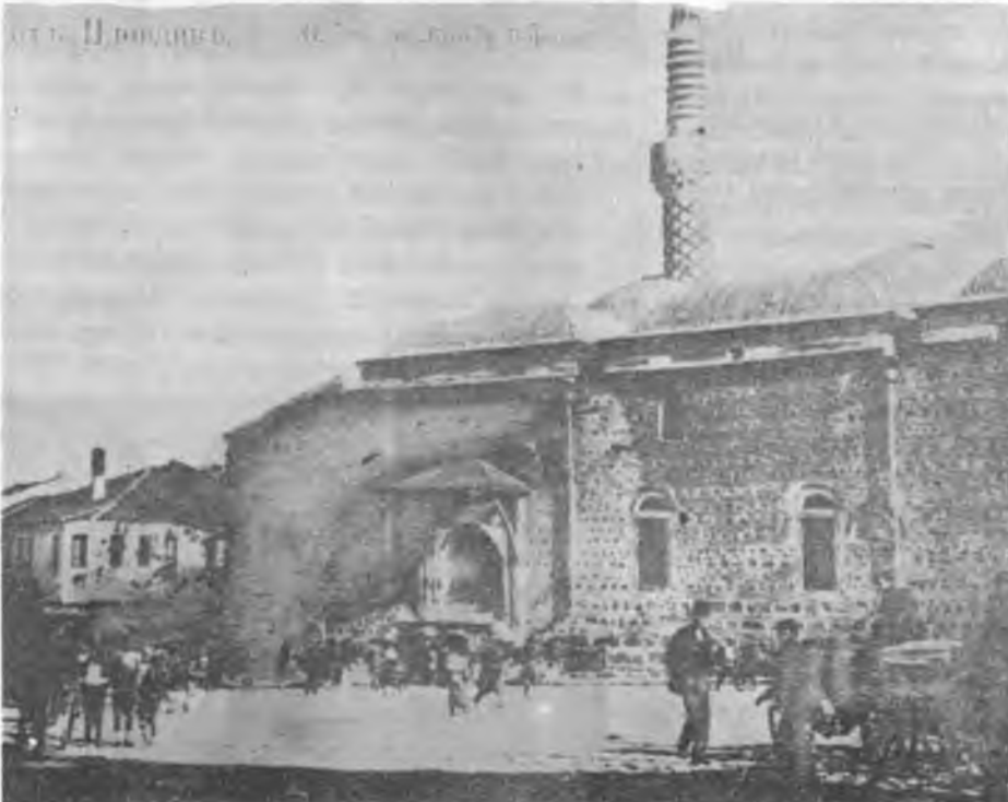
RESİM: 6 Filibe'deki Cuma Camii.