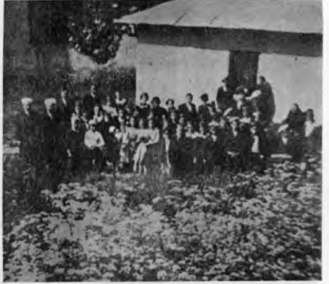
RESİM: 33 Balı Baba Türbesi.