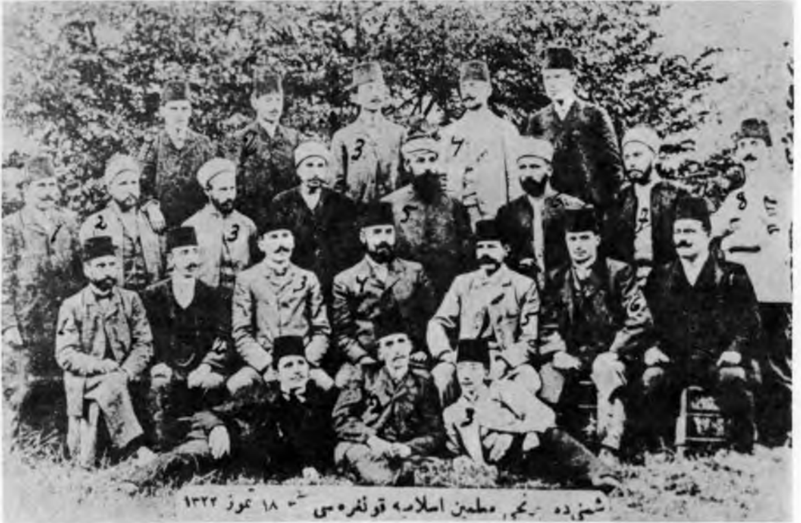
RESİM: 15/A Şumnu'da Birinci Muallimini İslâmiyye Kongresi. 18 Temmuz 1322