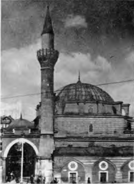
RESİM: 32 Sofya'da Kadı Seyfullah Efendi Camii