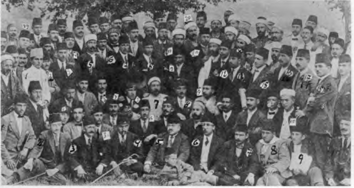
RESİM: 15 Kızanlık Kongresi, 1921.