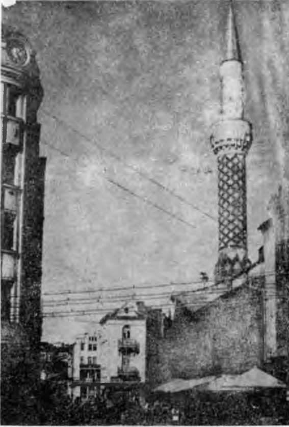
RESİM: 8 Muradiye Camii Filibe.