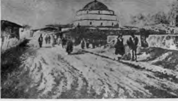
RESİM: 30 Kadı Seyfullah Camii