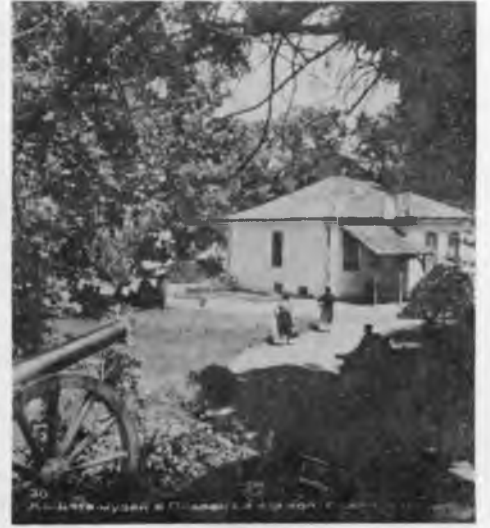
Gazi Osman Paşa Müzesi