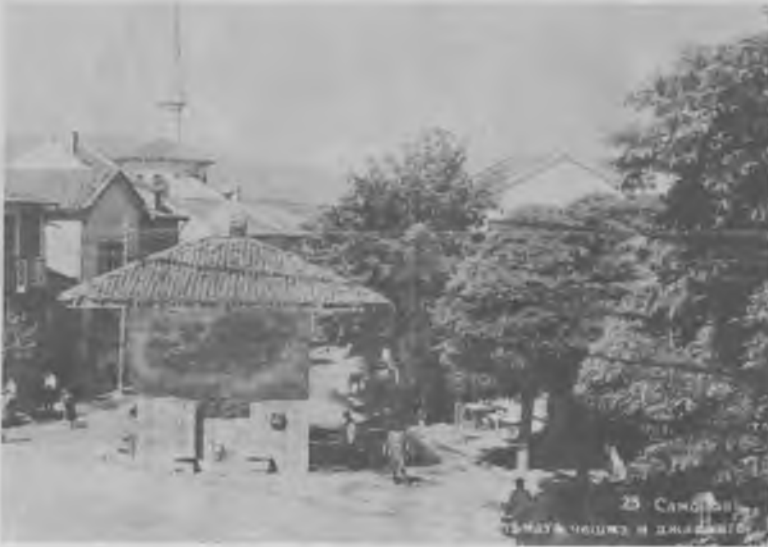
RESİM: 27 Kuppel Çeşme, Samakov.