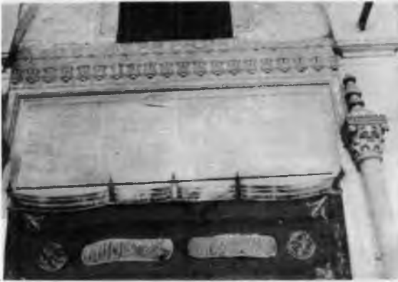
RESİM: 39 Şerif Paşa Camii giriş kapısı.