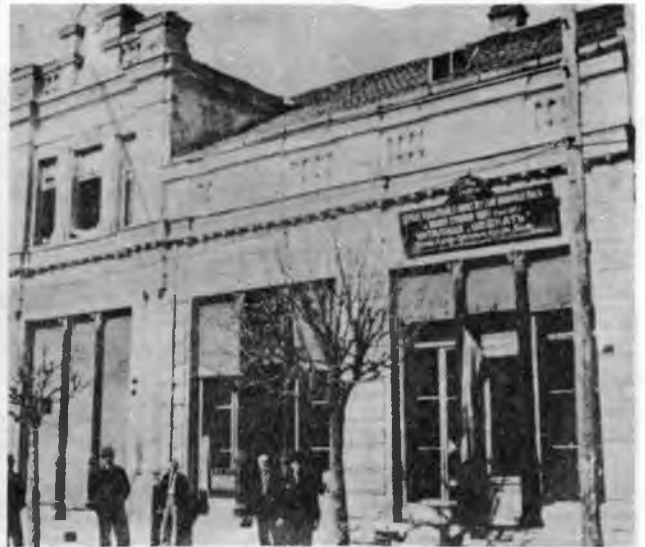
RESİM: 46 Şefkat Kiraathanesi Vidin.