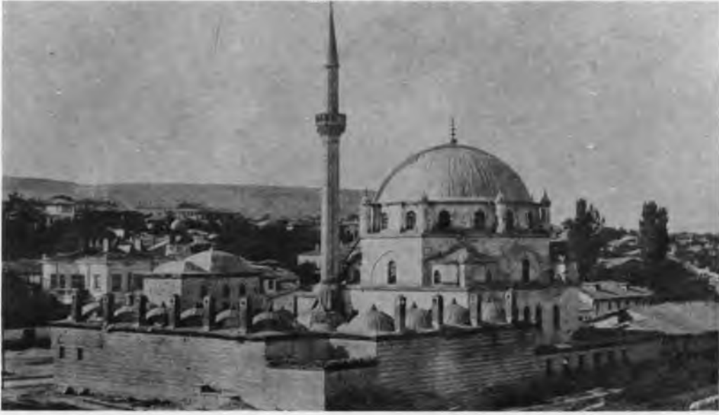
RESİM: 38 Şumnu, Şerif Paşa Camii