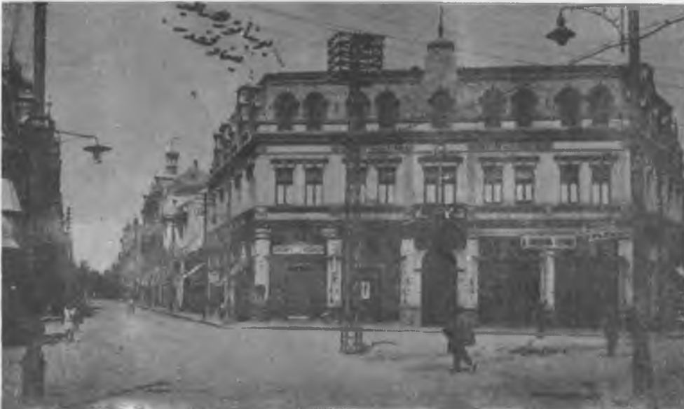
RESİM: 25 Ruscuk'ta Cemaat-i İslamiye'nin yaptığı vakıf otel.