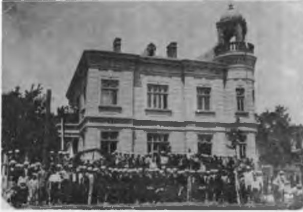
Sumnu, Nüvvab Medresesi