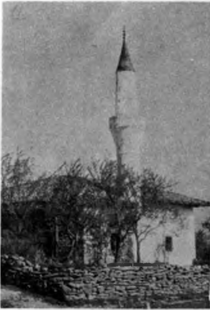
RESİM: 11 Karnavat — Rapça Köyü Camii