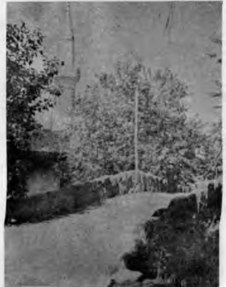
RESİM: 10 Karlova'da bir Kopru