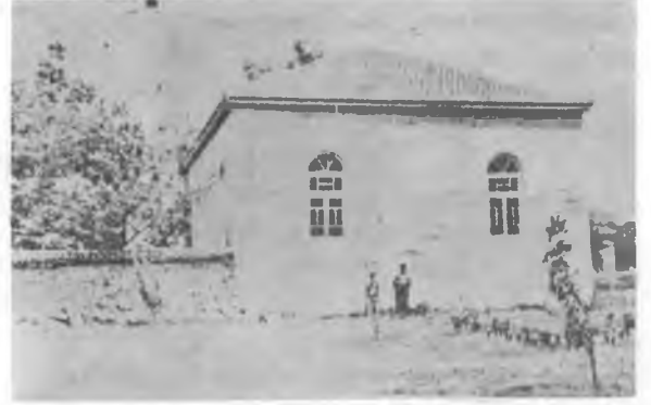
RESİM: 3 Gayesi dışında kullanılan bir cami.