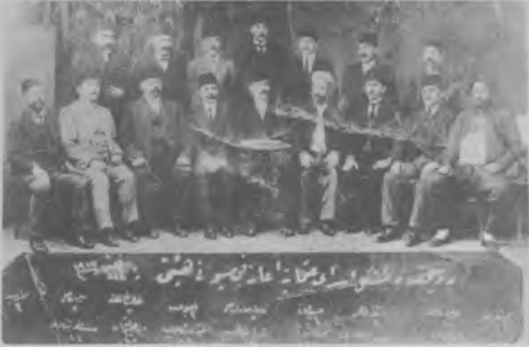
RESİM: 25/A Ruscuk'taki Osmanlı Esirlerine Yardım Derneği üyeleri