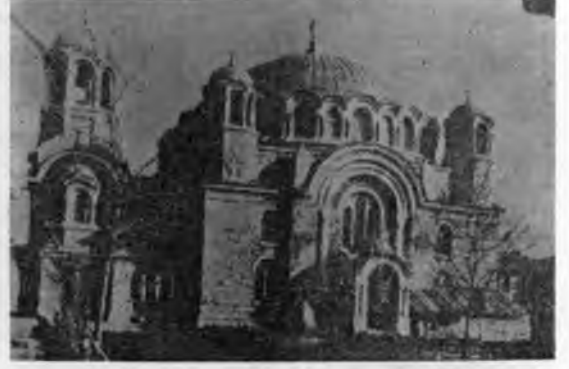
RESİM: 31 Sofya'da Sofu Mehmed Camii (Kiliseye çevrildikten sonra)