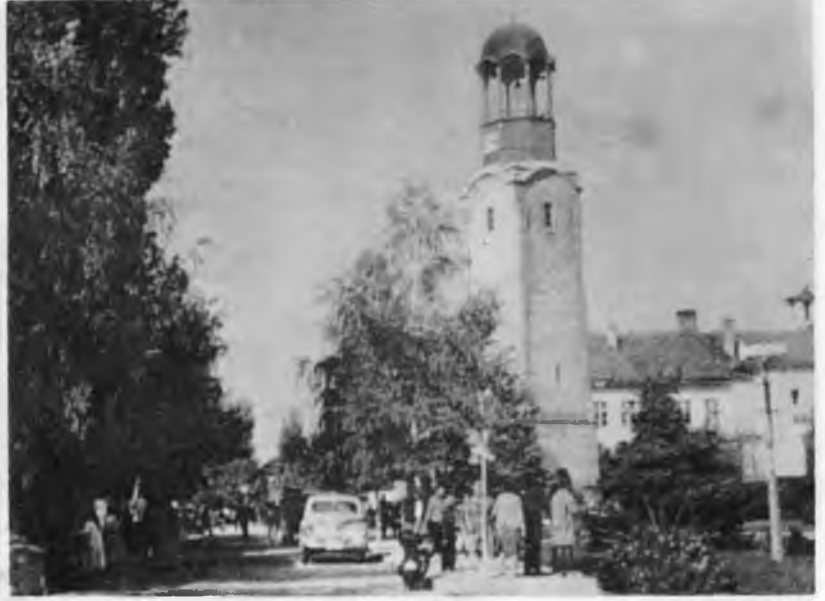
RESİM: 19 Razgrad saat kulesi.