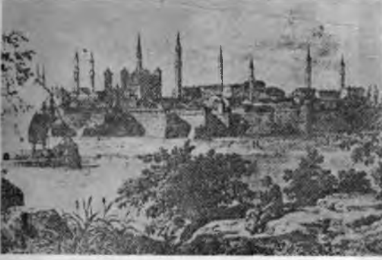
RESİM: 42 Vidin'den bir görünüş, 1870