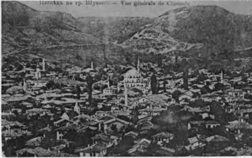
RESİM: 34 Şimnu panoraması.