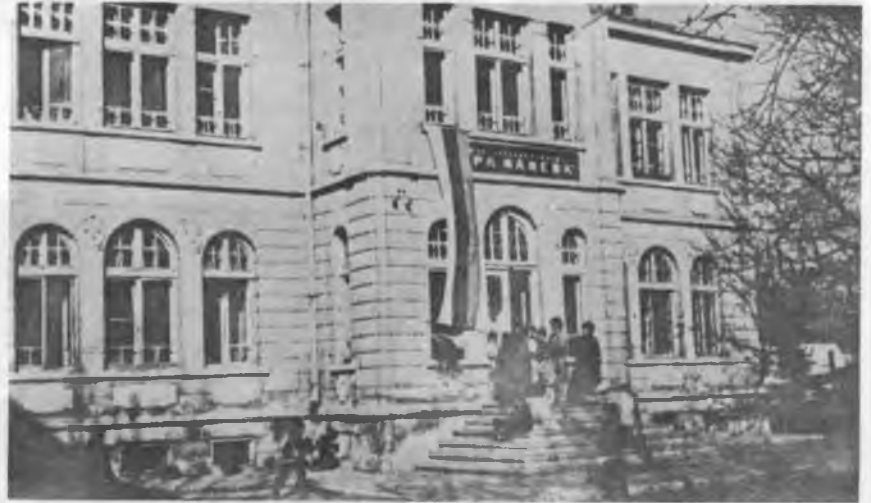
RESİM: 24 Said Paşa Rüşdiyesi Ruscuk