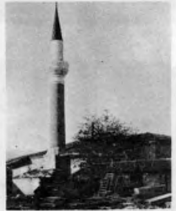
RESİM: 14 Kızanlık İskender Bey Camii