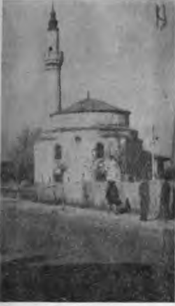
RESİM: 18 Razgrad Ak Camii