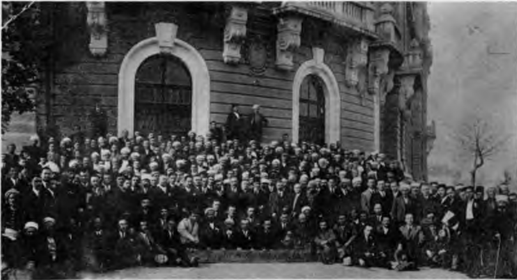
RESİM: 33/A Sofya Millî Kongre