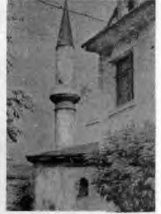
RESİM: 43 Vidin'de bir cami.