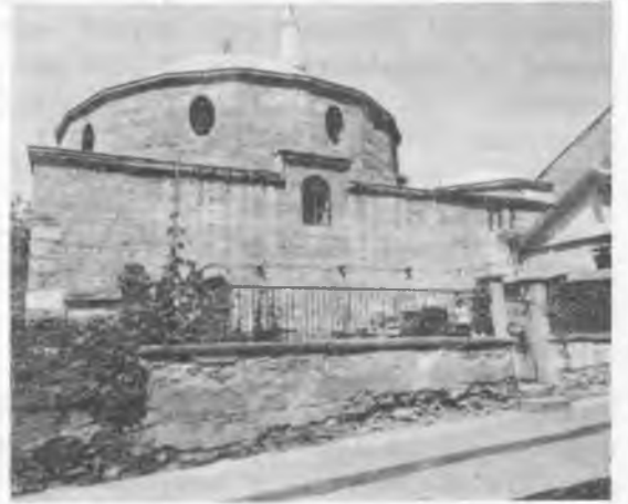
RESİM: 5 Eski Zagra, Hamza Bey Camii.