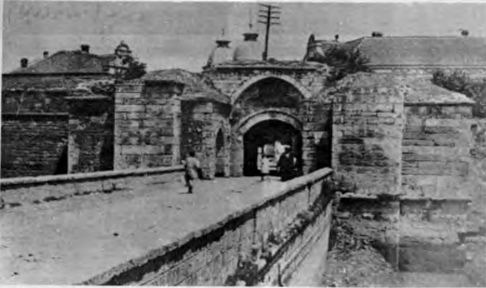
RESİM: 44 Vidin İstanbul kapısı.