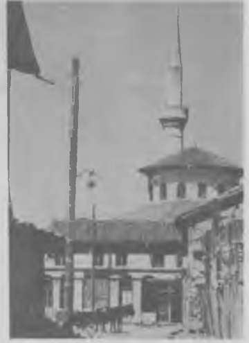
RESİM: 26 Samakov Camii Sofya