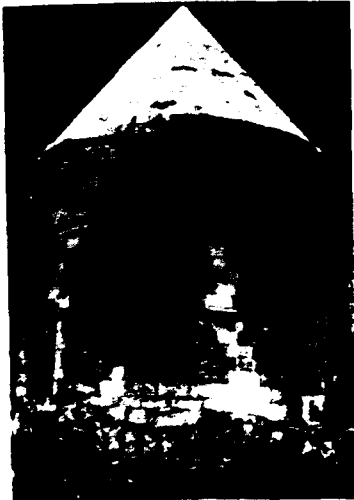
Karamanoğlu Alaeddin Bey Türbesinin dıştan görünüşü ve giriş kapısı

Ankara Üniversitesi Dil ve Tarih Coğrafya Fakültesi Sanat Tarihi Anabilim Dalı Araştırma Görevlisi