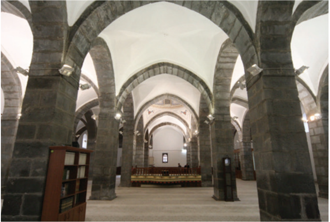
Resim 12. Yapının iç mekânı, (kuzeyden güneye bakış) (2012)