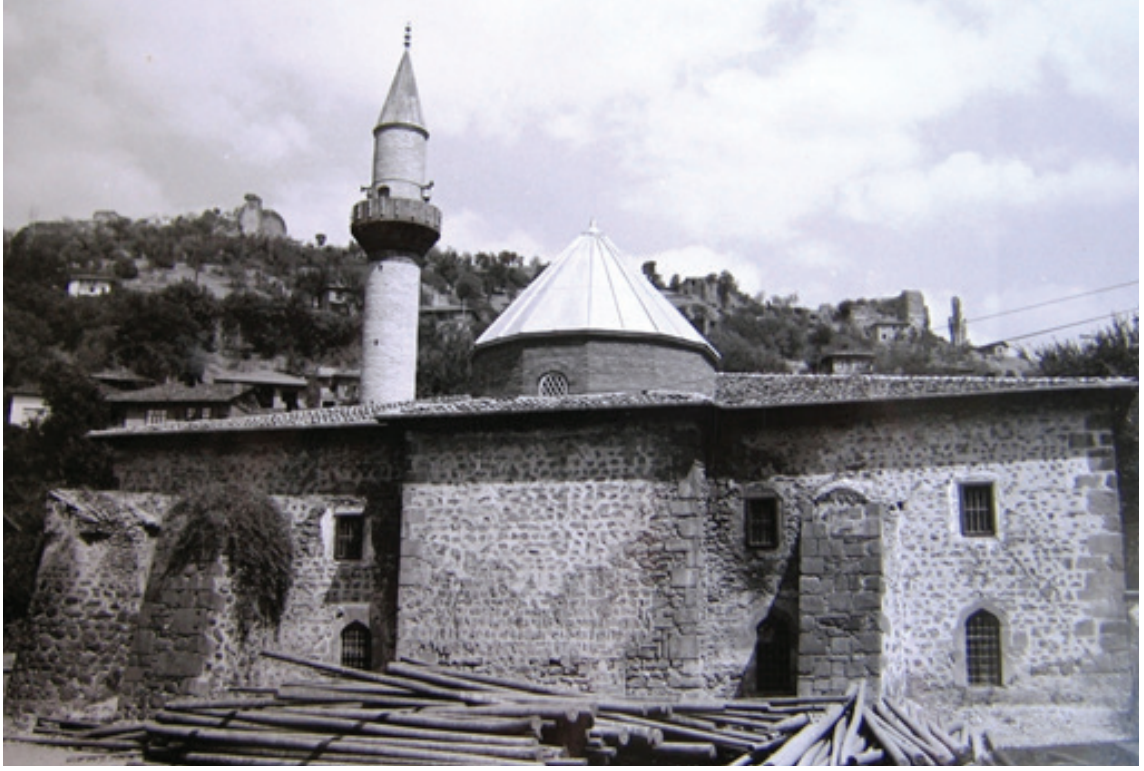
Resim 27. Güney cephenin 1970'li yıllardaki onarımından sonraki durumu (Cantay 1976: R.48)