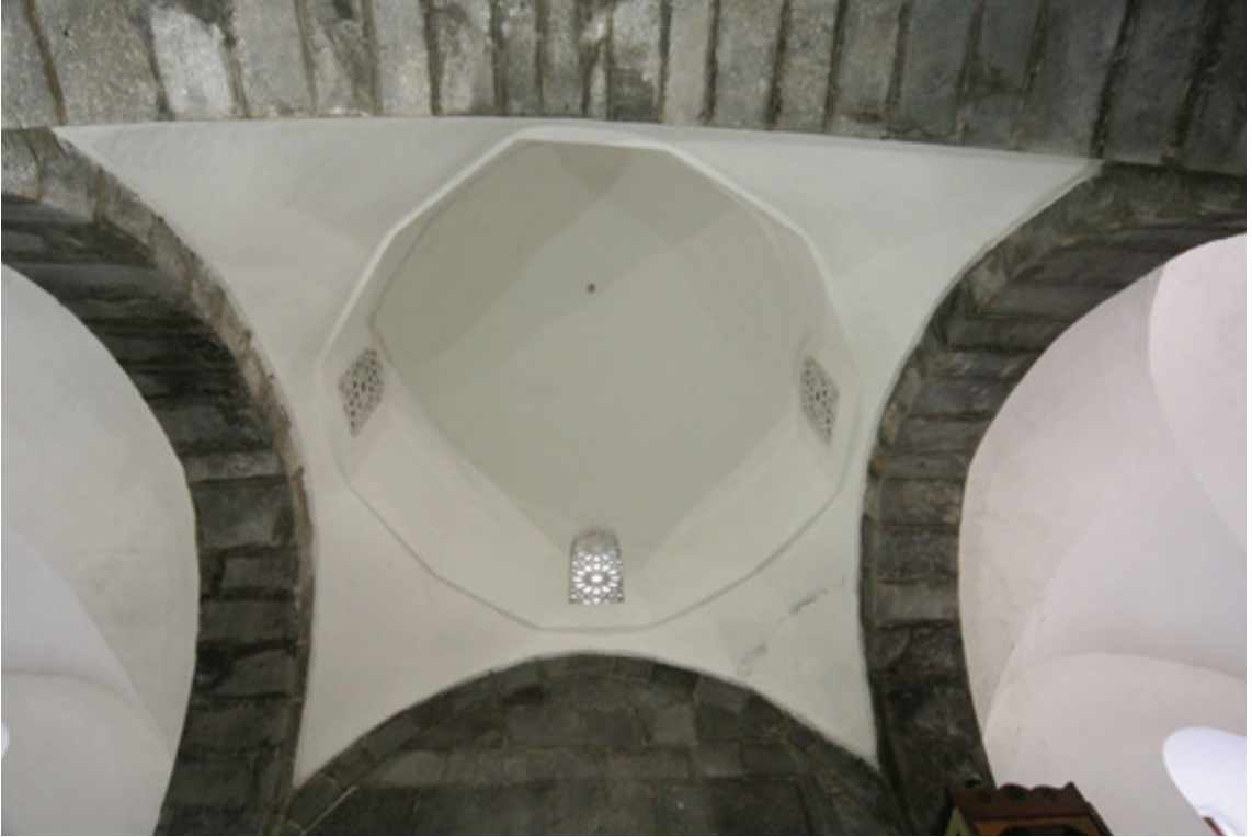
Resim 14. Mihrap öñü kubbesi (2012)