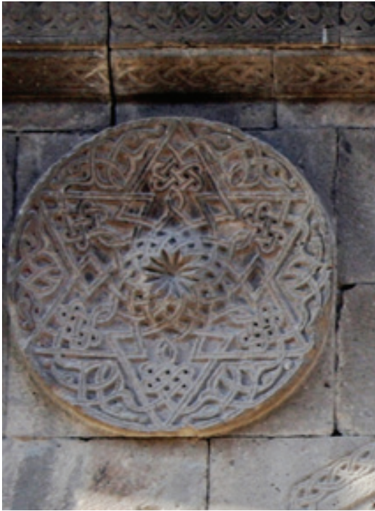
Resim 33. Niksar Çöreği Büyük Tekkesi taçkapısı, ayrıntı (2012)