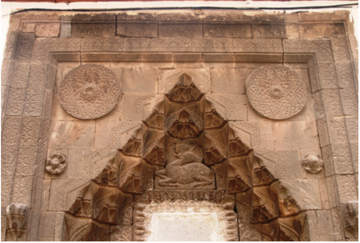
Resim 32. Niksar Çöreği Büyük Tekkesi taçkapısı (2012)