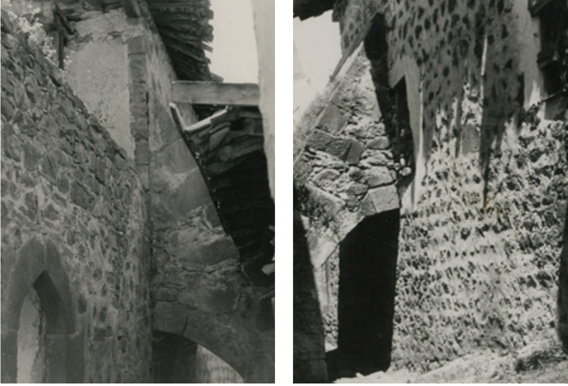
Resim 24 - 25. Batı cephesindeki payandalar ve pencerelerin durumu