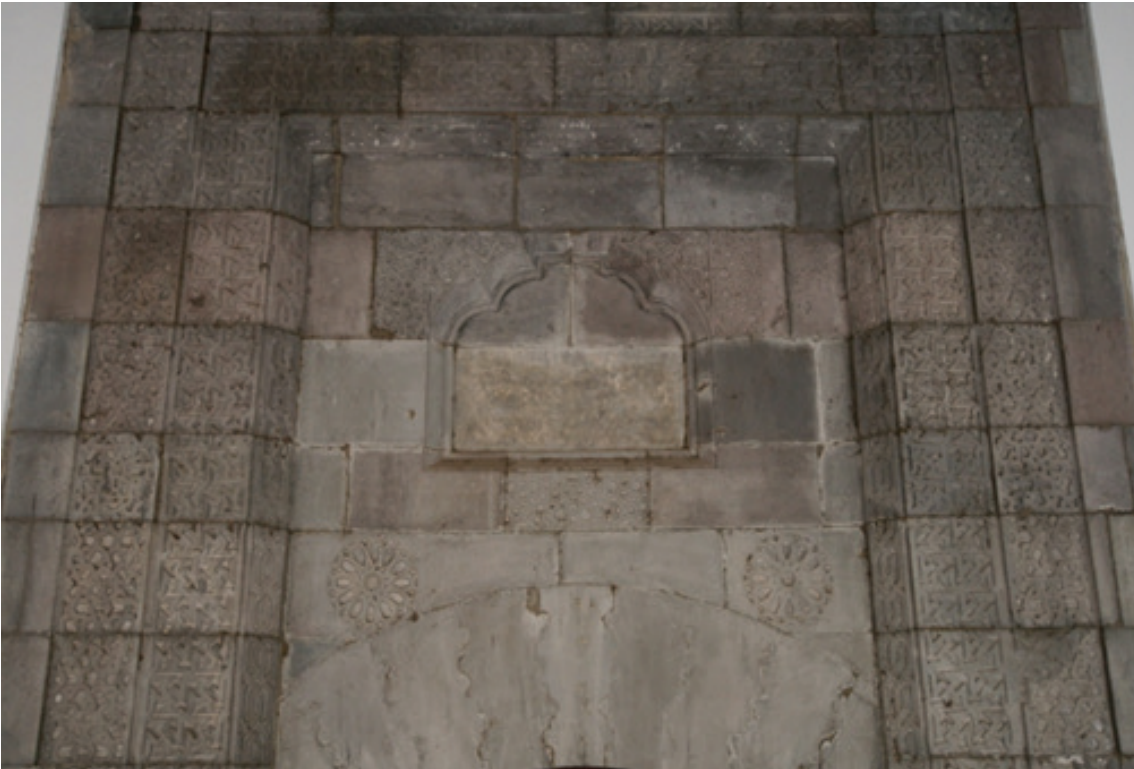
Resim 4. Taçkapı ayrıntısı (2012)