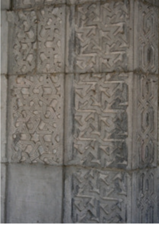
Resim 5. Taçkapı ayrıntısı (2012)