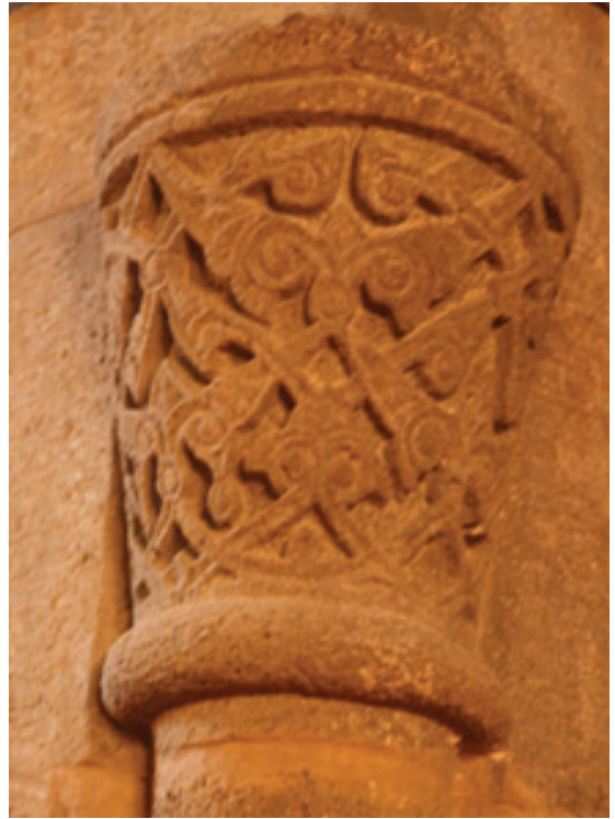
Resim 34. Erzurum Ahmediye, Medresesi sütunçe başlığı (2007)