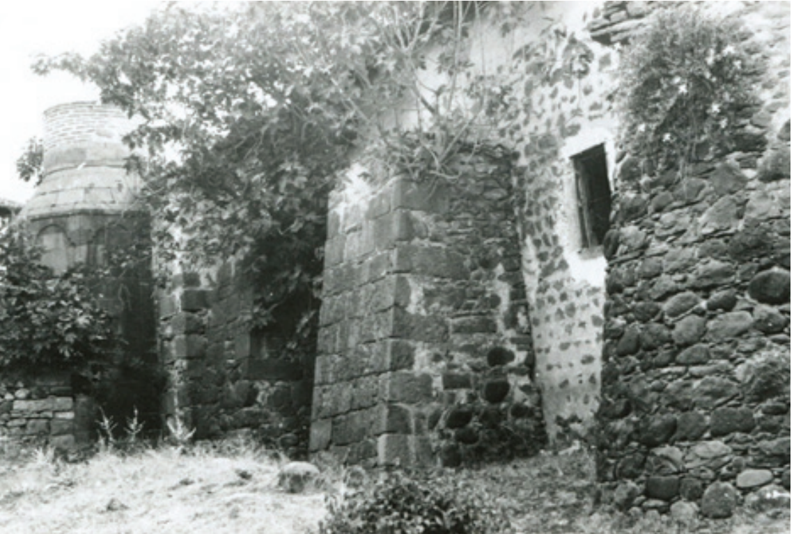
Resim 23. Batı cephesinin onarımdan önceki durumu