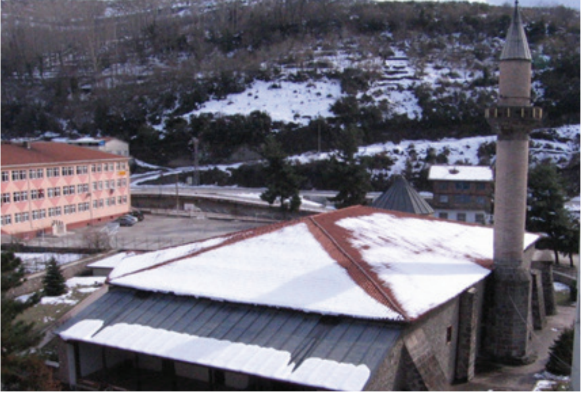
Resim 1. Niksar Ulu Camii (2012)