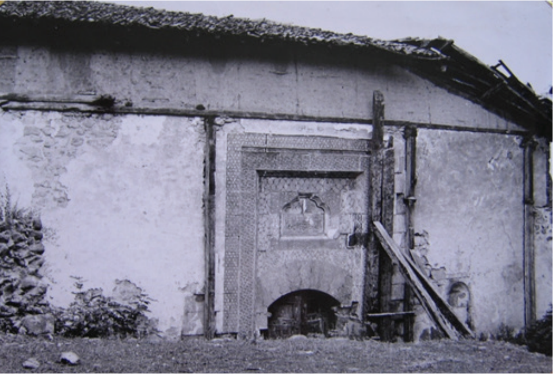
Resim 21. Kuzey cephenin onarımdan ve kazıdan önceki durumu (Gültekin 1968: R.26)