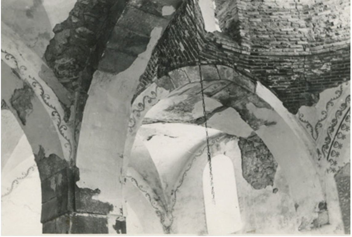
Resim 30. Yapının onarımdan önceki durumu, 1960'lı yıllar