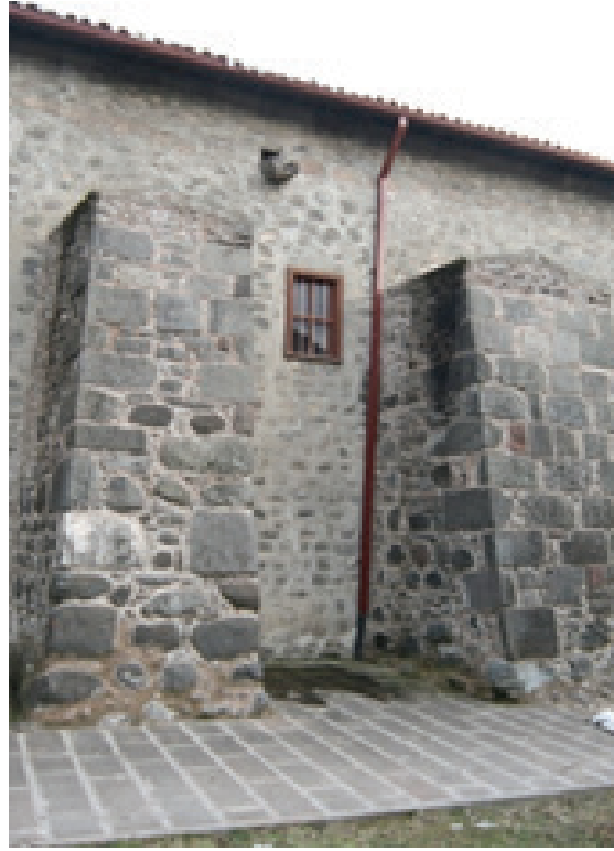
Resim 8-9. Yapının batı cephesi (2012)