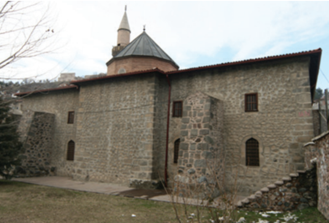
Resim 10. Yapının güney cephesi (2012)