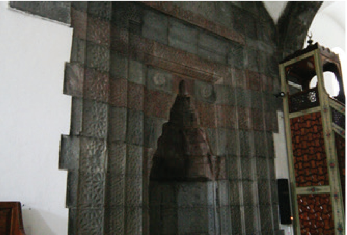
Resim 16. Mihrap (2012)