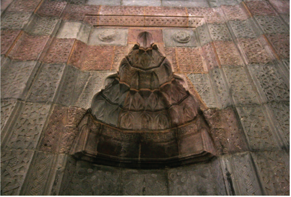
Resim 17. Mihrap ayrıntısı (2012)