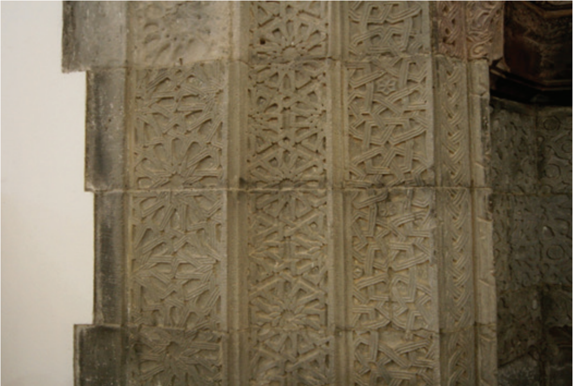
Resim 18. Mihrap ayrıntısı (2012)