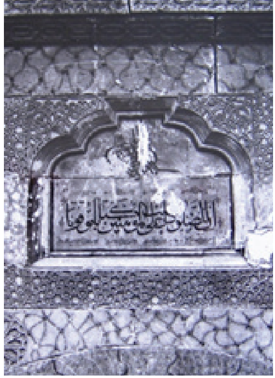
Resim 6. Taçkapıda kitabe ayrıntısı (Gültekin 1968)