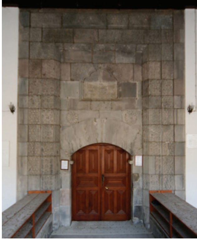
Resim 3. Kuzey cephede taçkapı (2012)