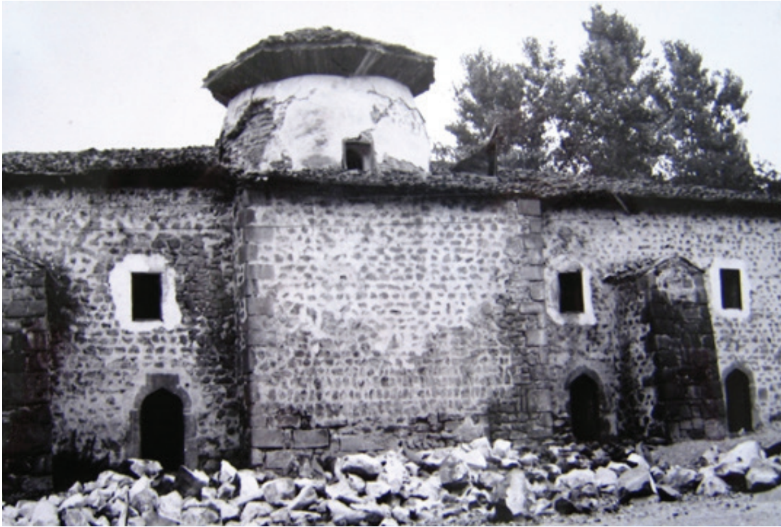
Resim 26. Güney cephenin onarım öncesi durumu (Gültekin 1968: R.27)