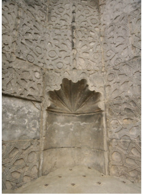
Resim 19 - 20. Mihrap ayrıntısı (2012)