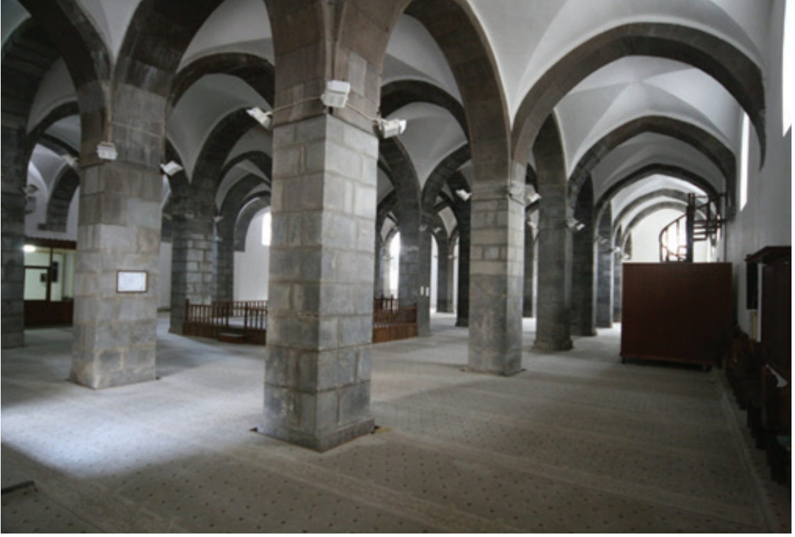
Resim 13. Yapının iç mekânı, (kuzeybatıdan bakış) (2012)