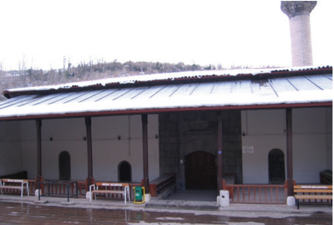
Resim 2. Ulu Camii'nin kuzey cephesi (2012)