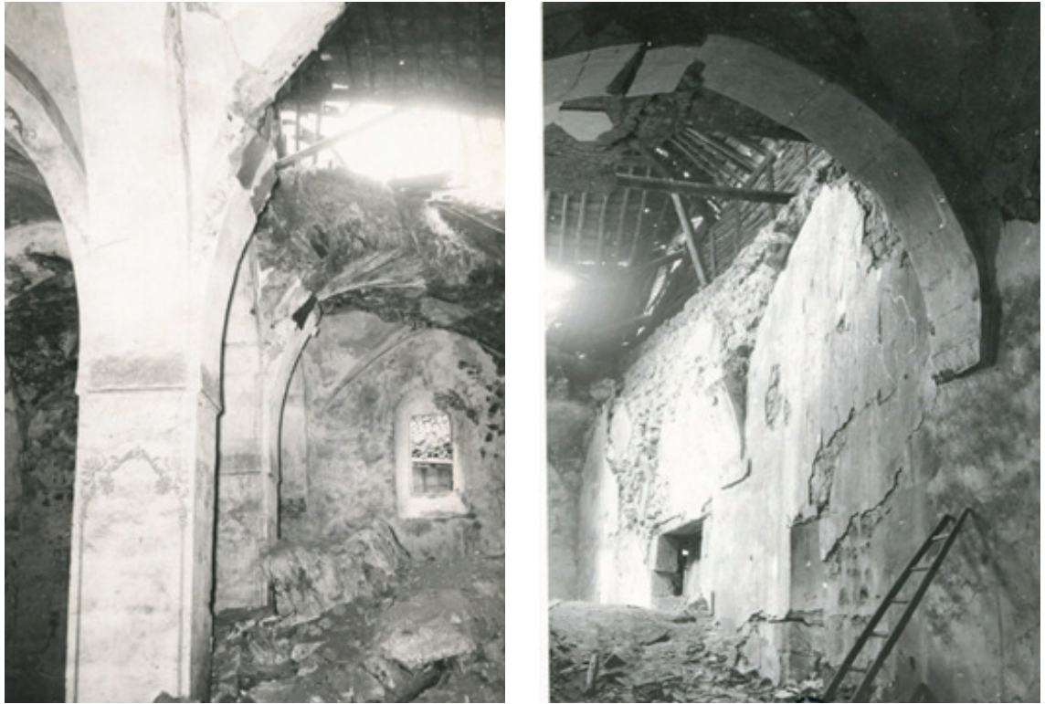
Resim 28 - 29. Yapının onarımdan önceki durumu, çökmüş üst örtüler.