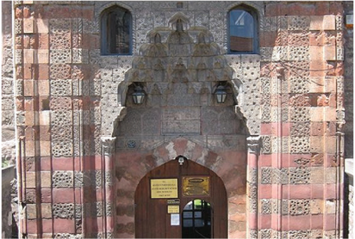
Resim 31. Tokat Gök Medrese taçkapısı