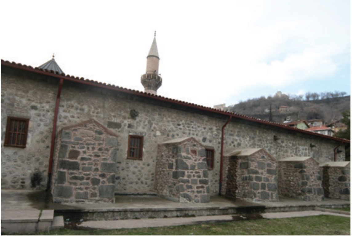
Resim 11. Yapının doğu cephesi (2012)