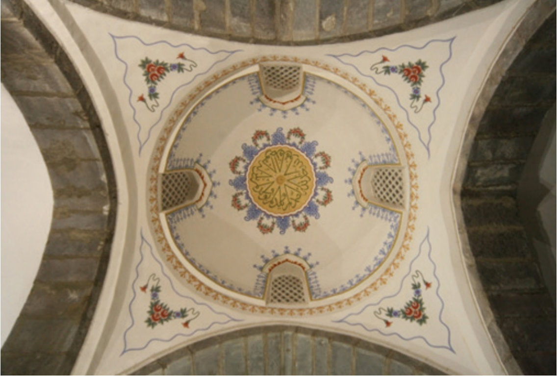
Resim 15. Mihrap aksındaki ikinci kubbe (2012)