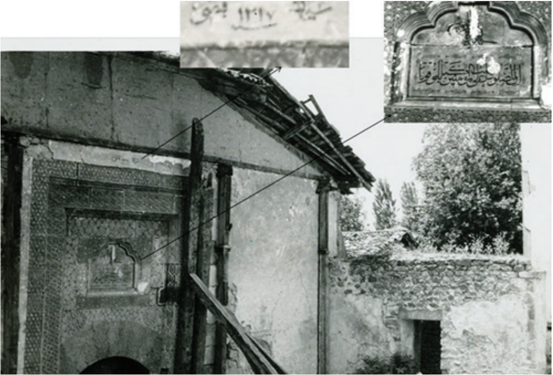
Resim 7. Taçkapının onarımdan önceki durumu (Gültekin 1968: R.26)