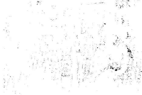
Kânunî'ye Yardım İstemey'e Gelen Açe Elçileri

Selim devrinde Kıbrıs'ın fethiyle Anadolu'nun ve doğu Akdenizin emniyeti sağlandı. İnebahtı deniz savaşında mağlup ve perişan olan Osmanlı donan-