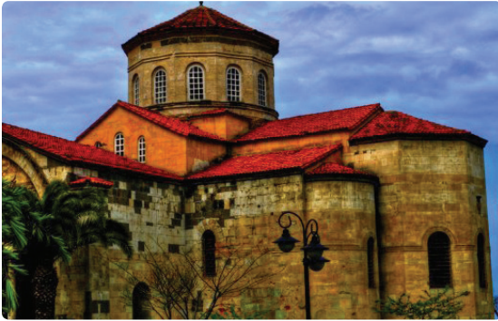
Şekil 3.Trabzon Ayasofya Camii'nin fotoğrafı