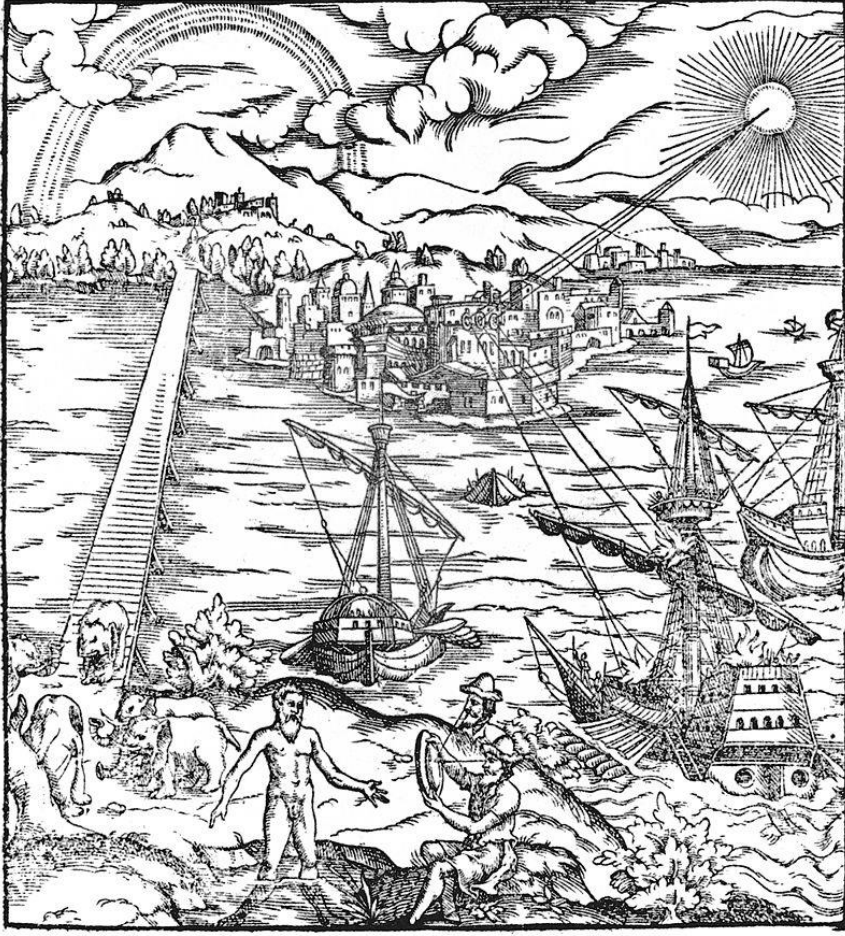
Resim 2: Opticae Thesaurus Alhzeni Arabis Libri Septem , 1572, Basel baskısının kapak resmi.

Kitâb el-menâzir, Avrupa’da matbaa dönemine geçildikten sonra, 1572 gibi erken bir tarihte, Friedrich Risner’in editörlüğünde Basel’de Opticae Thesaurus Alhzeni Arabis Libri Septem 232 adıyla Latince olarak basılır. Risner, Kitâb el-menâzir’in arkasına dönemin Polonyalı doğa bilimcisi Witelo’nun Optica ve De Crepusculis et Nubium Ascensionibus 233 adlı iki eserini de ekler.