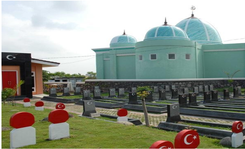
Resim 3: Bitai'deki Osmanlı mezarlığı

iddia etmektedir. Pande köyü gibi, atalarının Açe'ye 12. yüzyılda geldiğini savunmaktadırlar. Günümüzdeki Bitai köyü halkının, 2. Sultan Selim tarafından gönderilen, askerler, ustalar ve diğer uzmanları kapsayan Osmanlı yerleşimcilerinin neslinden olduğu bilinmektedir. "Emperum" şeklinde ilginç ismi olan bir köy de vardır, bu kelime muhtemelen "Empu" ve "Rum" kelimelerinin birleşiminden oluşmuştur. Empu Malay dilinde tüfekçi ustası için kullanılan normal bir kelimeydi, Rum kelimesi ise Türkler için kullanılıyordu. Bu köy muhtemelen Türk tüfek ustalarının Açe Sultanı'na top ve tüfek yapımı için yerleştikleri bölgeydi, şu andaki sakinlerinden bazıları Türk ataları olduğunu iddia etmektedirler. Bu bölgelerin civarında, özellikle Bitai'de keşfedilen Osmanlı mezarları, Osmanlı ile bağlantı olduğuna dair tarihi iddiayı güçlendirmektedir (Özay, 2014).