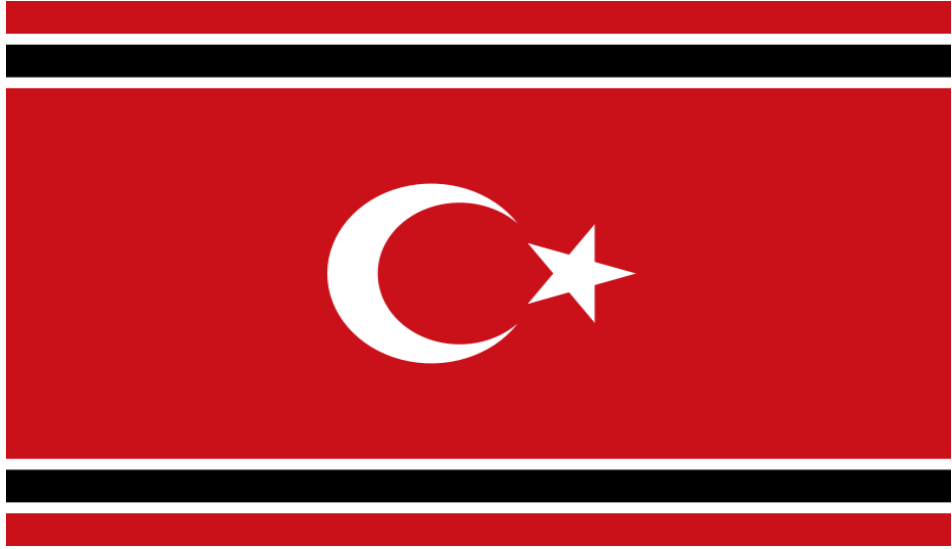
Resim 2: Açe bayrağı

Açelilerle ilgili hafızalarını canlandıran ve Açe'nin Türkler için olan önemini tazeleyen, bağış ve yardım görevlilerinin Açe'ye gittiği son tsunami faciasına kadar Açe sonraki Osmanlı Türklerinin akıllarında neredeyse unutulmuştu. Ancak Açeliler Osmanlıların kendileri için ne anlama geldiğini hiç bir zaman unutmadı. Osmanlı ulus olarak, neredeyse Açe'nin kimliğinin bir parçası haline geldi; bugüne kadar kullandıkları bayrak hala Osmanlı bayrağı (Reid, 2005).