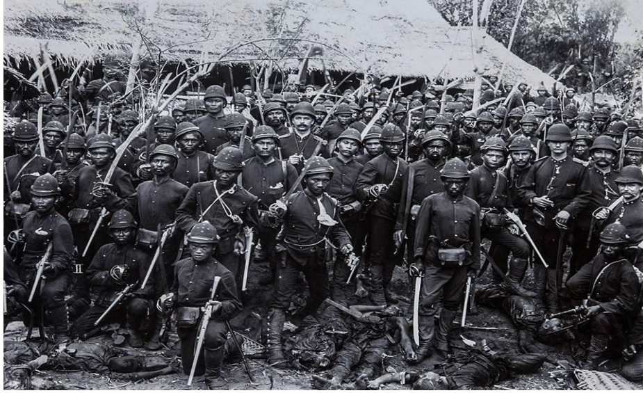
Resim 1: Pedir, Açe, Sumatra, Endonezya, 1898, Hollanda Doğu Hindistan Kraliyet Ordusu (KNIL) Açelilerin cansız bedenleri üzerinde poz veriyor. 60054676

atışgücüne sahip karabine tüfek ile beraber Açe'nin kendi gerilla taktiklerini onlara karşı kullandı ve böylece üstünlüğü elde etmiş oldu. Savaşın sonucunu hızlandırmak için Hollanda daha acımasız bir taktik uyguladı, direnişçileri destekleyen köy ve kasabaları yok etmek için daha çok Endonezyalı Ambonezlerden oluşan Marechaussee birimini kullandı. Bu da çok büyük sayılarda sivil can kayıplarıyla sonuçlandı ve 10 bin Açelinin yarımada sığınma talebine yol açtı. Açeli sivilleri terörize eden bu katliam Açeli soyluların arkadan vurmalarıyla birleşince, Açe'nin mücadelesini oldukça gerilettiler ve Hollanda'nın başarısının dönüm noktası oldu.