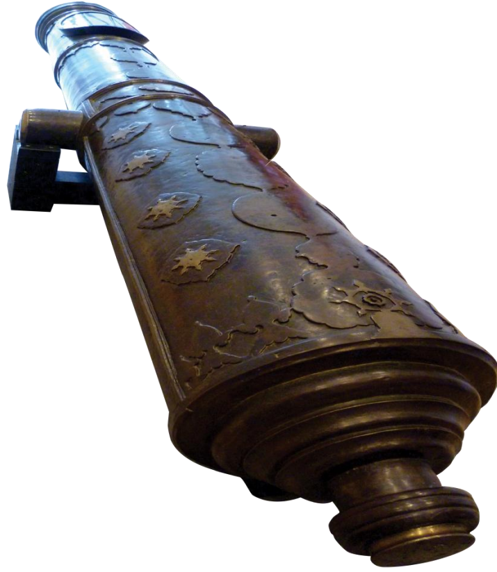
Resim 4: Meriam Lada Secupak, Bronbeek Müzesi, No.27

Açeliler için o toplar sadece toplanacak ve müzede sergilenecek tarihi eserler değil, onlar ulus olarak kimliklerinin bir parçası ve Osmanlı ile olan geçmiş tarihi ilişkilerinin önemli bir kanıtı (Özay, 2007: 25). 2006'da Açe yöneticisi, bu eserlerin Açe'ye iadesinin önemine değinen bir kanun yayınladı, bundan UU RI No 11 yıl 2006, makale 222, paragraf 1'de bahsediliyor: