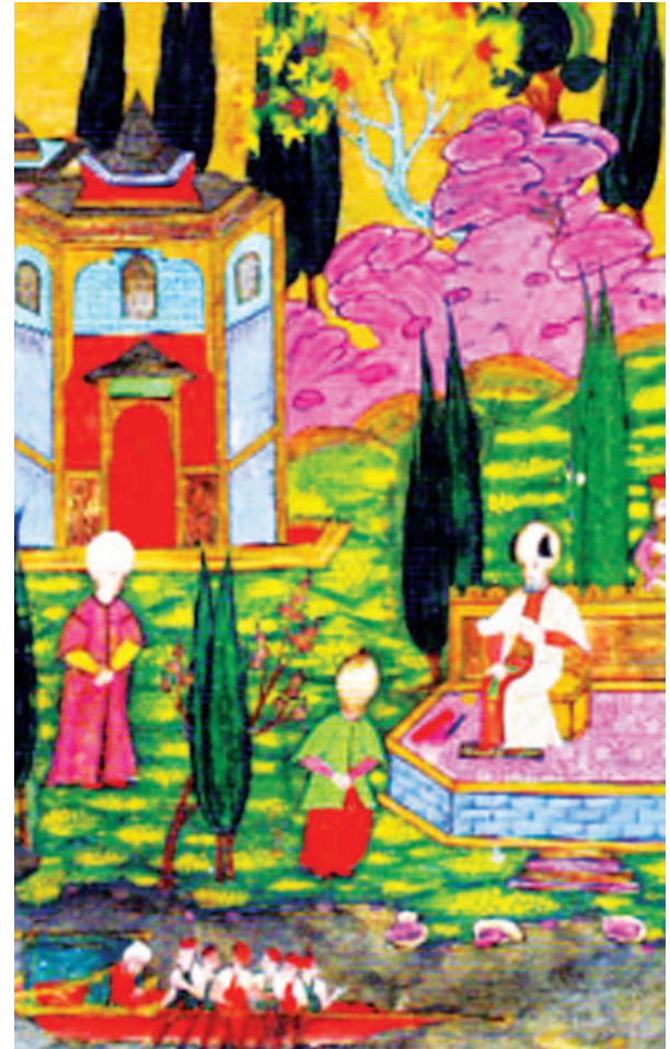
Şekil 1. Kanuni Sultan Süleyman Üsküdar Sarayı bahçesinde (Hünernâme II, TSM H1524, 227b).

Uluslararası koruma kuramı ve yükselen tarih bilinci ile "sit" tanımı 1973 yılında "Eski Eserler Kanunu" ile yasalar da yerini almış ancak aynı yıl yürürlüğe giren Üsküdar İmar Planı bu gelişmenin dışında kalmıştır. 1993 yılında genel olarak külliyeler ve çevreleri sit alanı ilan edilmiş, Rum Mehmet Paşa, Ayazma Camii ve çevresi Koruma İmar Planı, İhsaniye Mahallesi 347 Ada Koruma Amaçlı Uygulama İmar Planı, Yeni Mahalle Koruma İmar Planı, İcadiye-Kuruçeşme Parkı ve Çevresi Koruma Amaçlı İmar Planı, Toygar Hamza Mahallesi 246-247 Ada Koruma İmar Planı hazırlanmıştır. Planlama alanları içinde kalan eski eserler 1973 yılında GEEAYK tarafından tescillense de Üsküdar'ın merkez mahallelerini kapsayan bir sit alanı gerçekleştirilmediğinden bölgenin bütüncül olarak korunmasını sağlamamıştır (Şekil 2).