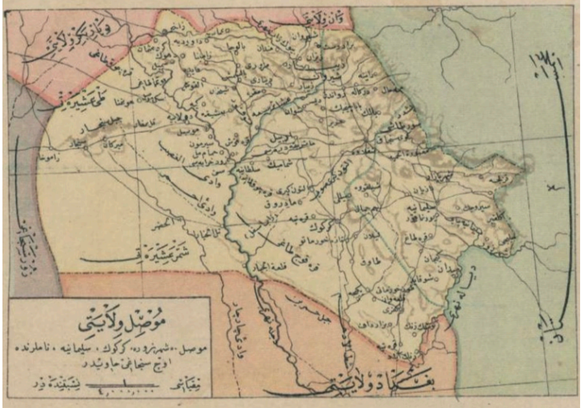
Ek 2: Musul vilayeti, Şehr-i Zor, Kerkük ve Süleymaniye Sancakları.