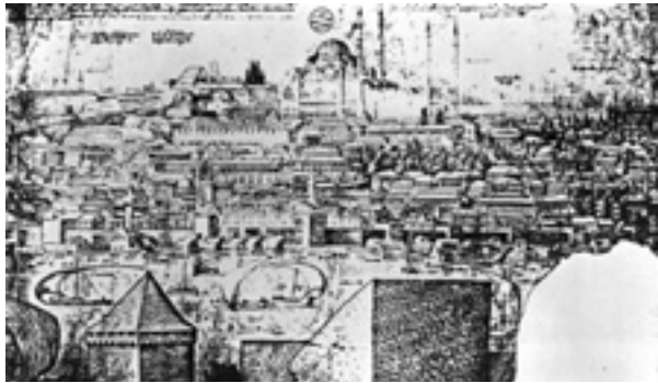
Şekil 10 M.Lorichs, Süleymaniye Külliyesi, Leiden Bibliothek der Rijksuniversiteit (BPL 1758.10)

Haliç ve Boğaz'a hâkim olan Süleymaniye Külliyesinin bir kısmı, yukarıda anlattığımız üzere, Saray-ı Atik-i Âmire arazisinin bir kısmına inşa edilmiştir. (Öz, C.I, 1997: 132). Eski Saray'da 1540 (H.946) yılında çıkan yangın sırasında ahşap binaların çoğu yanınca, Süleymaniye Külliyesi ile birlikte bu binalar da yeniden yapılır ki, muhtemelen bu