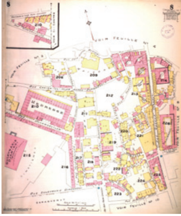
Şekil 8 Goad haritasında Süleymaniye ve çevresinden bir kesit (1904)