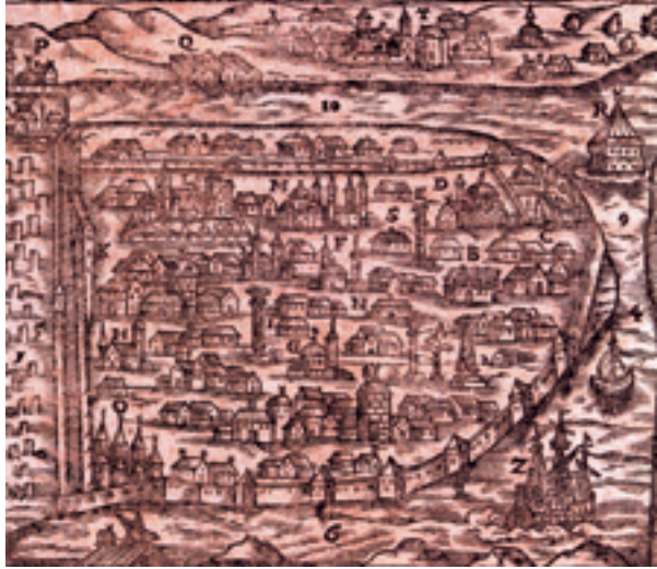
Şekil 5 XVI. yüzyıl sonlarında İstanbul (Schweigger)

Fatih, İmparatorluk sarayının inşâ edilmesi için, bugünkü İstanbul Üniversitesi'nin kurulu olduğu alanı ve Süleymaniye'yi seçmiştir. 1454 (H.858) yılında da çalışmalar başlatılmıştır. Peki, arazide Bizans devrine ait herhangi bir yapı veya kalıntı mevcut muydu? D.Kuban'a göre Tauros Forumu'nun Haliç'e bakan yüzünde Konstantinos'tan beridir kullanılan eski bir Bizans sarayına ait kalıntıların olma ihtimali kuvvetlidir. (Kuban 1998: 21; Kuban 2004: 205). Zaten, Fatih devrinde bölgeye Kal'a denilmekteydi. (Kuban 2004: 205).