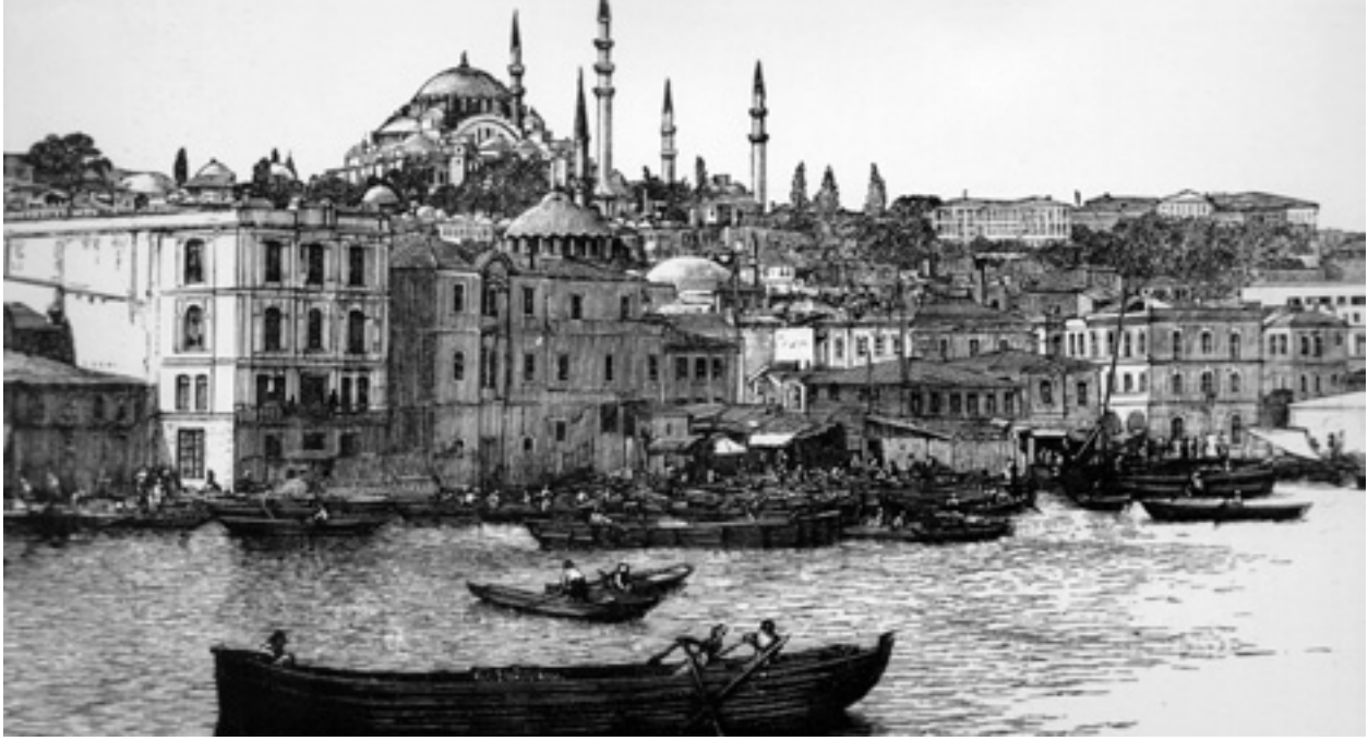
Şekil 1 Eski bir gravürde limandan Süleymaniye'nin görünümü

yapısı penne halini almıştır. (Yalçınlar 1976: 1-2). Buzul dönemlerinin çeşitli evrelerinde ise, Marmara ve Karadeniz göle dönmüş; Buzul dönemler sona erince tekrar aralarında bağlantı oluşmuştur.