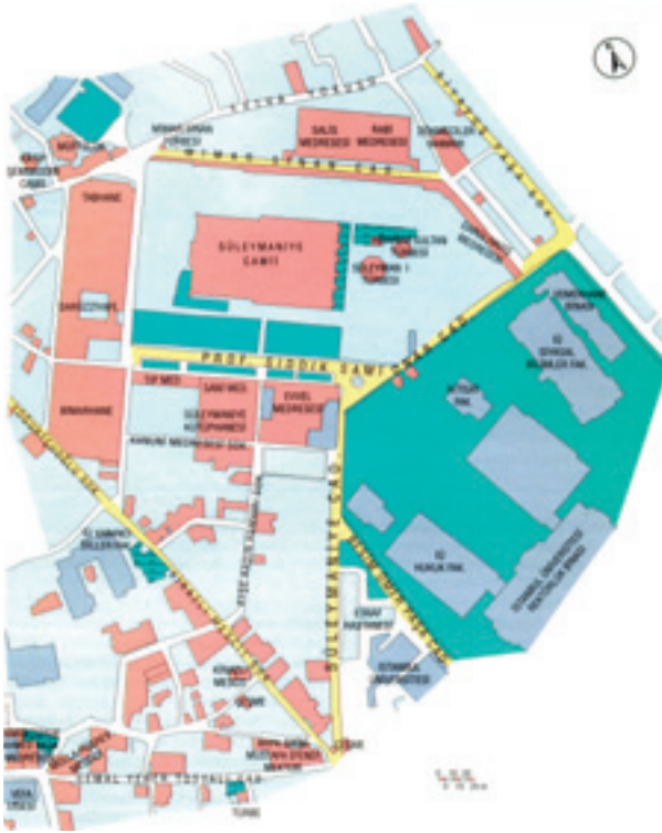
Şekil 17 Süleymaniye Külliyesi (İstanbul plan raporları, İ.B.Ş.B.)

göre ele aldığı ortadadır. Camii, külliye'nin hedef yapısıdır. Mimar Sinan, Haliçe'de doğru oluşan yüksek eğimi, büyük payanda duvarlarıyla teraslar oluşturarak kullanabileceği alanlara çevirmiştir. Caminin dış avlusunu, yapay bir düzlüğe oturtan Usta Mimar, külliye bütünlüğünü oluşturan diğer birimleri de araziye uyacak şekilde farklı kotlar üzerine inşa etmiştir. Batıdaki daha az meyilli alana sıbyan mektebini, Evvel, Sâni, Darüşşifa ve tıp Medreselerini yerleştirirken, alt kısımlarına ise dükkânlar tasarlamıştır. Bunlardan darüşşifâ'nın daha yüksek bir alt yapısı mevcut olup, iki farklı kot üzerinde inşa edildiği görülmektedir. (Kuban