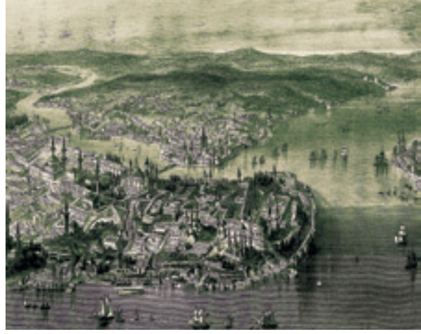
Şekil 11 XIX. yüzyıl başlarında İstanbul

Haliç ve Boğaz'a hâkim olan Süleymaniye Külliyesinin bir kısmı, yukarıda anlattığımız üzere, Saray-ı Atik-i Âmire arazisinin bir kısmına inşa edilmiştir. (Öz, C.I, 1997: 132). Eski Saray'da 1540 (H.946) yılında çıkan yangın sırasında ahşap binaların çoğu yanınca, Süleymaniye Külliyesi ile birlikte bu binalar da yeniden yapılır ki, muhtemelen bu