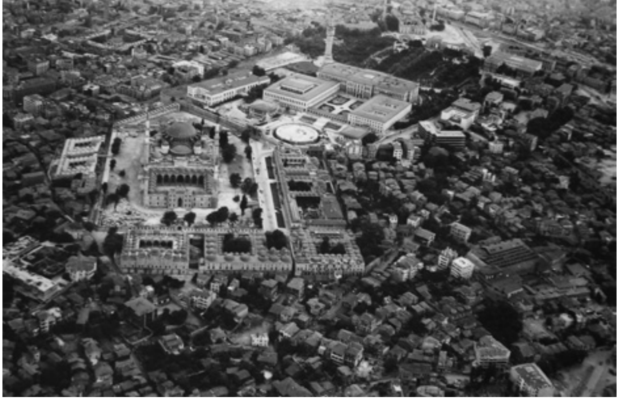
Fotoğraf 9 Eski bir fotoğrafta külliye-Bayezid Meydanı bağlantısı