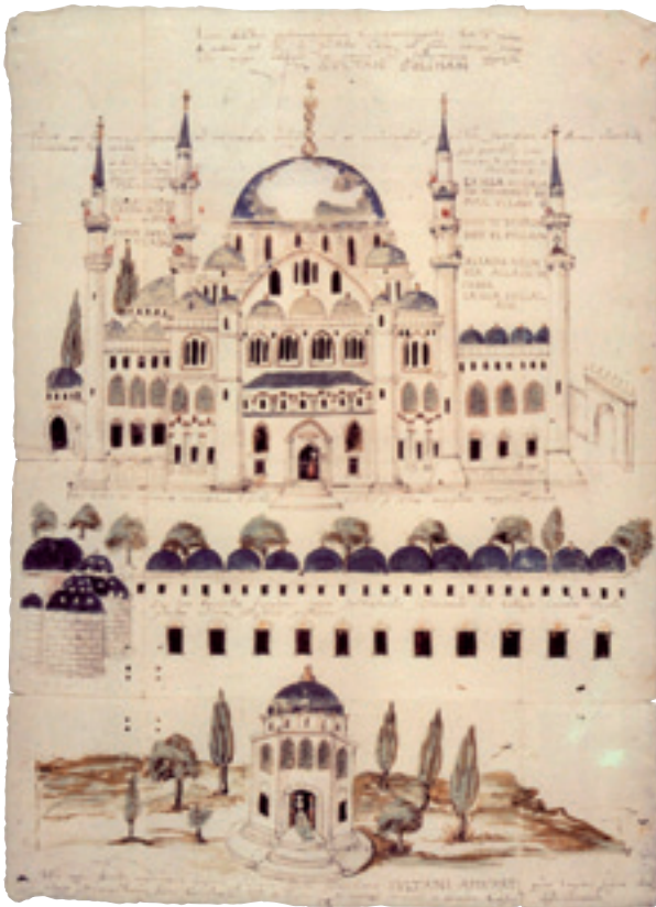
Şekil 15 Süleymaniye Külliyesi'nin betimi (Bodleian)

Külliye, 63,500 m 2 yüzölçümüne yayılmış, kentin tümünün ihtiyaçları göz önüne alınarak inşa edilmiştir. (Akgün 2005: 38). Külliye'nin yerleşeceği alanın batı kısmının çok eğimli oluşu, büyük bir problemken, alanın Haliç, Galata ve Boğaz'a hâkim oluşu iştah artırıcı bir sebepti. İstanbul'un