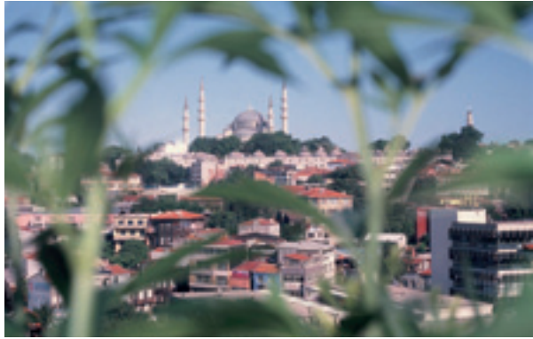
Fotoğraf 10 Süleymaniye Külliyesi'nin Zeyrek'ten görünümü (M.Sav,2001)