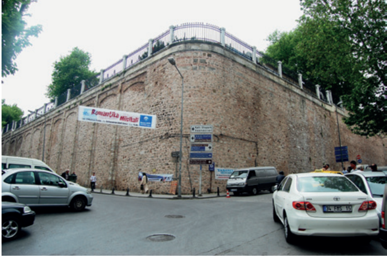
Fotoğraf 6 Eski Saray alanını sınırlayan teras duvarlardan bir görünüm (2011)