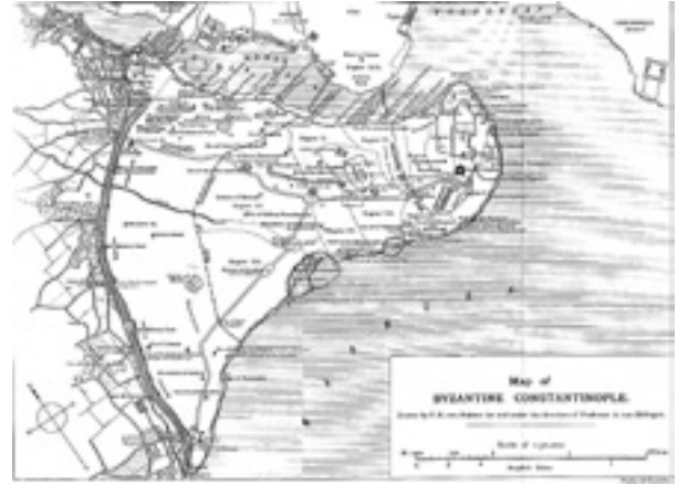
Şekil 2 Bölgeler, yollar ve önemli yapılar (Millingen)

Süleymaniye ve çevresindeki iskânın, tıpkı İstanbul'un diğer elverişli alanlarındaki gibi oldukça erken dönemlerde başladığını, arkeolojik veriler ispatlamaktadır. Çarşıkapı'daki Merzifonlu Kara Mustafa Paşa Türbesi yakınındaki bir