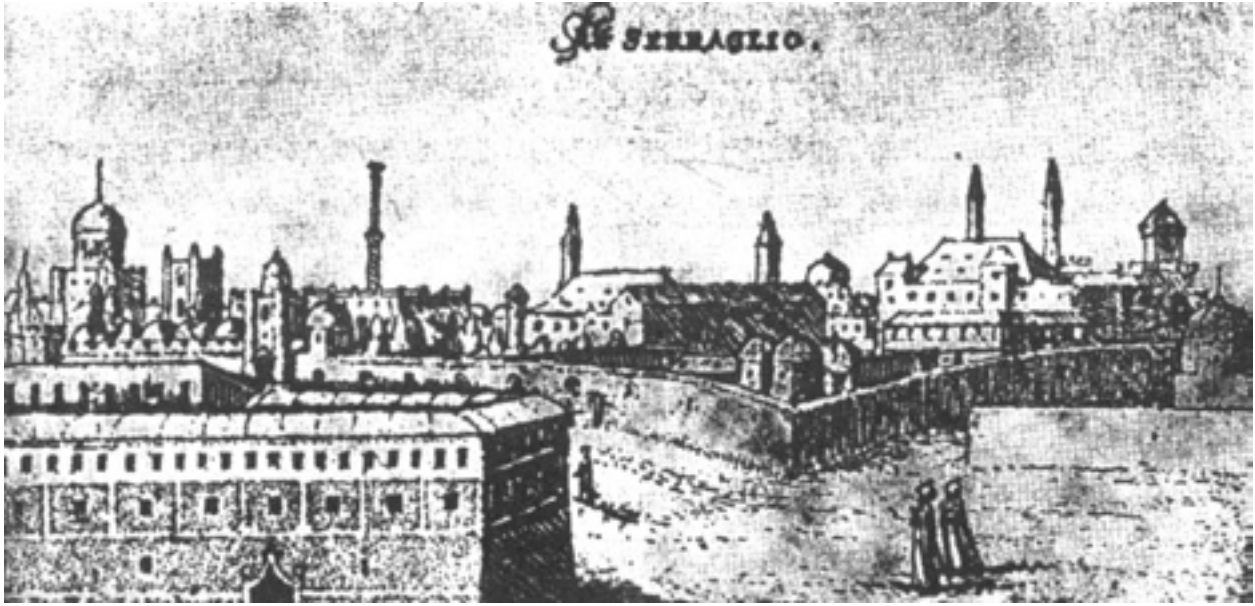
Şekil 4 Dilich tarafından 1560'larda yapılan Eski Saray gravüründe cami-saray bağlantısı

ait hamam ile sarnıç; yakınındaki Akataleptos Ton Diakonissa Kilisesi (Kalenderhane Camii) ile Bizans dönemine ait su maskemi (Süleymaniye su yollarına dahil edilmiştir) Süleymaniye yakınındaki önemli yapılardan bazılarıydı. Vefa ile Şehzadebaşı'nı ayırarak, Bayezid'e kadar çıkan Valens Su Kemeru, Vefa içinde kalan sarnıç, Vefa'daki adı tam tespit edilemeyen Bizans dönemine ait bir kilise yapısı olan Molla Gürâni Camii, Unkapanı yönündeki çok sayıdaki sarnıç ile, Süleymaniye külliyesinden Haliçe doğru inen arazide bulunan bazı Bizans sarnıçları, diğer zenginlikler arasındaydı.