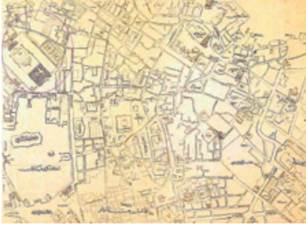
Şekil 6 Süleymaniye Camii ve çevresi (1870-80 yıllarına ait harita)

rahibe barınmaktaydı. (C.I: 118). Her ne kadar Evliya Çelebi burada daha eskiden bir ibadethanenin olduğunu ve bunu da Hz.İsa'nın havarilerinden Simon tarafından yapıldığını söylese de, bu pek mümkün değildir çünkü Simon İstanbul'a gelmemiştir. Havari Andreas'tan bahseden bir söylencede adı geçen havarinin İstanbul'a geldiği, Beyoğlu mezarlığında küçük bir ibadethane yaptığı ve gününü burada dua ederek geçirdiği anlatılmaktadır. Muhtemelen bu öykü ile Simon ve yerler karıştırılmıştır. Simon'a atfedilen bu küçük ibadethanenin yerine ve su kaynağının üzerine sonradan daha büyük bir manastır yapıldığını nakleden Evliya Çelebi, Fatih'in bu manastırı ele geçirince, yerine sarayını yaptırdığını belirtmektedir.