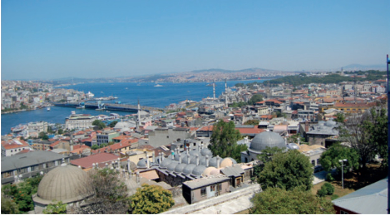
Fotoğraf 7 Süleymaniye'nin minaresinden Haliçe bakiş (Murat Sav,2008)

sağlanmıştır. (Aslanoğlu 1987: 192). Frank Lloyd'un dediği gibi: Yapı, tepenin kendisi olmalı; yeryüzünden dışarıya doğru yükselmeli, büyümeli; öyle ki, arazi nerede bitiyor, yapı nerede başlıyor fark edilmemeli. (Özer 1988: 199).