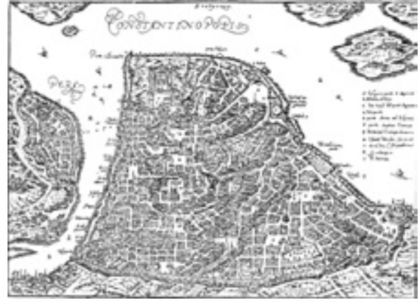
Şekil 7 Dilich tarafından yapılan haritada İstanbul'un yerleşim düzeni (1556)

1550-1556 (H.957-964) yıllarında yapılan Süleymaniye Camiinin muhteşem sütunlarının her birinin ayrı bir hikâyesi vardır ve tıpkı Ayasofya'da olduğu gibi hepsi devşirme olup, farklı yerlerden getirilmişlerdir. Troia kalıntılarının arasından getirilen sütunun yanı sıra Gyllius, V.Tepenin üstünde yükselen ve Korent başlığı taşıyan bir mermer sütunun da Süleymaniye Camiinin inşaatında kullanılmak üzere taşındığını gördüğünü yazmaktadır.