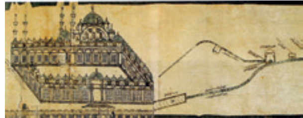
Şekil 13 Süleymaniye suyolu haritası (XVIII. yüzyılın ikinci yarısı, Engin Yenil'dan)