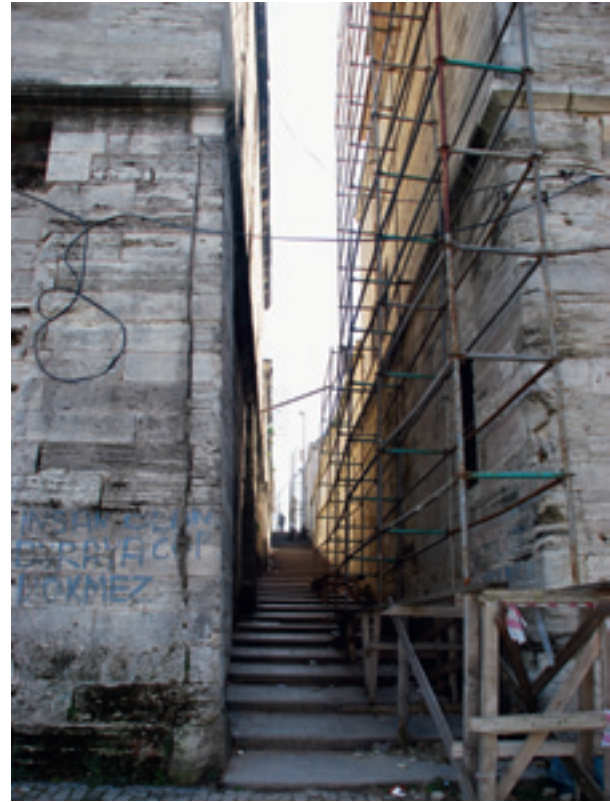
Fotoğraf 11 Dariüşşifa ve tabhane arası ve dariüşşifanın Haliç cephesi