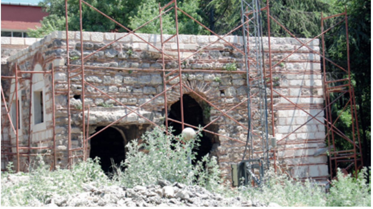
Fotoğraf 3 İstanbul Üniversitesi Su Ürünleri binasının arkasındaki avluda bulunan yapı kalıntısı