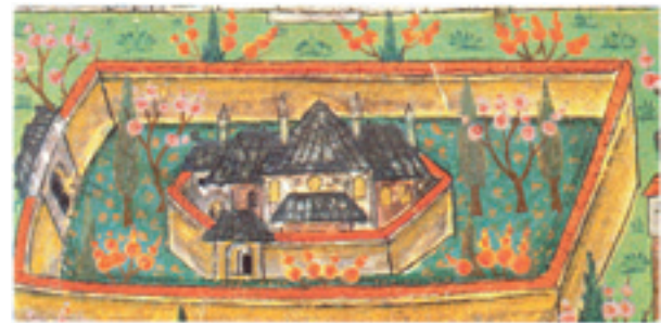
Şekil 12 Matrakçı Nasuh'un İstanbul tasvirinde Eski Saray