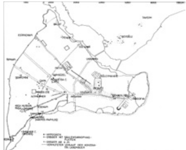
Şekil 3 Nekropol alanlarını gösteren harita (M. Wiener)

temel kazısında bulunan ve Geç Kalkolitik Çağın uzantısına (M.Ö. II. binyıl) tarihlenen pişmiş toprak testi parçası bunu kanıtlamaktadır. (Fıratlı 1958: 29-30; Fıratlı 1978: 572,fig. III.5; Dönmez 2004: 44).