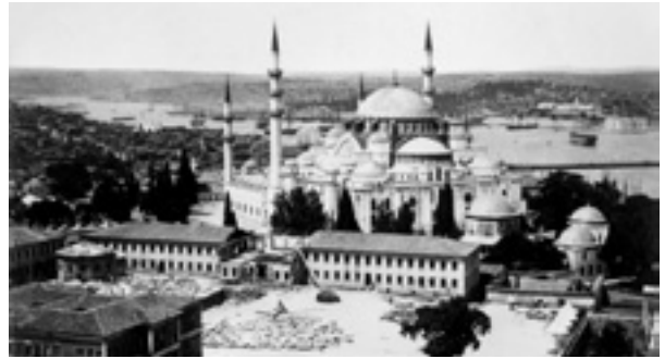
Fotoğraf 15 Süleymaniye Camii ve arka planda Haliç'in kuzey kesimi (II. Abdülhamid Albümü)

2007: 277). Süleymaniye Camii'ne bakan cephesi ile kuzey-batıya bakan cephesinde altta dehlizler, ahırlar ve ikâmet mekânları bulunmaktadır.