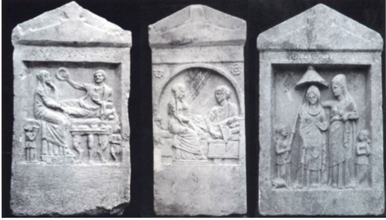
Fotoğraf 1 Bayezid-Süleymaniye arasında bulunan mezar stellerine örnekler (N.Fıratlı'dan)

Kimi araştırmacıların İstanbul'un Lygos 1 adıyla kurulduğu yerin Süleymaniye olduğunu iddia etmeleri, gerçeği iskalamakla eşdeğerdir. Bir derenin çevresinde kurulduğu bilinen Lygos için Süleymaniye'de dere olabilecek bir oluşum görülmemektedir. Kaldı ki, bu yönde bir arkeolojik keşif yapılmamıştır. Klasik dönem mezarlığının da Süleymaniye'ye kadar uzanmış oluşu, bu düşünceyi dayanaksız bırakmaktadır. (Ertuğrul 2010: 52).