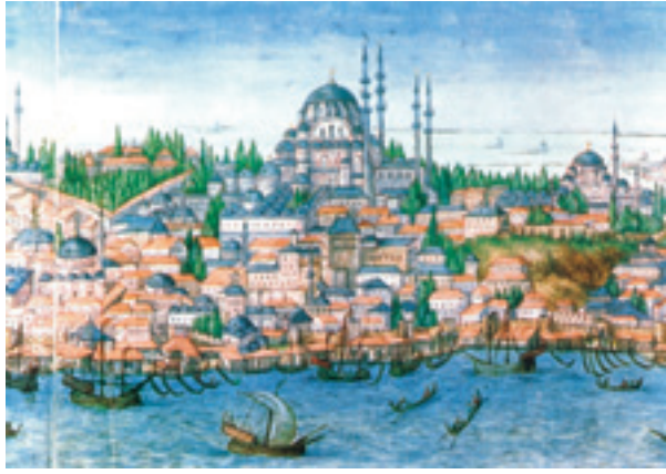
Şekil 9 Süleymaniye, Viyana Österreichische Nationalbibliothek (Cod.8626)