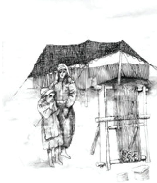
Çizim 1: Karaçadır / Kılçadır (Çizim: Aydın Uğurlu)

Göçebe kültürü sözeldir. Bu konudaki yazılar ise göçebeler tarafından yazılmadığı gibi yerleşik olan ve yabancılar tarafından ön yargılı olarak yazılmıştır. Bu nedenle göçebeler hakkındaki yazılarda onların kültürleri, töre, aşık, öykü ve destanlarından çok az ya da yüzeysel olarak bahsedilmiştir.