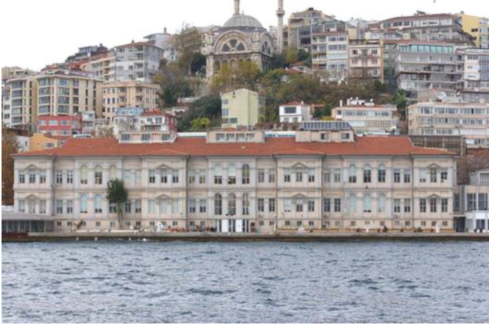
Fotoğraf 3: Mimar Sinan Güzel Sanatlar Üniversitesi / İstanbul Devlet Güzel Sanatlar Akademisi http://www.arkhesanat.com/dosyalar/2016/10/Mimar-Sinan-Üniversitesi.jpg , 17.07.2017.