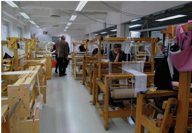
Fotoğraf 11: Helsinki, Alto Güzel Sanatlar Akademisi, Dokuma Atölyesi

Bugünkü anlamda ilk akademi, 1459'da Floransa'da açılmış, bunu Paris ve Nürnberg güzel sanatlar akademileri takip etmiş, Avrupa'daki akademiler çoğalırken sanatçı loncaları azalmış, akademilerdeki sanat eğitimine karşı olanlar çoğalmıştır. (Fotoğraf 11, Fotoğraf 12)