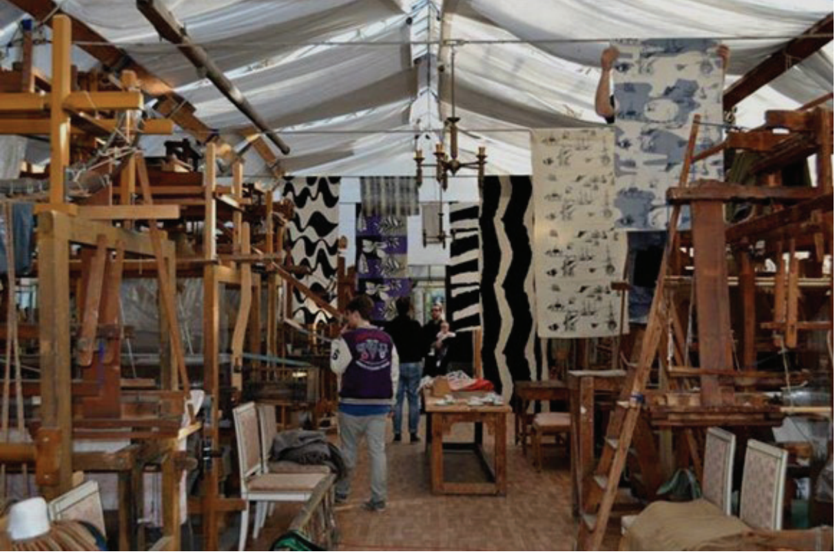
Fotoğraf 12: Polonya, Lodz Güzel Sanatlar Akademisi, Dokuma Atölyesi

“Sanatçının temel kaynağı doğadır.”, “Okullar insana bir şey öğretmez”, “Sanatçılar entelektüel bilgi sahibi olmalı.” gibi görüşler, sanatçıları ve sanat eğitimini yeni arayışlara yöneltmiştir. Sanat eğitiminde “Bauhaus” olarak bilinen yöntem, Almanya’da geliştirilmiş, akademik güzel sanatlar eğitimi ile zanaat eğitimi birleştirilmiştir.