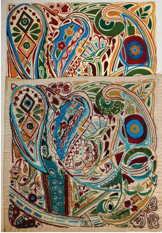
Fotoğraf 5: İşleme tasarım ve uygulaması, Yasemin ACAR KARA Öğrenci Çalışması, (Aydın Uğurlu Arşivi, 2000)

Anasanat dalında halı, kilim gibi kirkitli dokumaların yanı sıra halk ve saray mekikli el dokumacılığı ilginç örnekleri ile geleneksel tekstillerin çeşitli tekniklerinin belgeleme ve uygulama çalışmaları yapılmış, öğrenciler alan araştırmasına yönlendirilmiş, ayrıca geleneksel örneklerden ilham alınarak günümüze uyarlanması yapılmıştır. (Fotoğraf 5, Fotoğraf 6, Fotoğraf 7, Fotoğraf 8, Fotoğraf 9) Ödev kapsamında yapılan öğrenci işlerinden seçim yapılarak eğitim yanında ilgililerin değerlendirmesine sunulmak üzere yurtiçi ve yurtdışında bir çok karma öğrenci sergileri ile sergilenmiştir. Bu anasanat dalı, ülkemizde yeni hizmete başlayan üniversitelerin güzel sanatlar fakültelerinde çeşitli isimler altında açılmasına örnek olmuştur. Bunun peşi sıra güzel sanatlar fakültelerinin tekstil ve moda bölümlerinde de geleneksel dokumalara ilgi artmıştır.