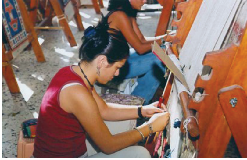
Fotoğraf 10: Çanakkale Onsekiz Mart Üniversitesi, Ayvacık Meslek Yüksekokulu, Halıcılık ve Desinatörlüğü Programı, Dokuma Atölyesi