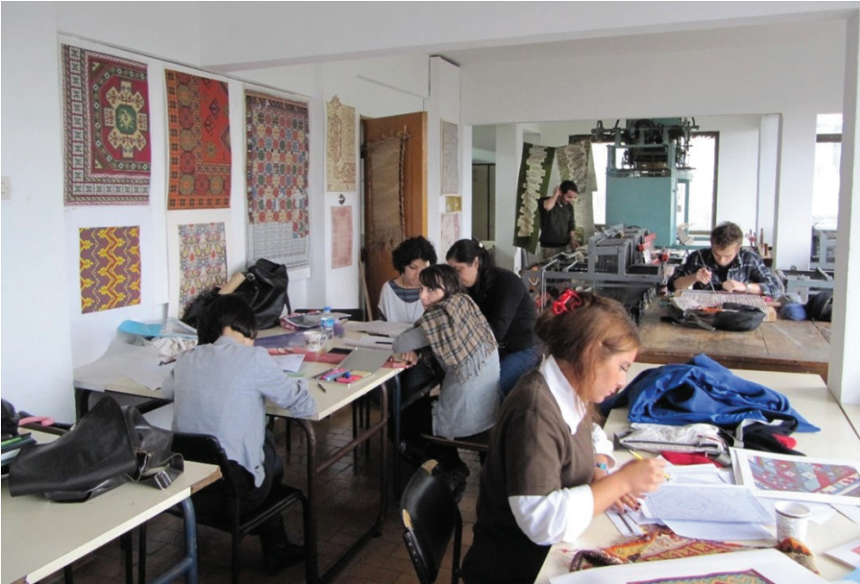
Fotoğraf 4: Mimar Sinan Güzel Sanatlar Üniversitesi, Güzel Sanatlar Fakültesi, Geleneksel Türk Sanatları Bölümü, Halı-Kilim ve Eski Kumaş Desenleri Anasanat Dalı