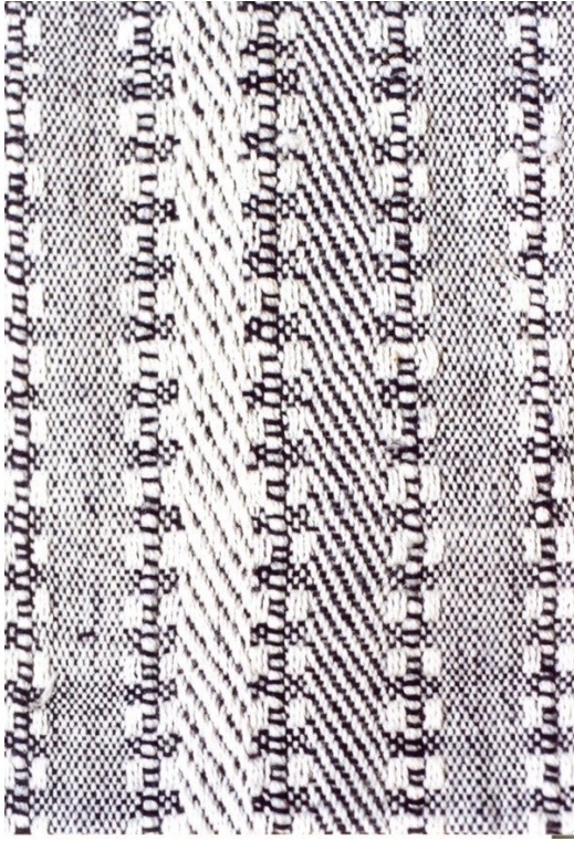
Fotoğraf 8: Mekikli Dokuma Uygulaması, Servet Senem BAŞARIR Öğrenci Çalışması, (Aydın Uğurlu Arşivi, 1998)