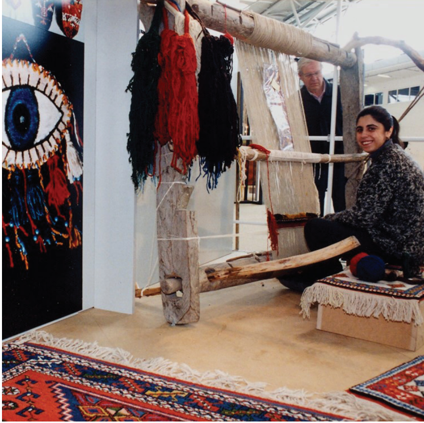
Fotoğraf 14: Almanya, Münih EXEMPLA'99 Yapısal Bağlantılar Sergisi ve Çalıştayı

mizdir. Öncelikle kültürümüzü ve geleneksel el dokumacılığının topluma tanıtılması amacıyla yerel ve ulusal müzelerin çeşitlendirilmesi gerekmektedir. Bu alanda eğitim veren akademisyenlerin bilgilerini güncellemeleri şarttır. Yeni bir şey yapabilmek için, öncelikle eski geleneksel değerlerin bilincinde olmak, yeni gelişmeleri sanatsal açıdan kavrayabilecek ve sanatsal olaylarını takip edebilecek düzeyde yetişmiş olmak gerekir. (Fotoğraf 14) Yalnızca teknik ve kazanç hırsıyla değil geçmişimizde olduğu gibi sanatsal alanda örnek oluşturacak çalışmalara ağırlık verilmelidir. Ülkemizdeki gelişmiş tekstil sanayi sektörü, yenilikler için kaynak olarak ulusal-uluslararası sergilerden yararlanmalı ve ürünlerini ulusal kimlik kaygısıyla oluşturmalıdır.