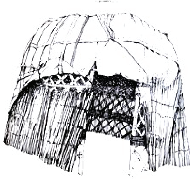
Çizim 2: Topak Ev / Yurt (Çizim: Aydın Uğurlu)

Ayrıca göçebe yaşam tarzında tarım yapma şansı azaldığı için, hayvansal ürünler ağırlık kazanmaktadır. Hayvansal ürünler; et, süt, peynir, ayran gibi hayati gıdalar olmasının yanı sıra post, kürk, deri, yün, kıl gibi dokumacılığı oluşturan temel maddelerdir. Yaşam alanları olarak, keçe ve dokusal yüzeylerden oluşturulmuş Topak Ev/Yurt, Otağ, Karaçadır/Kılçadır ve Alaçık onlar için önemlidir.