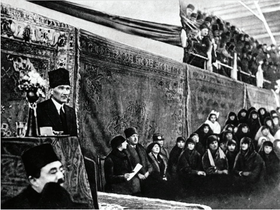
Fotoğraf 13: Atatürk İzmir İktisat Kongresindeki açılış konuşması, 17 Şubat 1923, İzmir

“Halkımızın çoğunluğu çiftçidir, çobandır. Bundan dolayı en büyük kuvveti, kudreti bu alanda gösterebiliriz ve bu alanda önemli yarış meydanlarına atılabiliriz. Fakat aynı zamanda sanatımızı da artırmak ve genişletmek zorundayız. Eğer sanat konusunda yine hoşgörülü olursak o halde sanayi eserlerinde yine dışarıya haraç verici oluruz.” 14 (Fotoğraf 13)