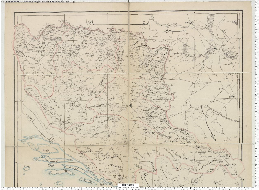
Ek 3. Klek Limanı'nu gösteren Bosna Vilayeti'nin haritası.