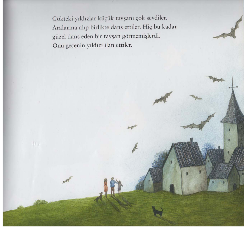
Resim 4.3: Ay Ne Zaman Gelecek kitabından bir resim.

Kitaplarda kullandığı hayvan karakterleri Tablo 4.2’de detaylı olarak görülmektedir.