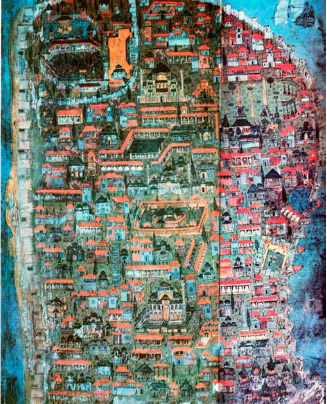
Fotoğraf 1. Matrakçı Nasuh'un minyatür tekniği ile yapılmış İstanbul planında İlk Fatih Camii (1537).

merler ve sarnıçlar inşa ettirilmiştir. İmparator Valentianus tarafından Valens Kemer (Bozdoğan), I.Theodisius zamanında da şehir batıya doğru geliştikçe şimdiki Bayezid Meydanı'nda ve ana yol mese üzerinde, dış yüzeyleri bitki kabartmalı büyük Zafer Takı inşa edilmişti.