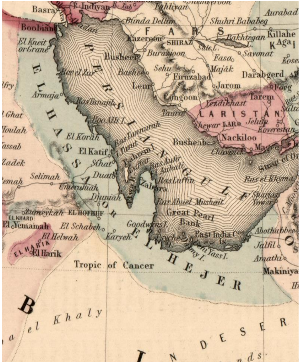
EK- 1 Basra Körfezi ve Ahse'yı Gösteren Harita