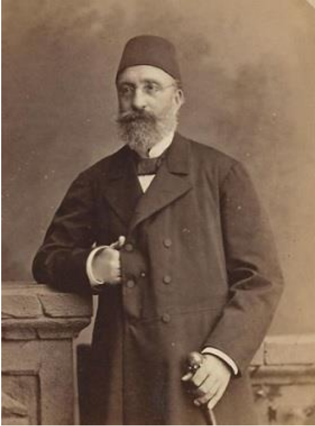
EK- 2 Midhat Paşa'nın Portresi