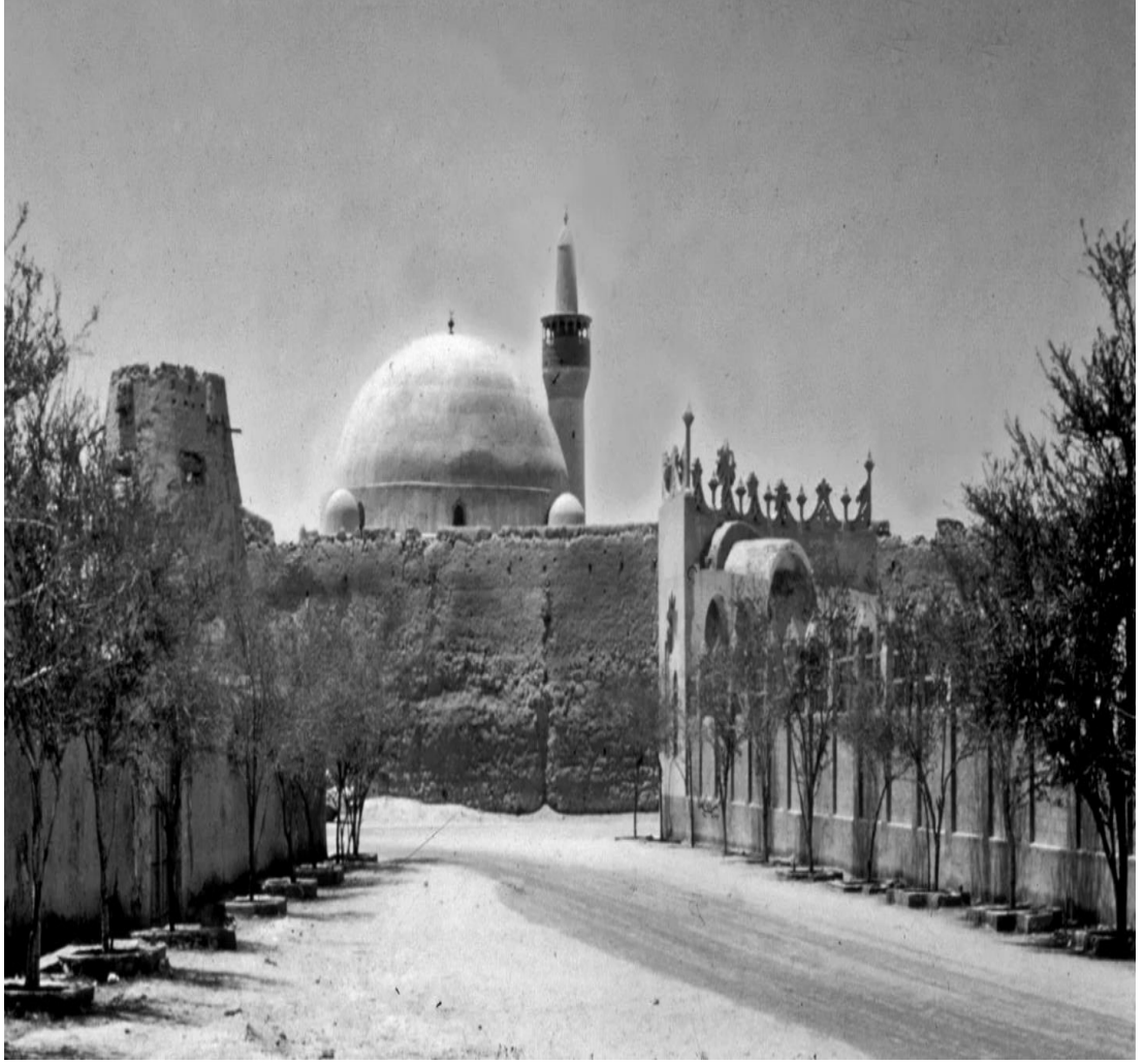
EK- 3 Hufuf Nahiyesi İbrahim Paşa Camii