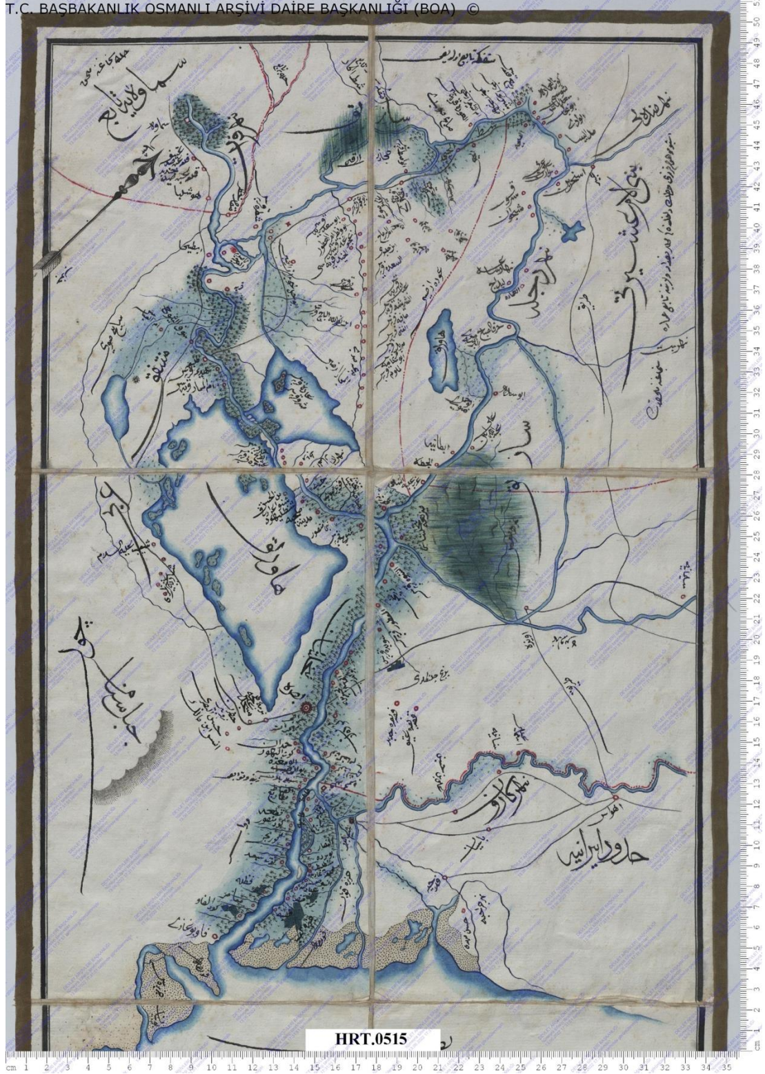
EK- 4 Basra Vilayetine Ait Harita. Şattü'l Arab ve Bahreyn Denzi Kıyısındaki Yerleşim Yerleri. H. 29-12-1295.