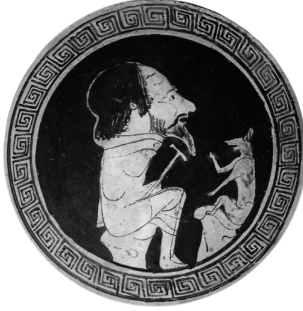
Resim 1: Aisopos'a dair yapılan bir çizim.

https://www.britannica.com/biography/Aesop [Erişim Tarihi: 25.10.2022]