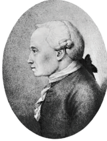
Resim 5: Kant'ı tasvir eden bir çizim.

https://www.britannica.com/biography/Immanuel-Kant [Erişim Tarihi: 25.10.2022]