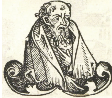
Resim 3: Empedokles'e dair yapılan bir çizim.

Rû'ya kitabında ise Empedokles, bir nevi kolsuz palto veya pelerin anlamına gelen harmani giymiş olarak tarif edilir. 51 Empedokles'in bu giyim şeklini, hakkında yapılan bir çizimde de görmek mümkündür: