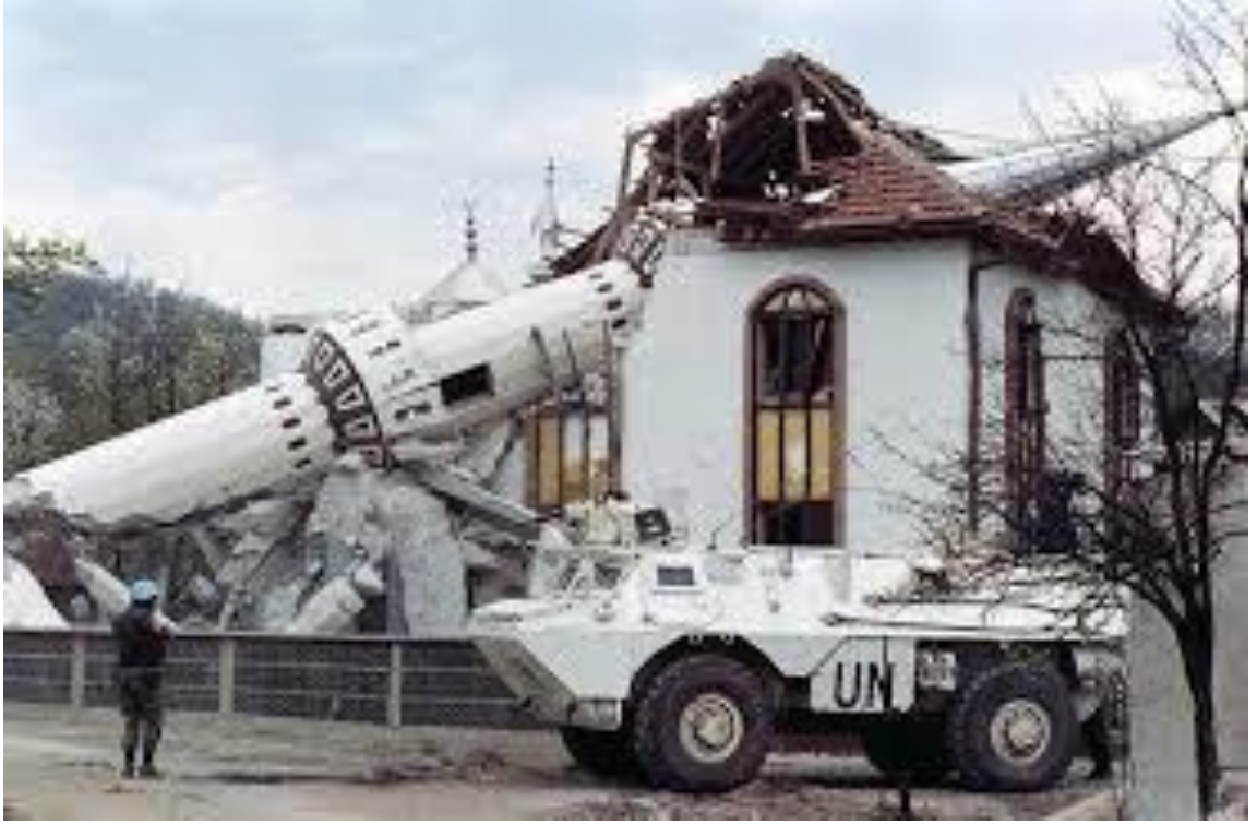
“Memorial Center Srebrenica” görselleri: