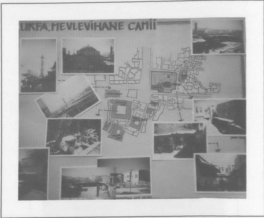
Mevlevihane Camii - Survey.