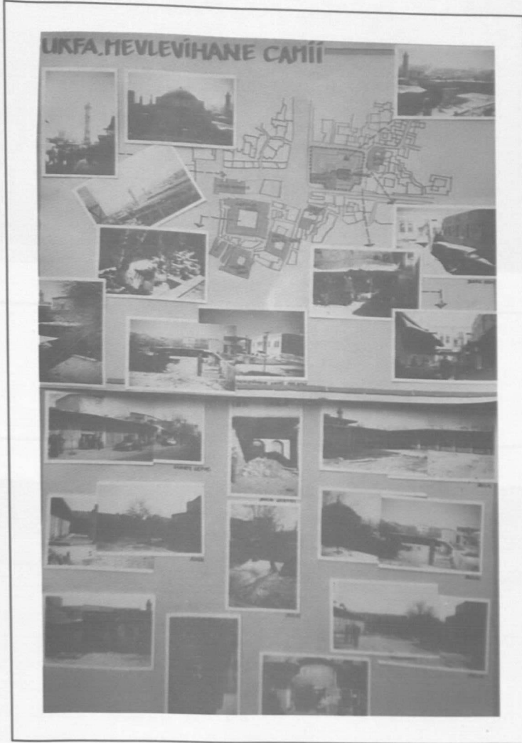
Mevlevihane Camii - Survey.