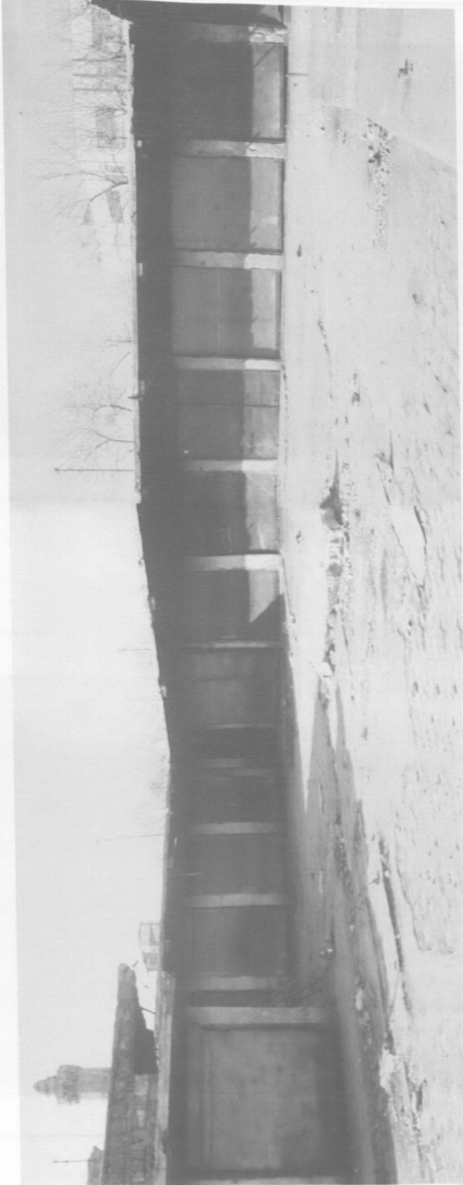
Mevvehane Camii Aylusu.