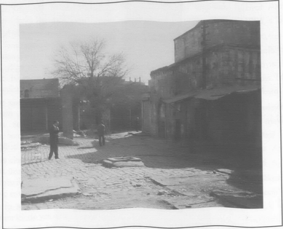
Mevlevihane Camii ve Avlusu.