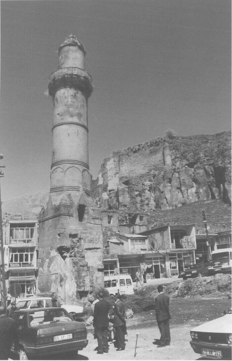
Res. 2: Merkez Meydan Camii minare güneydoğu genel görünüşü.