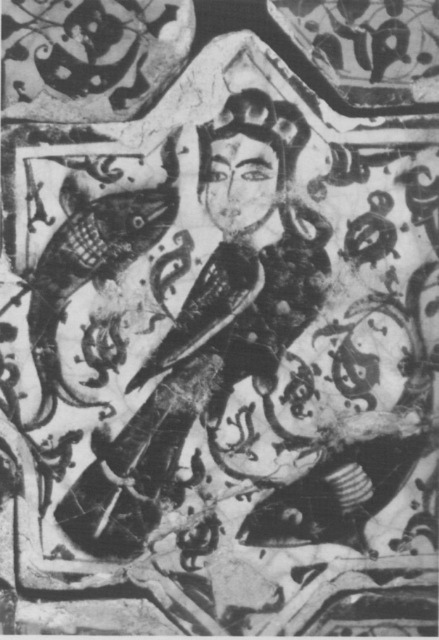
Fot.14 Harpi Motifi (Anonim: s.125, 2001).