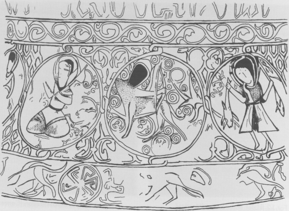
Çiz.3 (Akrep, Yay, Oğlak burçları) (Köksal Özköklü-2007).