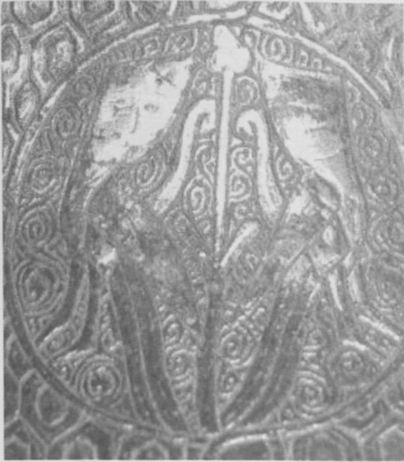
Fot.12 İkizler Burcu-Mayıs (Mercury).