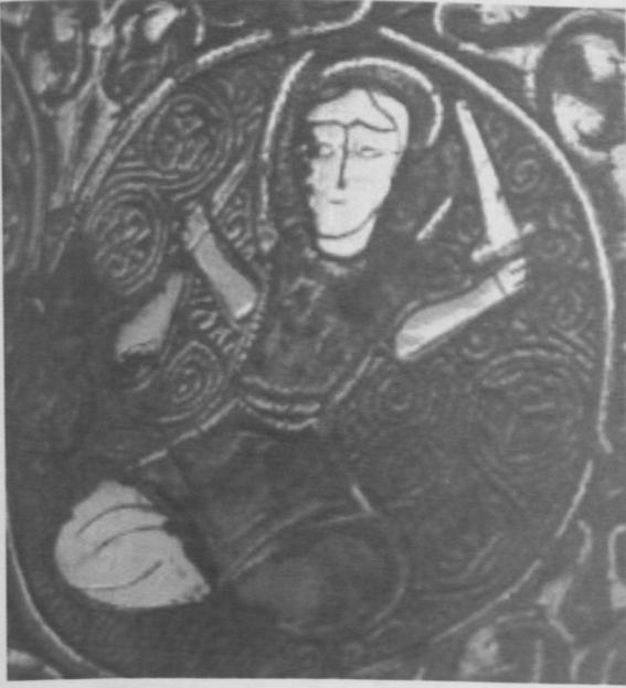
Fot.10 Koç Burcu-Mart (Mars).