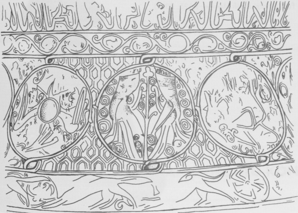
Çiz.5 (Boğa, İkizler, Yengeç burçları) (Köksal Özköklü-2007)