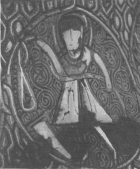
Fot.8 Kova Burcu-Ocak (Aquarius).