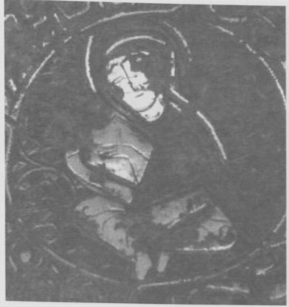
Fot.3 Başak Burcu (Mercury).