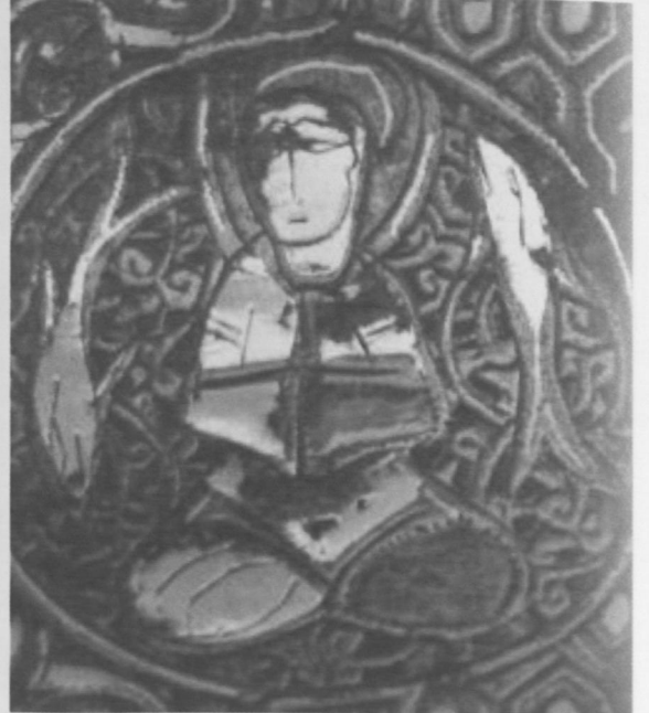
Fot.9 Balık Burcu-Şubat (Pisces).