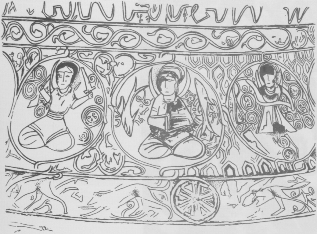
Çiz.4 (Kova, Balık, Koç burçları) (Köksal Özköklü-2007)