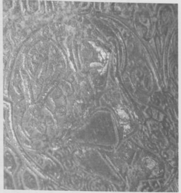
Fot.11 Boğa Burcu-Nisan (Venüs).