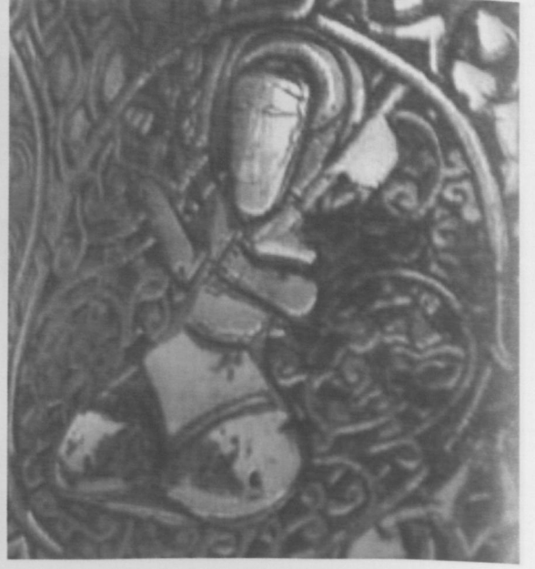
Fot.7 Oğlak Burcu-Aralık (Saturn).