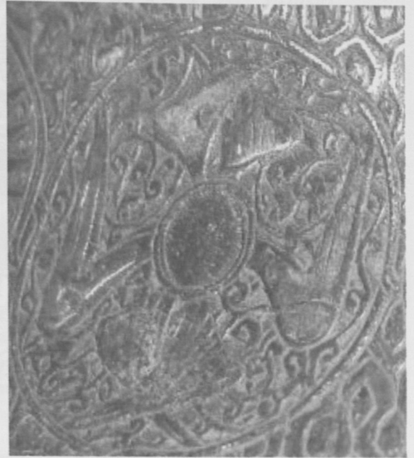
Fot.13 Yengeç Burcu-Haziran (Cancer).