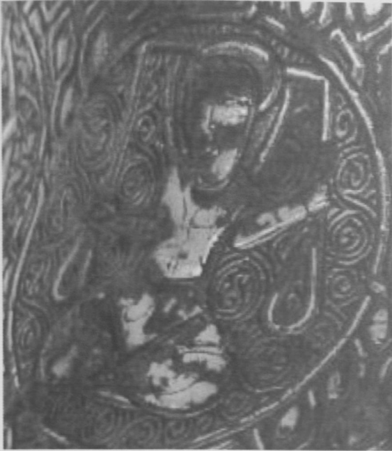
Fot.4 Terazi Burcu (Libra).