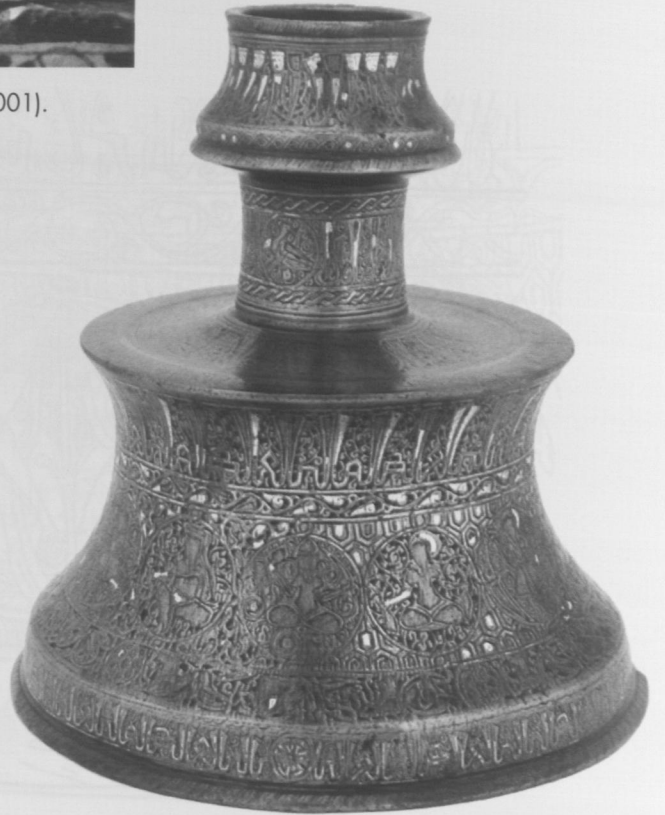
Fot.15 Freer Gallery'deki Şamdan (A.Çaycı:2002).