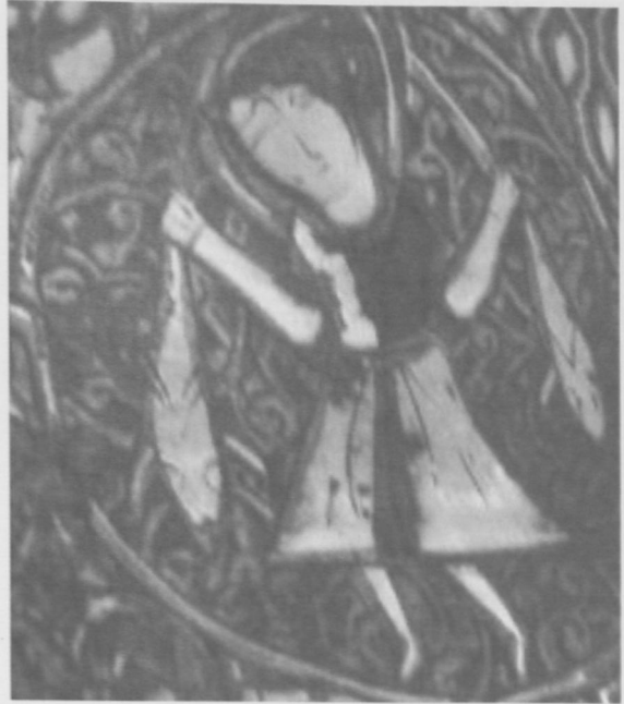
Fot.5 Akrep Burcu-Ekim (Scorpio).