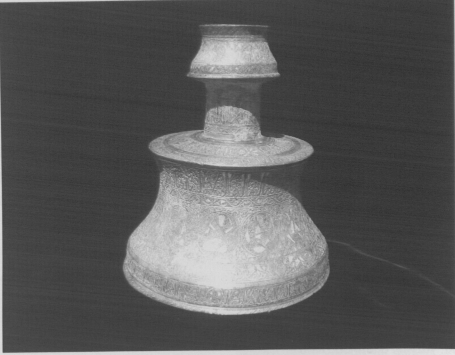
Fot.1 Şamdanın Genel Görünüşü.