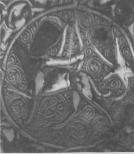
Fot.6 Yay Burcu-Kasım (Sagittarius).