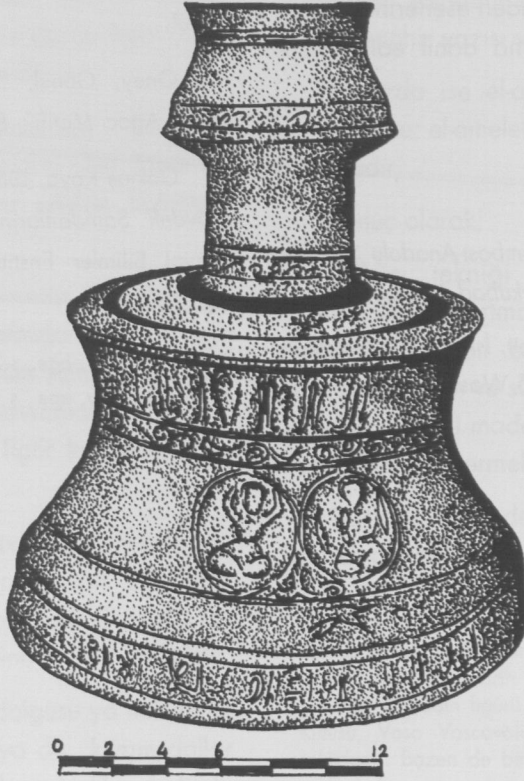
Çiz.1 Şamdanın Genel Görünüşü (Köksal Özköklü-2007)