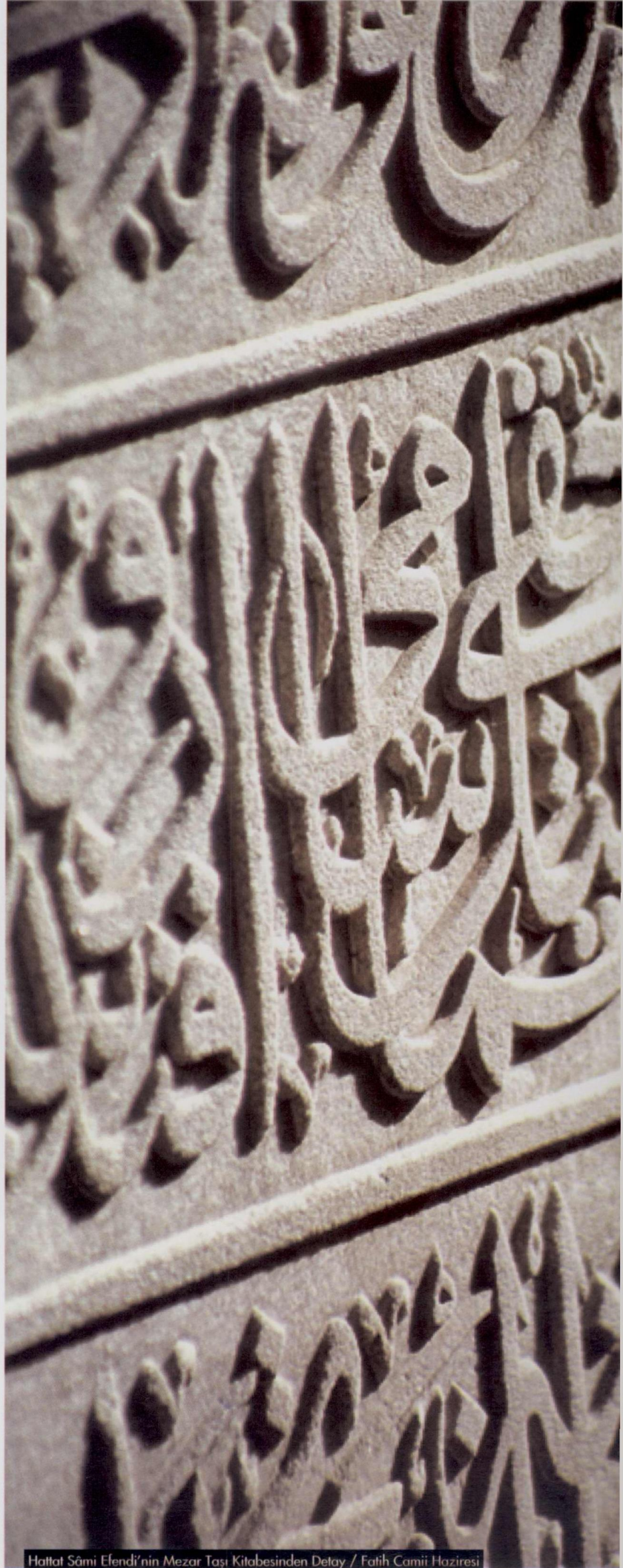
Hattat Sâmî Efendi'nin Mezar Taşı Kitabesinden Detay / Fatih Camii Haziresi

Bu vakıf, Medine'deki Ensâr'a mensup sahâbenin en zenginlerinden Ebu Talha (ö. 34/654) tarafından, 3/625 yılında Medine'de kurulmuştur. Sevilen şeylerden infak etmeyi emreden Ali İmran, 3/92 âyeti inince, Hız. Muhammed'e (s.a.) gitti. "Rabbimiz bizden, mallarımızı kendi yolunda harcamamızı