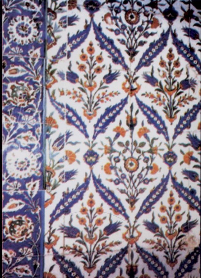
Edirne Selimiye Camii