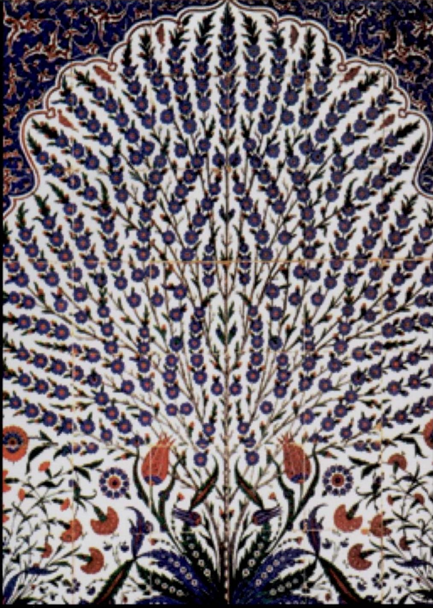
Ayasofya Camii, I Mahmud Kütüphanesi. 16 y.y