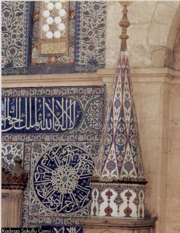
Kadirga Sokullu Camii

Sâhip olduğu inanç ve îman akîdelerine uyarak hayatına taşıdığı, kul hakkı, helâl, haram kavramları ve adâlet anlayışı ile himâyesi altına aldığı ülkelere yardım elini uzatırken, başarılarında önemli payı bulunan kurumlardan biri de vakıf