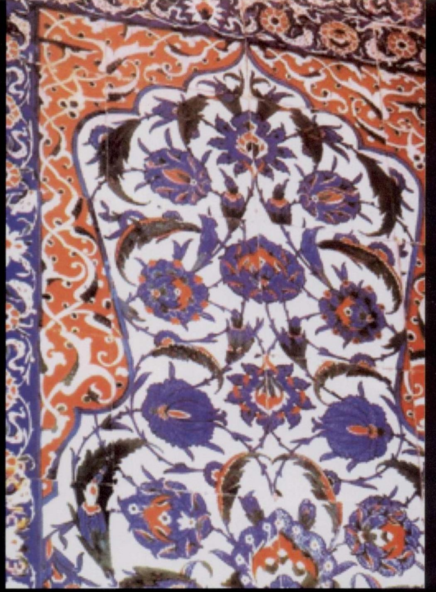
Topkapı Takkeci Camii

sıkı kültür alışverişi içindeyken, İslâmiyet ile tanışıp bu inanç sistemini benimsedikten sonra kültür dünyalarında yeni ufuklar açılmıştır. Daha sonra Abbasiler'le, mânevî ve târihî bakımdan yolları çakışan Türkler, bilhassa Halife Me'mun ve kardeşi Mu'tasim(833) zamanında, Bağdat ve Samerra şehirlerinde söz sâhibi olmuş, İslâmî san'at üslûbunun oluşmasında önemli rol oynamışlardır.