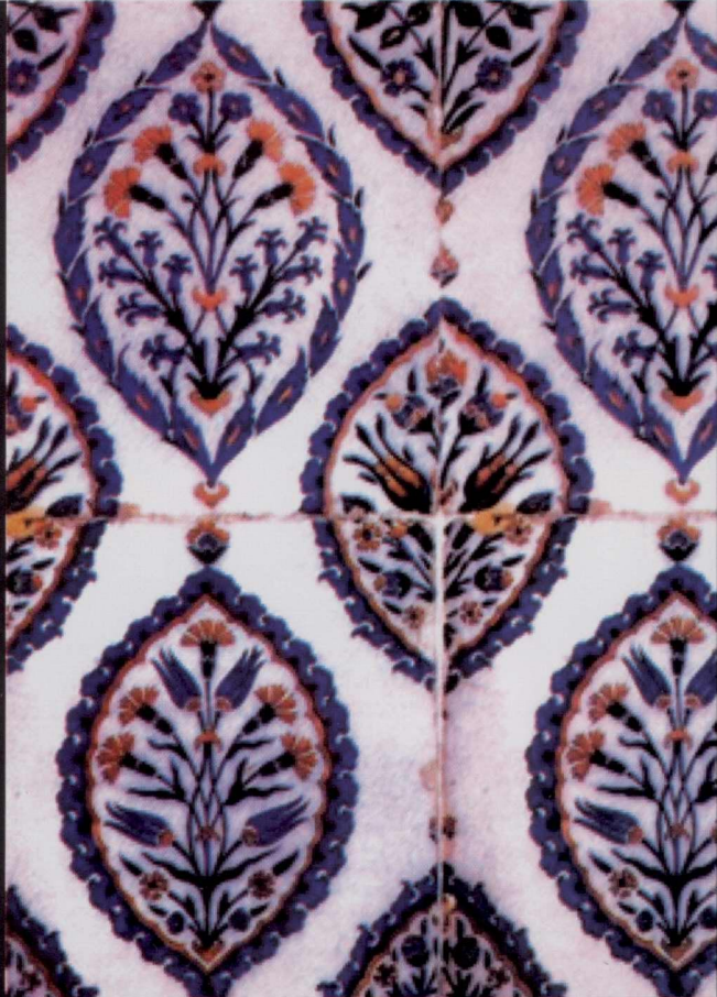
Kismen Simetri Ulama Çini / TopkapıTakyeci Camii

teşkilâtının iyi bilinmesine, devletin ekonomik ve sosyal hayatında düzenin sağlanması için alt yapıyı hazırlayan Türk vakıf sisteminin yeniden ele alınarak araştırılmasına ve özü korunarak, günümüz şartlarında hayata getirilmesine ihtiyaç duyulmaktadır. Böylece bugün toplumu rahatsız eden pek çok meselenin çözümünün, kendi tarihimizin derinliklerinde saklı bulunduğunu ve gün ışığına çıkarılmayı beklediğini fark etmeliyiz.