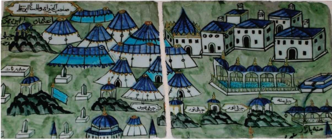
Cebel-i Mina: Mina Dağı Cebel-i Sevr: Sevr Dağı Cebel-i Nur: Nur Dağı Mina Pazar-ı Amr: Mina'da Amr Pazarı