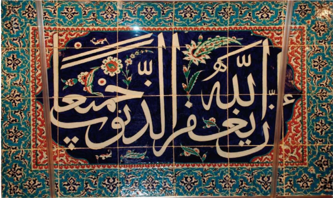
1 " Ey nefislerine karşı giden kullarım" yazılıdır.(Zümer Suresi 53. Ayet)

Dikdörtgen çini panonun ortasında lacivert zemin üzerine beyaz renkle İnnellahe yağfuruzünübe cemiy'a yazılıdır. 1 Yazıların arasında hatai ve hançer yaprakları tarzında bitkisel motifler görülmektedir. Bu motiflerde domates kırmızısı, yeşil ve beyaz renkler hâkimdir. Bu bölüm firuze renkli, ince bir kartuş ile çevrelenmiş olup kartuşun köşelerinde beyaz zemin üzerine domates kırmızısı ve lacivert rengin baskın olduğu, rumilerden oluşan bitkisel bir bezeme yer almaktadır. Kartuşlu bölüm yine ince bir bordür ile çevrelenmektedir. İnce bordürün beyaz zeminini kırmızı çin bulutu motifi doldurmuştur. En dışta yer alan turkuaz zeminli kalın bordürün içinde ise kıvrık dallar arasında palmet ve rumilerden oluşan bitkisel bezeme mevcuttur. Buradaki motiflerde lacivert, beyaz ve domates kırmızısı renkleri tercih edilmiştir.