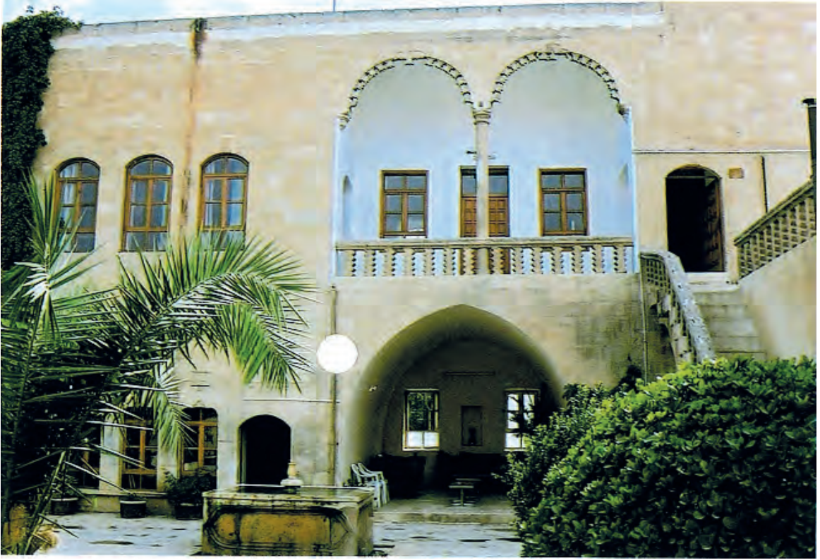
Sakıp Efendi'nin Halepli bahçedeki köşkü