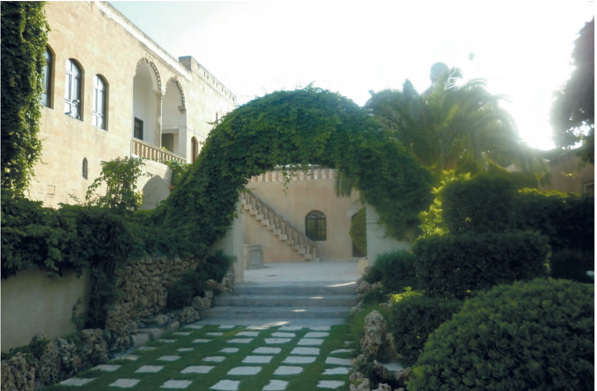
Sakıp Efendi Köşkü'nün giriş kapısı