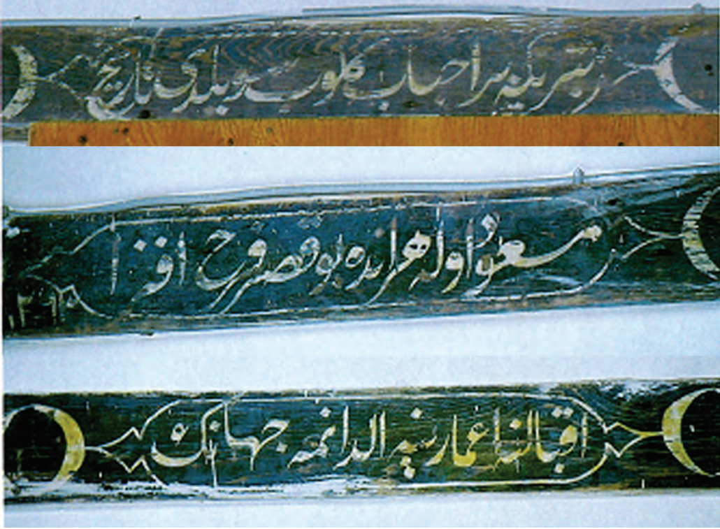
Sakıp Efendi Köşkündeki yazılı gazel