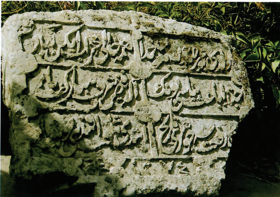
Sakıp Efendi Köşkünde bulunan kitabe