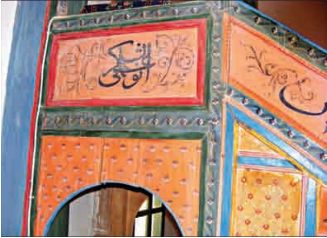
Resim 8: Râşid Halifelerin İsimlerinin Tek Bir Kelimede Yazılmış Şekli.