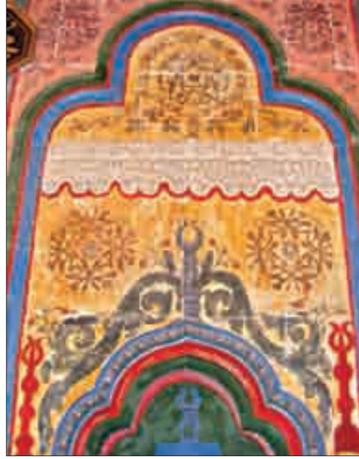
Resim 6: Mihraptan Detay.