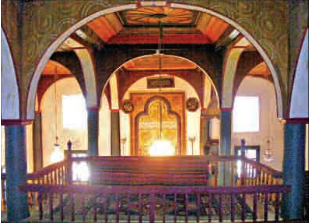
Resim 12: Mahfilden Harimin Görünümü.