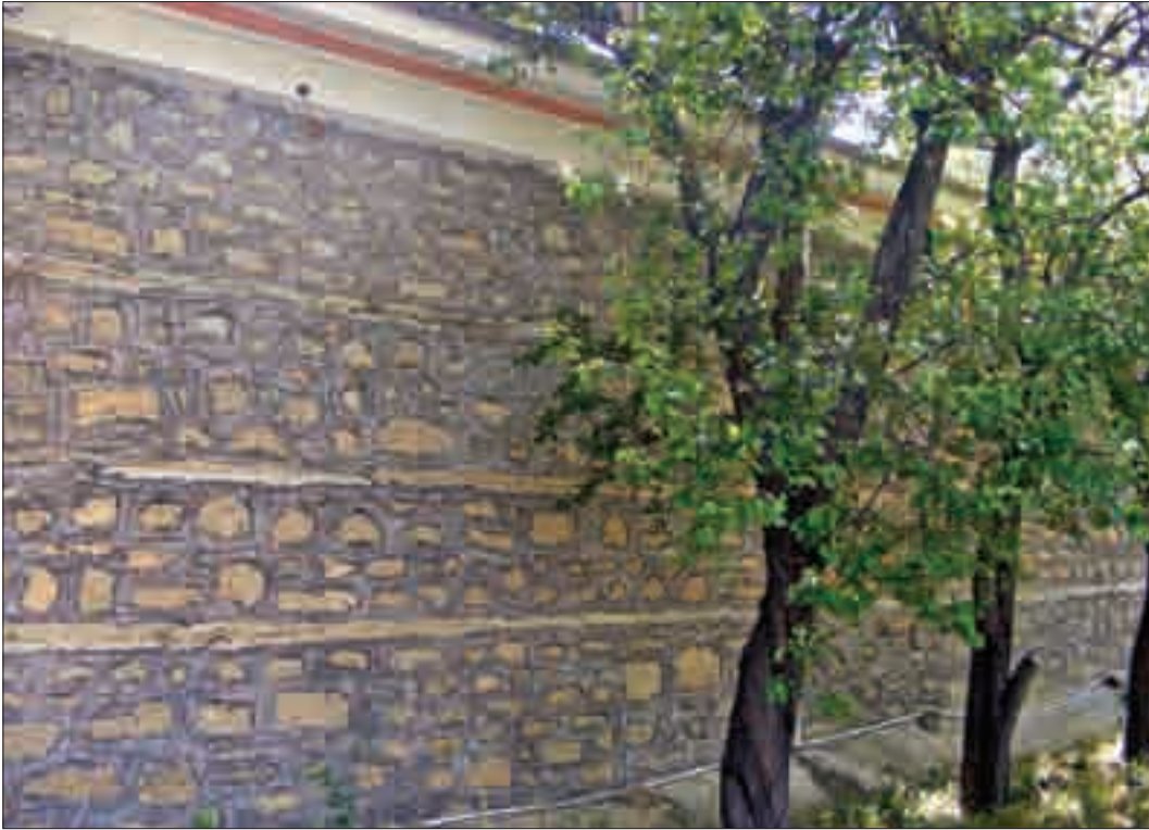
Resim 3: Bektaş Bey Camii'nin Batı Cephesi.