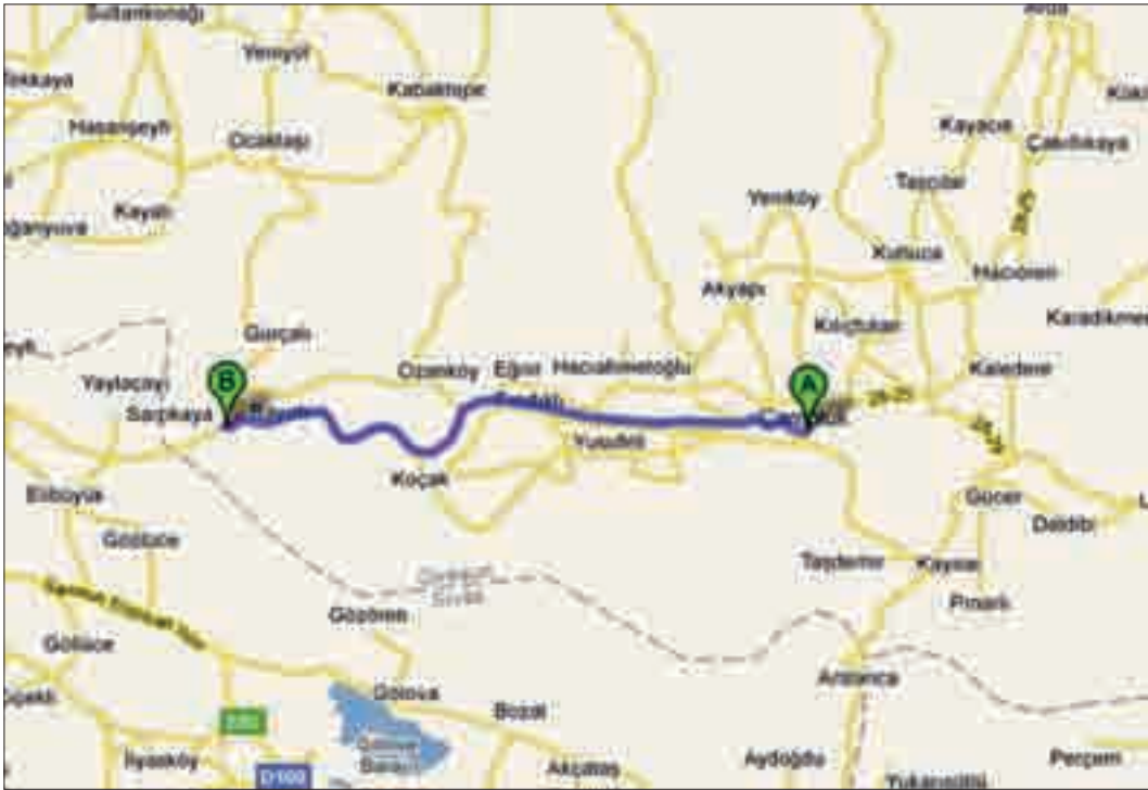
Harita 1: Google Maps'ten Giresun/Çamoluk ilçesi Sarpkaya Köyü.