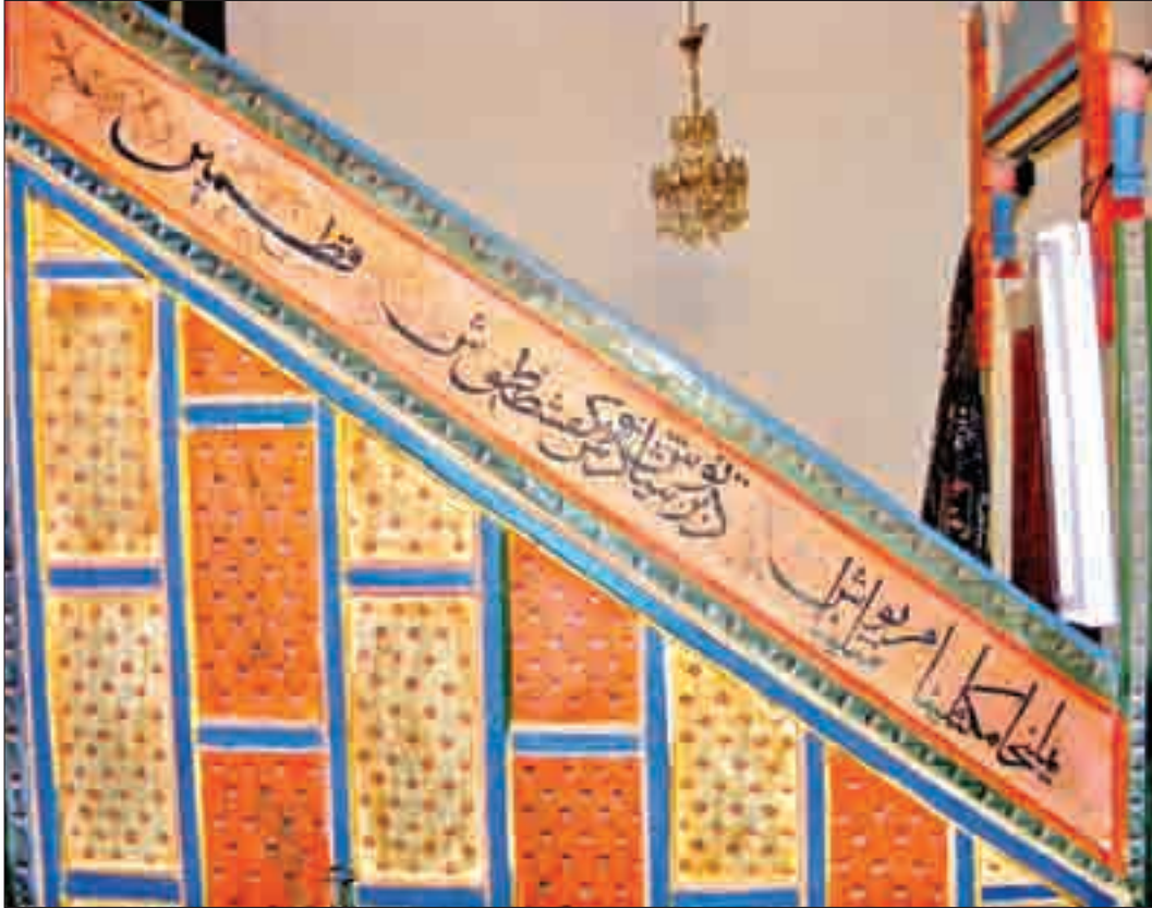
Resim 7: Minber Korkuluklarındaki Ashab-ı Keyhf'in İsimleri.