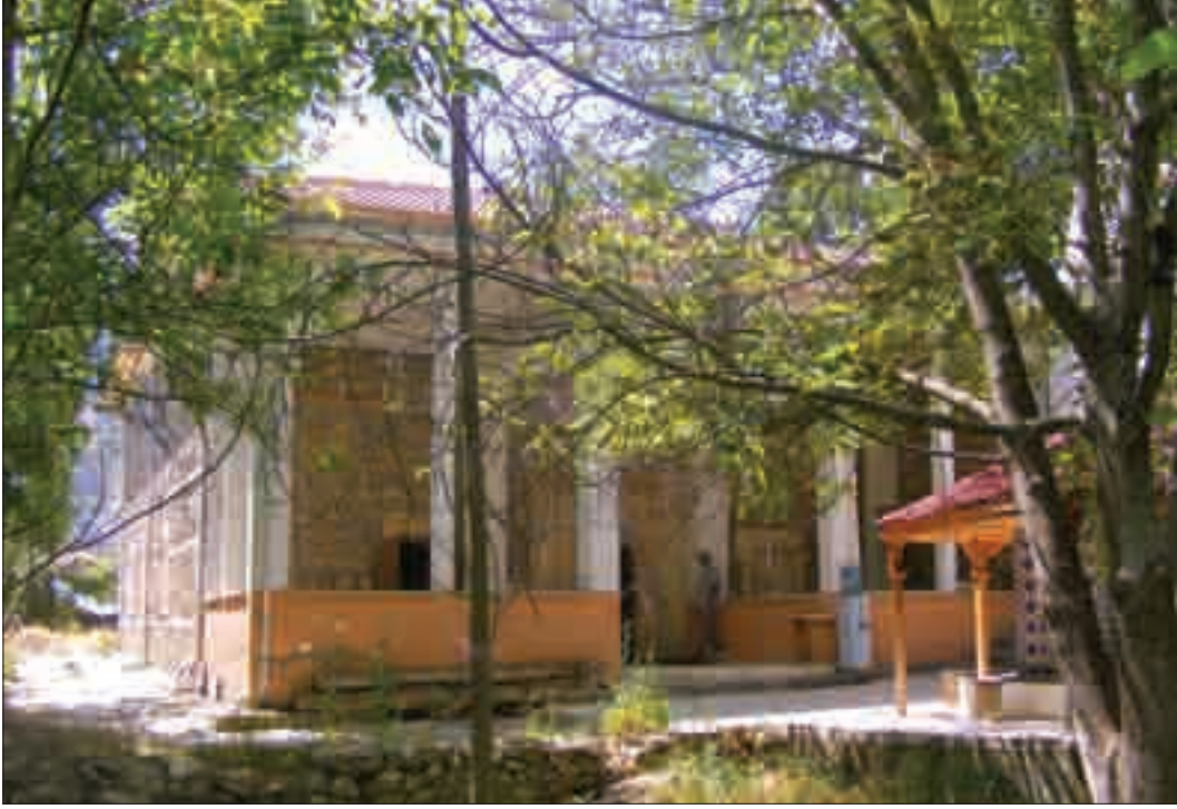
Resim 2: Bektaş Bey Camii'nin Kuzey Cephesi.