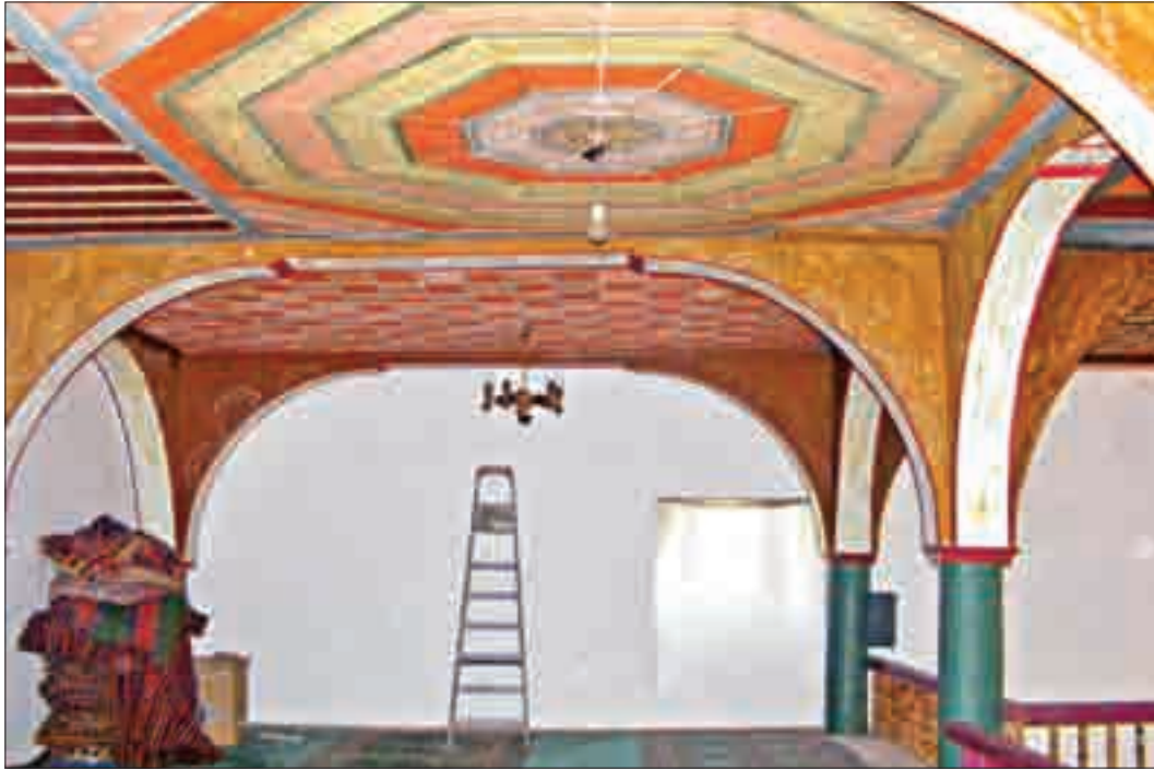
Resim 11: Mahfil Katındaki Tavan Süslemeleri.