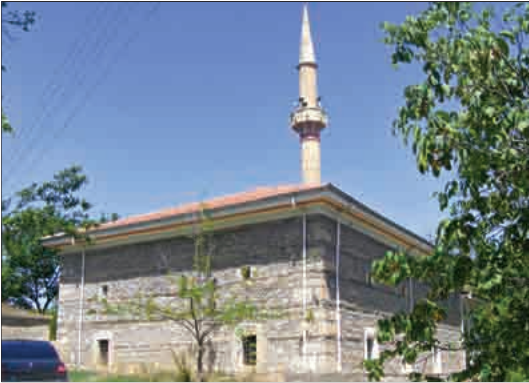
Resim 1: Bektaş Bey Camii'nin Güneydoğu Cephesi.