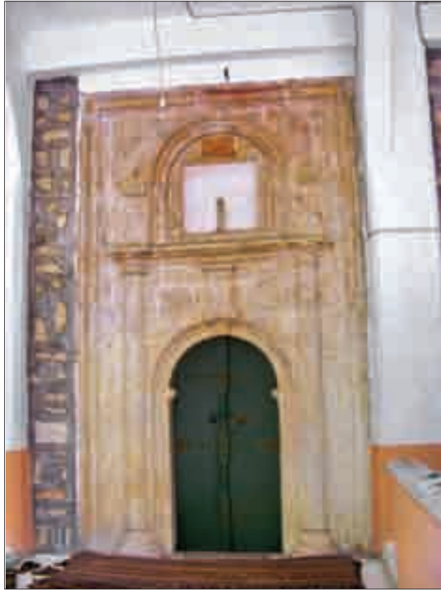
Resim 4: Bektaş Bey Camii'nin portalı.