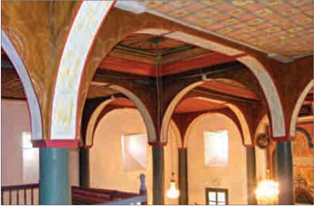
Resim 13: Mahfilden Harimin Görünümü.