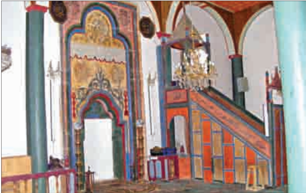
Resim 5: Bektaş Bey Camii'nin Mihrap ve Minberi.