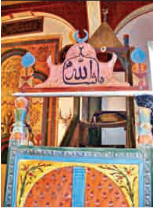
Resim 9: Minber Kapı Tacı.